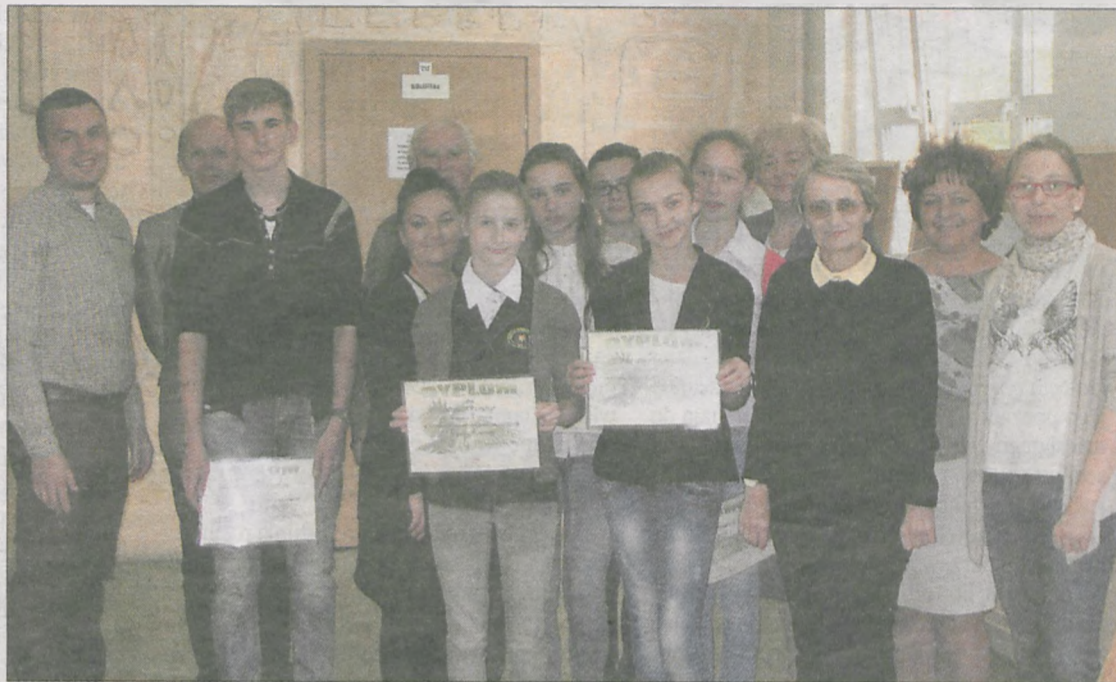
Uczestnicy konkursu z organizatorami