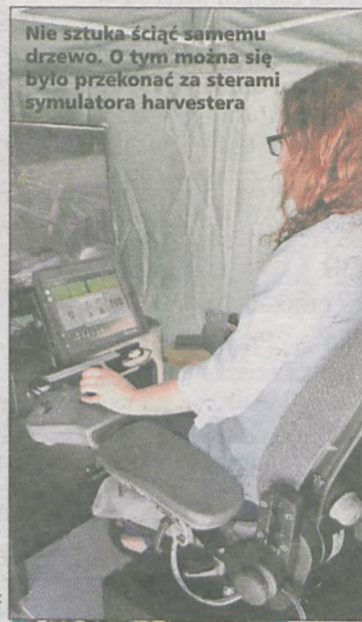
Nie sztuka ściąć samemu drzewo. O tym można się było przekonać za sterami symulatora harwestera