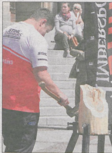
Ocena dokładności ścięcia fragmentu pnia na czas