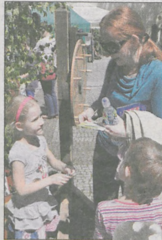
Weseli uczestnicy jednego z konkursów

28 czerwca Lasom Państwowym stuknie 90-tka. Data ta związana jest z nadaniem w 1924 roku przez Prezydenta RP statutu przedsiębiorstwu „Polskie Lasy Państwowe”. Planowany pierwotnie komercyjny charakter firmy został pod wpływem krytyki leśników zmieniony. 30 grudnia 1924 r. wyodrębniono administrację państwową, do dzisiaj znaną jako ALP czyli administracja lasów państwowych. W tamtym czasie leśistość kraju wynosiła 23,1%, a państwo administrowało na 31% wszystkich lasów. Po II wojnie światowej leśistość w nowych granicach wynosiła 20,8%, lasy zajmowały 6,5 mln ha, a ALP zarządzała na 85% tej powierzchni (5,4 mln ha). Ogromne zalesienia powojenne doprowadziły do wzrostu leśistości w roku 1970 do 27%. Dzisiaj mamy prawie 30% leśistość, a na skutek postarzenia drzewostanów dostarczamy na rynek ponad 33 mln m 3 drewna grubego (do przetarcia i na papier oraz na sklejki i okleiny). Lasy Państwowe są największym w Europie zarządcą leśnym. Piękno i zagospodarowanie naszych lasów jest przedmiotem zazdrości innych narodów. My leśnicy jesteśmy przede wszystkim dumni z roli, jaką odgrywamy w systemie ochrony przyrody. Nie może być inaczej, skoro 32 tys. gatunków zwierząt, roślin i grzybów związane jest ściśle ze środowiskiem leśnym (to 65% wszystkich gatunków). Lasów przybywa, są coraz starsze, dają coraz więcej drewna, są domem dla tysięcy różnych istot i mają dobrego gospodarza - tak jest od 90 lat.