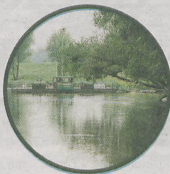
Prom Nikodem przepływający do rezerwatu

Edukacji Leśnej w Czeszewie należy zgłaszać: osobiście w siedzibie Nadleśnictwa w Jarocinie (ul. Kościuszki 43, tel. fax. (62) 747-23-19, e-mail: jarocin@poznan.lasy.gov.pl ) oraz w OEL (Czeszewo, ul. Szkolna 29, tel. (61) 438-31-21, e-mail: oel.czeszewo@poznan.lasy.gov.pl ).