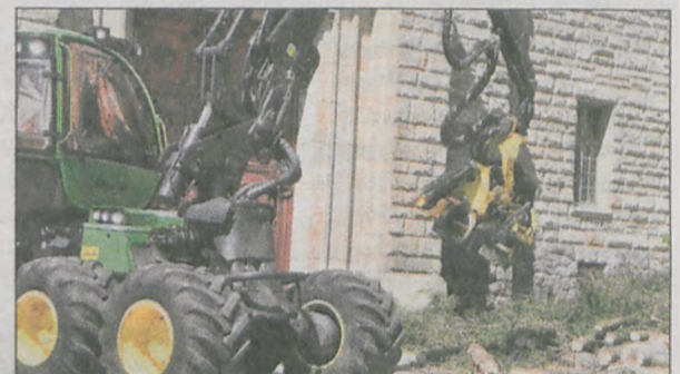
O potężnej mocy maszyn świadczących ryk pił, lecące wióry i stos wyrobionych drewnianych wałków