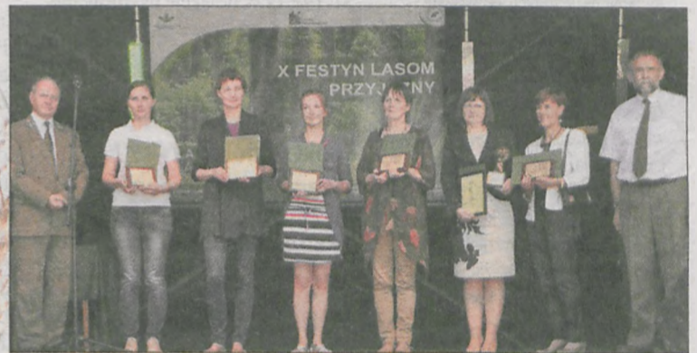
Wręczenie statuetki Lasom Przyjazny oraz wyróżnień kapituły