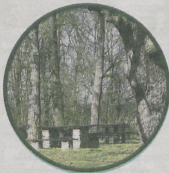
Pole z miejscem na ognisko w Żerkowsko-Czeszewskim Parku Krajobrazowym

Z punktu rozciąga się widok na malownicze tereny Żerkowsko-Czeszewskiego Parku Krajobrazowego, widoczny jest również pałac - muzeum Adama Mickiewicza w Śmiełowie. Punkt jest wyposażony w tablicę informacyjną, ławki, stoły i wiatę z zadaszeniem.