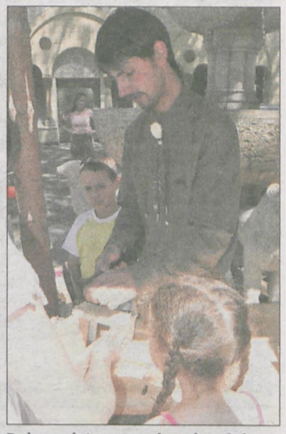
Dużym zainteresowaniem cieszył się punkt budowy ptasich budek

Pokazy sokolnictwa (na zdjęciu puchacz). O jego dziennej aktywności świadczy jasna barwa oczu.