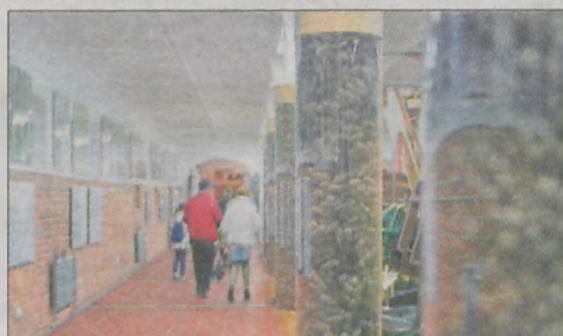
Nauka w praktyce