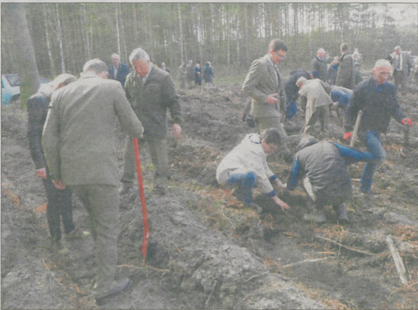
Od pracy i rozmów aż wrzało