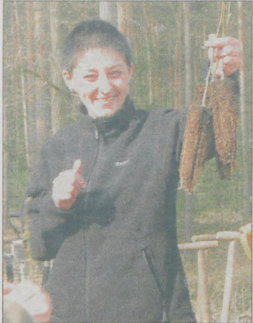
Przygotowane ze szkółki sadzonki posiadały zamknięty zmkoryzowany system korzeniowy