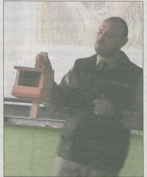
To jeden z typów budek, jakie zostawiliśmy uczniom w szkole