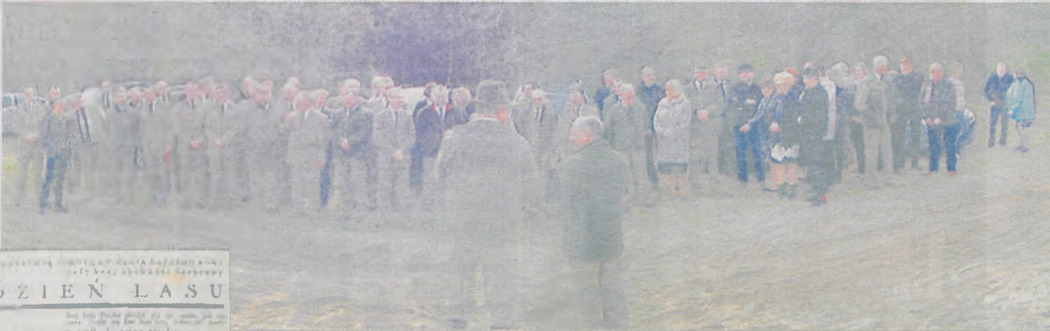
Zbiórka przed sadzeniem W wyznaczonym miejscu stawili się cała załoga Nadleśnictwa Jarocin