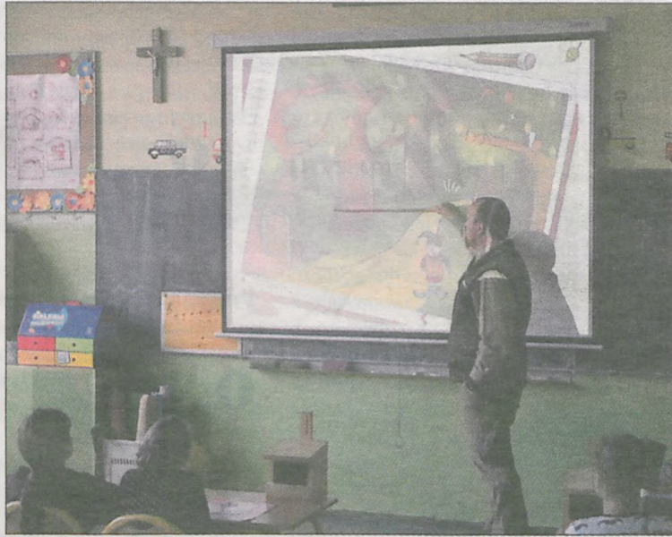
Najmłodszy poznawali piętra lasu i żyjące w nim zwierzęta