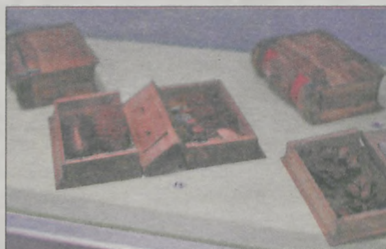
Tak wyglądały drewniane książki do nauki o płodach lasu