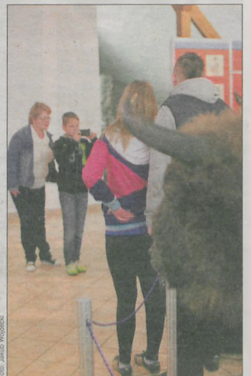
Zdjęcie z zubrem to już konieczność