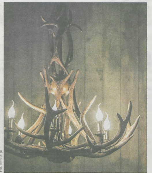
Z przyniesionych z lasu poroży wykonuje się przedmioty użytkowe