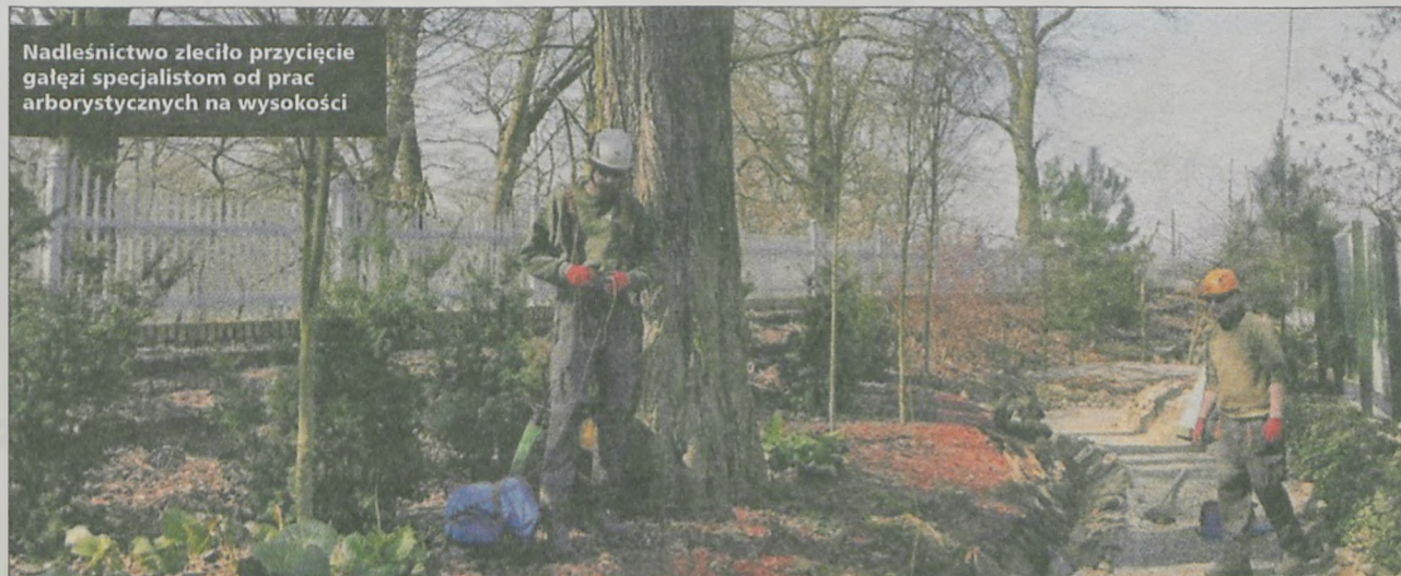
Nadleśnictwo zleciło przycięcie gałęzi specjalistom od prac arborystycznych na wysokości

Ośrodek Edukacji Leśnej „Centrum Zarządzania Łęgami” W Czeszewie ul. Szkolna 29, 62-322 Orzechowo tel. +48 61-438-31-21, e-mail: oel.czeszewo@poznan.lasy.gov.pl