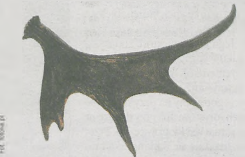
W naszych lasach można napotkać również zrzuty poroża danieli