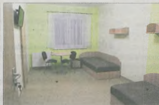
W nowym DPS-ie jest 67 pokoi - większość dwuosobowych z łazienkami