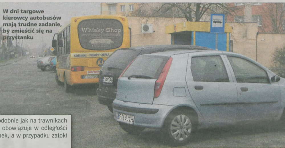
W dni targowe kierowcy autobusów mają trudne zadanie, by zmieścić się na przystanku

► Parkowanie na przystankach autobusowych, podobnie jak na trawnikach i ścieżkach rowerowych, jest zabronione. Zakaz obowiązuje w odległości 15 m od słupka lub tablicy oznaczającej przystanek, a w przypadku zatoki przystankowej - na całej jej długości.