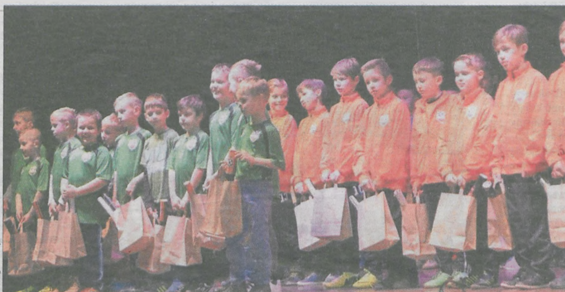
Podsumowanie 2015 roku Akademii Piłkarskiej Reissa odbyło się w Jarocińskim Ośrodku Kultury

- Rok temu, gdy do sali konferencyjnej hotelu Jarota przybyło na nasze spotkanie podsumowujące rok 2014 ponad 200 osób, postanowiłem, że kolejne takie wydarzenie odbędzie się w JOK-u. Biorąc pod uwagę frekwencję w dniu dzisiejszym oraz odświeżony ubiór zawodników, śmiało możemy nazwać nasze spotkanie Galą Akademii Piłkarskiej Reissa Jarocin - która stanie, a właściwie już się stała naszą coroczną tradycją. Jest to forma podziękowania zawodnikom oraz ich rodzinom za za-