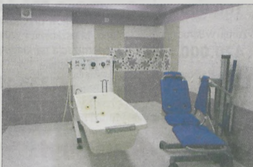
Oprócz łazienek przy pokojach, na poszczególnych kondygnacjach są ogólne łazienki ze specjalnym wyposażeniem