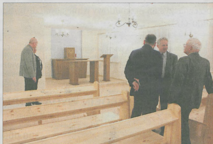
W nowym DPS-ie znalazło się miejsce na kaplicę