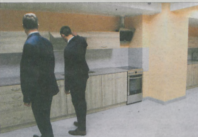
Do dyspozycji mieszkańców na każdej kondygnacji znajduje się świetlica z nowoczesnie wyposażonymi aneksami kuchennymi