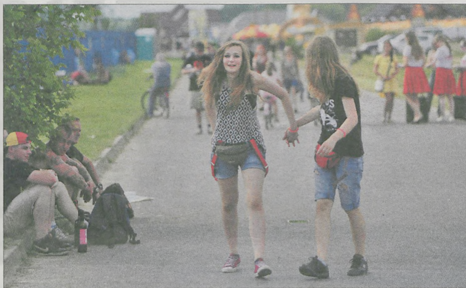
W poprzednich latach najwięcej jarociniaków można było spotkać na ulicy Maratońskiej. Czy dzięki specjalnejniżce w przyszłym roku liczniej wejdą na teren imprezy?

Legendarna amerykańska grupa Slayer zagra w lipcu na festiwalu w Jarocinie. W ubiegłym tygodniu organizatorzy ogłosili pierwsze zespoły, jakie wystąpią podczas imprezy. Jednocześnie ruszyła przedsprzedaż karnetów. Cena? 70 zł, ale tylko dla osób z powiatu jarocińskiego. Przyjezdni zapłacą ponad trzy razy więcej.