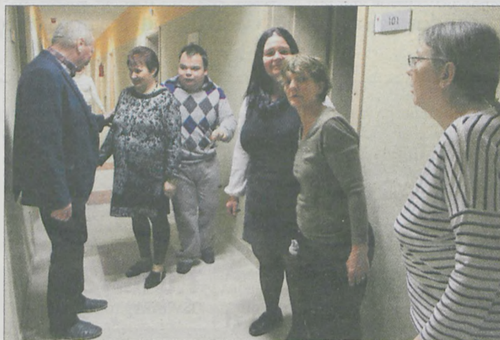
Niektórzy mieszkańcy Domu Pomocy Społecznej już sobie wybrali pokoje