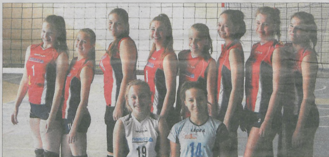
Młodziczki TKS-u Siatkarz jako jedyna drużyna wygrała wszystkie dotychczasowe spotkania w mistrzostwach Wielkopolski