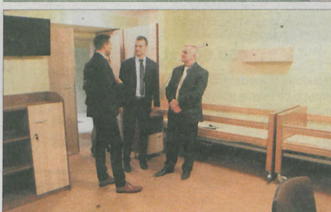
Są też sale do rehabilitacji i sale dla osób leżących