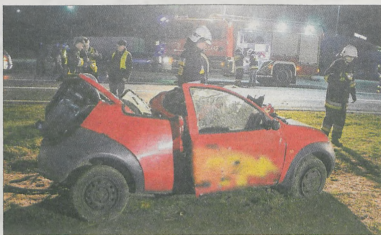
Fordka była kompletnie zmiążdżona

Ratownicy przy użyciu sprzętu hydraulicznego dostali się do uwięzionych w kompletnie zniszczonej przestrzeni pasażerskiej fordka. Wycięli bok, aby uwolnić pierwszego z mężczyzn. Równolegle inni strażacy odcinali dach, w celu wydobywania drugiej osoby. Kiedy jedna z ofiar była już na desce ortopedycznej, przyjechało pogotowie ratunkowe. Lekarz stwierdził jej zgon, po chwili okazało się, że nie żyje również drugi uczestnik wypadku. - Po uzgodnieniu z policją strażacy odstąpili od jego uwalniania. Pozostał on w pojeździe na czas prowadzonych czynności dochodzeniowych przez śledczych