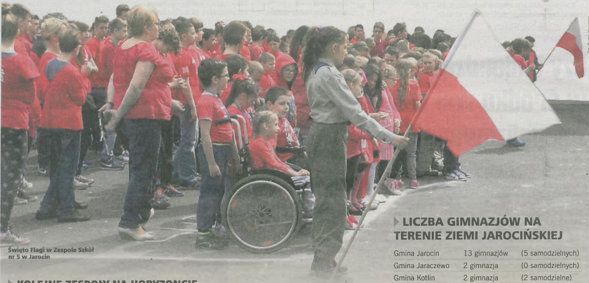
Święto Flagi w Zespole Szkół nr 5 w Jarocin