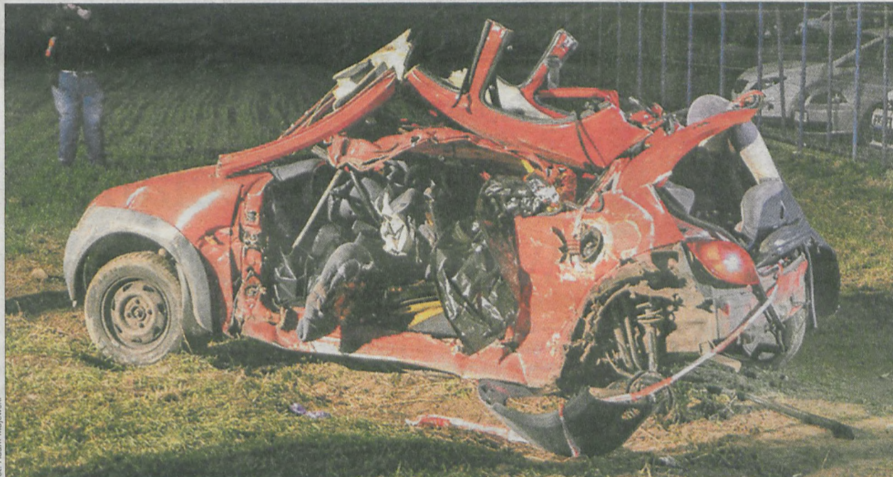
Aby uwolnić poszkodowanych strażacy musieli pociąć wrak auta