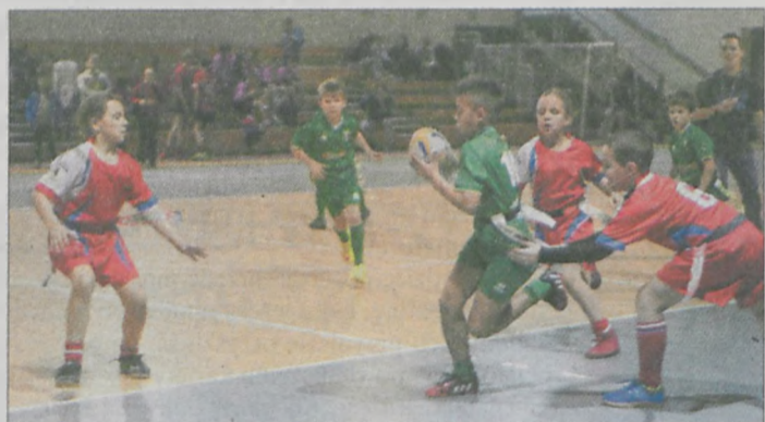
Drużyna Sparty Jarocin z klas III i IV szkół podstawowych okazała się najlepsza w Mikołajkowym Turnieju Rugby Tag