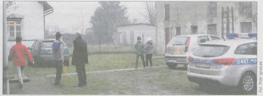
Prokurator wykluczył, by ktoś przyczynił się do śmierci mieszkanki Śmielowa