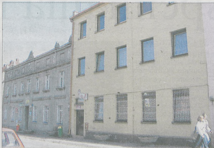
Jednym z obiektów, na którym miałyby zostać zamontowane baterie fotowoltaiczne, jest siedziba Urzędu Miasta i Gminy w Żerkowie