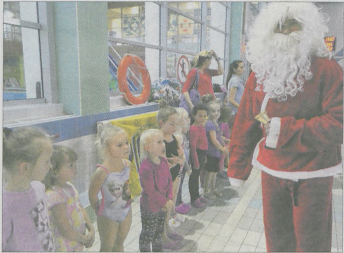
Dzieci podczas zawodów Ligi Pływackiej Piranii odwiedził Święty Mikołaj

Zawodnicy Ligi Pływackiej Piranii będą rywalizowali czterokrotnie. (faf)