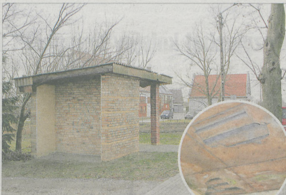
Wiata przystankowa w Chrzanie wymaga remontu. W najgorszym stanie jest dach