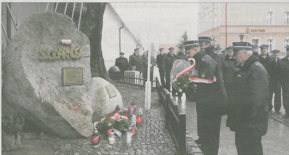
Po mszy w kościele św. Marcina odbyła się krótka uroczystość przy obelisku poświęconym „Solidarności”. Kwiaty złożyła m.in. delegacja ochotniczych straży pożarnych

wręcz obrzydzenie. (...) Ludzie w stanie wojennym nie mieli tego problemu. Potrafili wychodzić na ulice, zbierać się na protestach, które były rozpędzane za pomocą armatek czy nawet strzelb - tłumaczył ksiądz Walczak. Podkreślił, że historia jest ważną nauczycielką życia, dlatego istotne jest nie tylko niezapominanie o tamtych wyda-