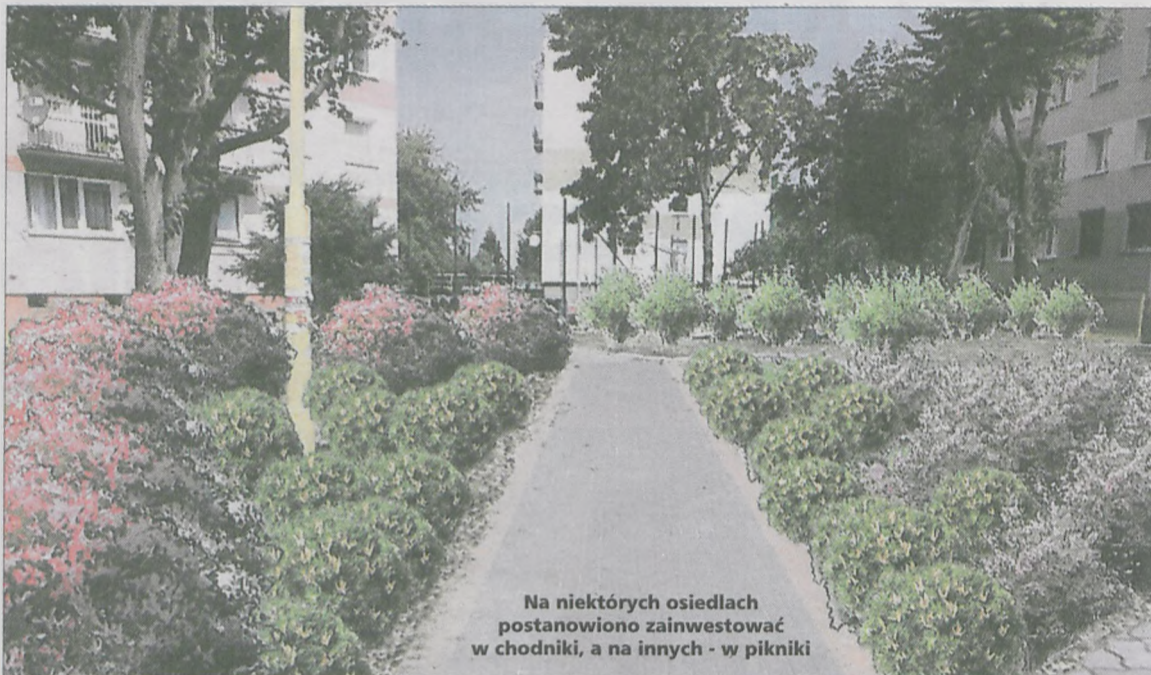
Na niektórych osiedlach postanowiono zainwestować w chodniki, a na innych - w pikniki

W odróżnieniu do poprzedniej formuły, każdy mógł oddać tylko jeden głos zamiast trzech. Należało też wybrać inwestycję dotyczącą osiedla, na którym jest się na stałe zameldowanym. Poza tym, głosowanie odbywało się wyłącznie poprzez internet. To rodziło obawy, że starsi mieszkańcy będą mieli kłopot z oddaniem swojego głosu. Mimo że pomocą służyły filie biblioteki, a po osiedlach z tabletkami w rękach chodzili ich przewodniczący, radni oraz autorzy projektów, to frekwencja „nie powala”. Najwyższa była na Glinkach, gdzie zainteresowanie budżetem obywatelskim sięgnęło 21%. To osiedle w ramach nagrody w kolejnej edycji JBO otrzyma bonus w wysokości połowy kwoty, jaka tym razem była do dyspozycji miesz-