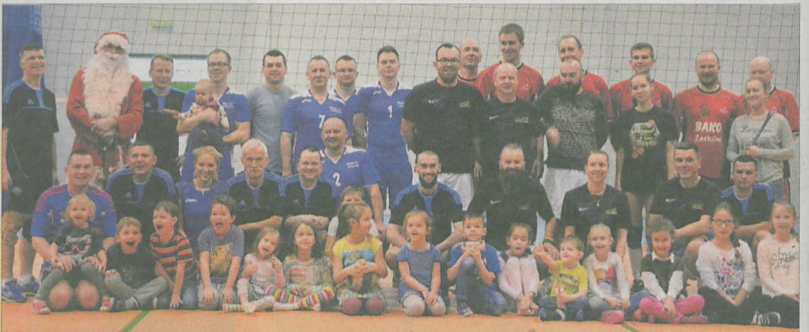
Uczestnicy Mikołajkowego Turnieju Siatkówki ze Świętym Mikołajem