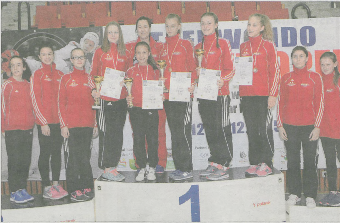
Dziesięcioosobowa ekipa Białych Tygrysów wywalczyła w Olsztynie pięć medali, w tym aż cztery złote