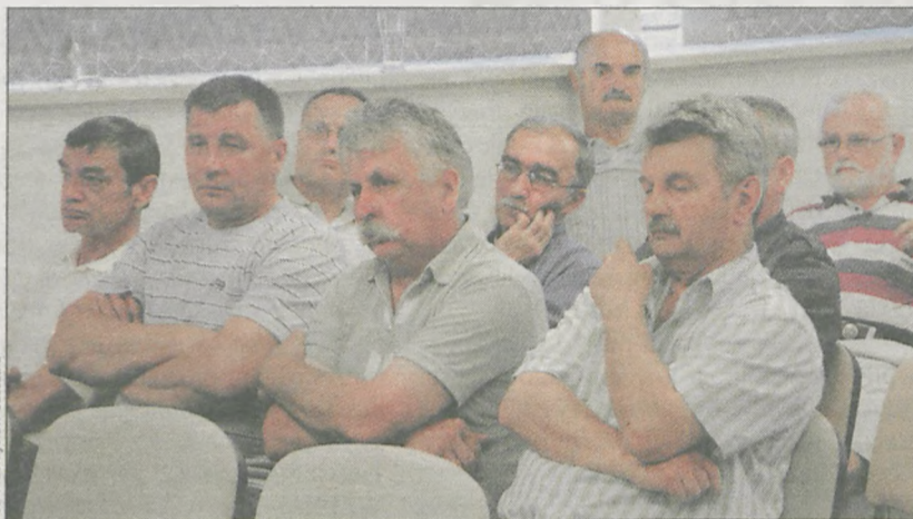
Walne Zebranie Stowarzyszenia JKS Jarota przyjęło uchwałę o skierowaniu wniosku do starosty w sprawie ustanowienia kuratora w klubie