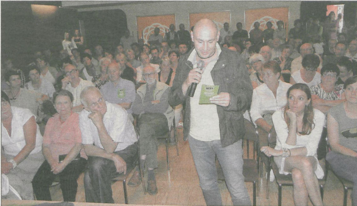
Zebrań spotkało się z dużym zainteresowaniem. Mieszkańcy mieli wiele pytań dotyczących nowych zasad odbioru śmieci

margarynach, a także stare buty należy wrzucać do kubła, opakowania po szamponach, płynach do mycia sanitariatów i napojach (pety) - do plastików. Worki foliowe można włożyć do osobnego worka i wystawić (ale musi być pełen worek).