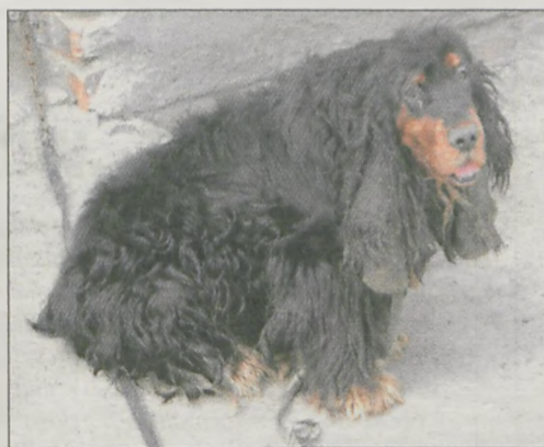
W najgorszym stanie były oczy i uszy spaniela

Inspektorzy Towarzystwa Opieki nad Zwierzętami w asyście strażnika miejskiego i policjantów interweniowali w Roszkowie. Z jednego z podwórek zabrali zaniedbanego cocker spaniela.