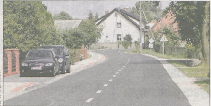
Przebudowana droga w Lisewie, mimo że jest w trakcie odbiorów, została już udostępniona kierowcom i pieszym

Zakończyła się trwająca dwa lata przebudowa drogi w Lisewie. Powiatowa inwestycja kosztowała ponad 500 tys. zł. Pierwszy etap został wykonany w ubiegłym roku. Wówczas skanalizowano istniejące rowy, wykonano studzienki rewizyjne i ściekowe oraz odpływ wody. Zadanie kosztowało ponad 171 tys. zł.