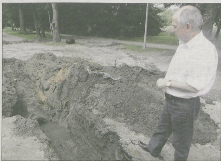
Dyrektor Komunalnego Zakładu Budżetowego w Jaraczewie nadzoruje prace przy udrażnianiu rur w pobliżu strzelnicy