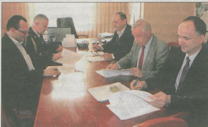
Powiat stanie do rywalizacji o fundusze dla straży pożarnej. Porozumienie w tej sprawie podpisały najważniejsze osoby w starostwie i PSP

Jarocińscy strażacy razem z 4 innymi komendami powiatowymi z województwa wielkopolskiego zgłosili swój udział w konkursie ogłoszonym przez Narodowy Fundusz Ochrony Środowiska i Gospodarki Wodnej w Warszawie. By