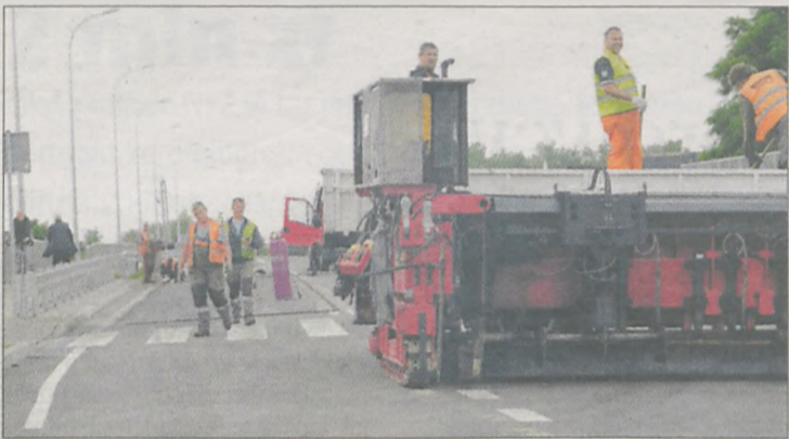
Drogowcy z ciężkim sprzętem wrócili na wiadukty