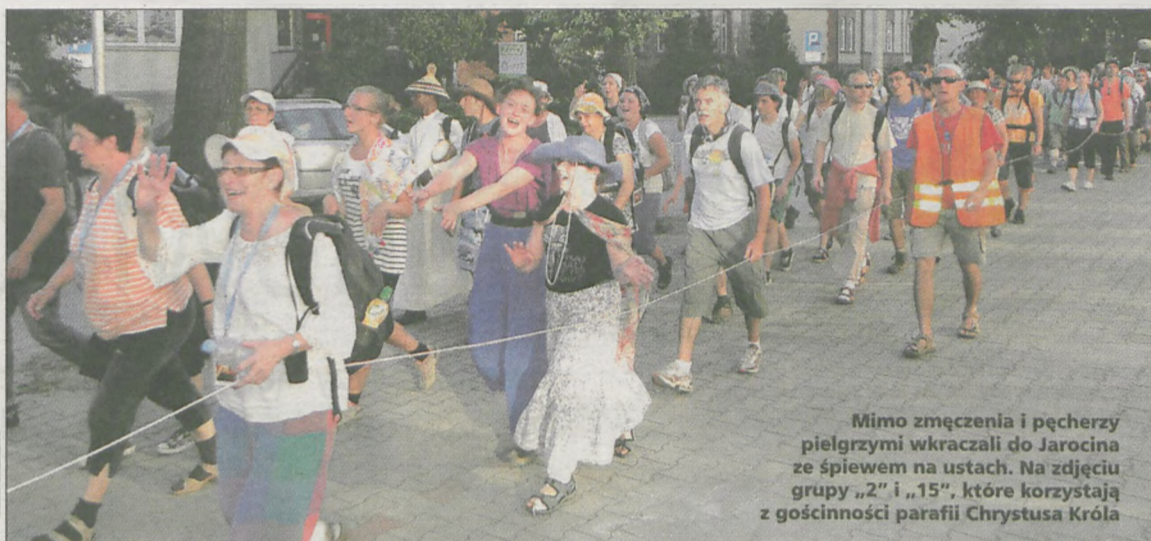
Mimo zmęczenia i pęcherzy pielgrzymi wkraczali do Jarocina ze śpiewem na ustach. Na zdjęciu grupy „2” i „15”, które korzystają z gościnności parafii Chrystusa Króla

- Sama nie mogę iść na pielgrzymkę, choć bardzo bym chciała, ale chociaż w takiej formie mogę pomóc. Moi pielgrzymi w podzięce pomodlą się także w mojej intencji przed obliczem Maryi na Jasnej Górze - wyjaśniła jedna z jarocinianek. Pańnicy po krótkiej modlitwie w kościele i odebraniu bagaży mogli wreszcie udać się na spoczynek, umyć się i zjeść kolację. W poniedziałek 18 lipca od godz. 6.00 kontynuowali wędrówkę do Częstochowy. Jak przyznają idący najtrudniejsze są zawsze