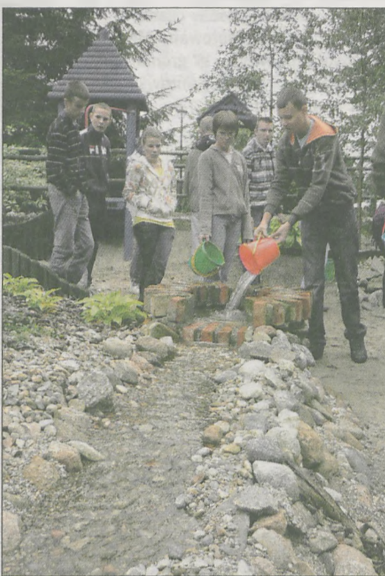
Ostatni bieg Rzeki w tym roku