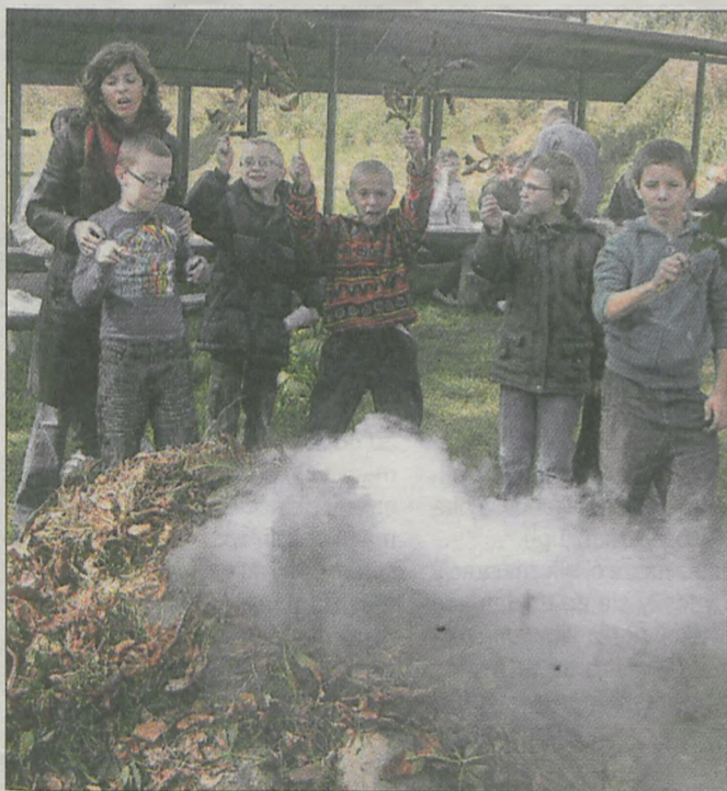
Liście kasztanowców muszą zostać spalone lub zutylizowane. Na zdjęciu uczniowie ZSS w Jarocinie po zakończeniu akcji ratowania kasztanowców