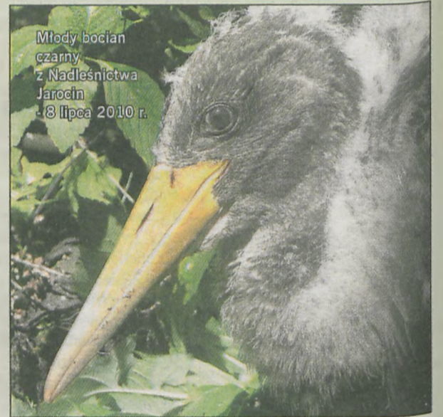
Młody bocian czarny z Nadleśnictwa Jarocin - 8 lipca 2010 r.

Najstarszego z nich, obecnie w 5. roku życia, zaobrazkował 6 lipca 2006 r. na terenie Żerkowsko-Czeszowskiego Parku Krajobrazowego (który ma zresztą bociana czarnego w herbie), w gminie Miłostaw (powiat