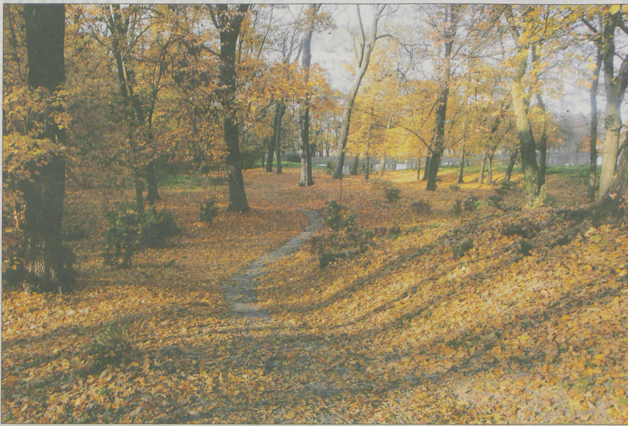
Złota polska jesień 2011 w Parku Powstańców Wielkopolskich w Jaraczewie