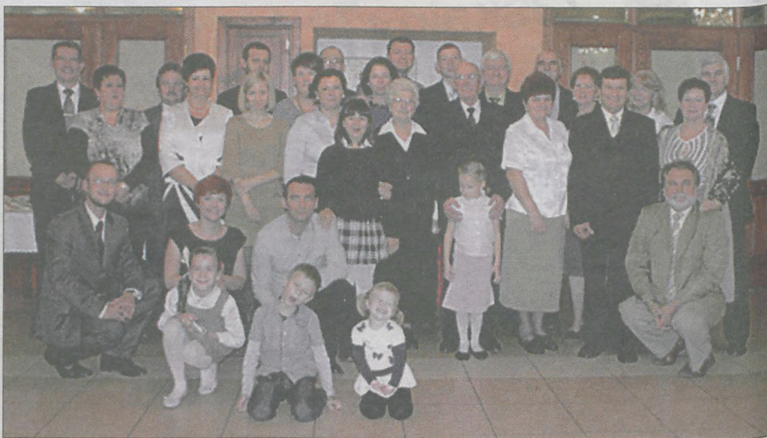
Diamentowe gody z jubilatami świętowała najbliższa rodzina

utrzymaniu było 5 osób. Jeden z synów był poważnie chory. Zimą woda w kuchni w wiadrach była zamrożona. Na ścianach był taki szron, że nie było widać wałków - mówi kobieta.