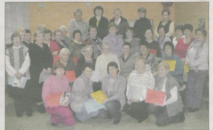
Kilkadziesiąt kobiet uczyło się zasad rozsądnego pożyczania pieniędzy