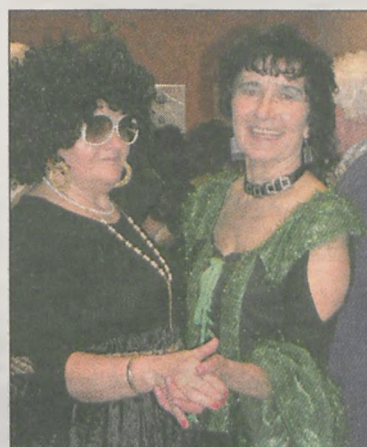
Nawet zbyt mała ilość mężczyzn nie przeszkadzała w dobrej zabawie

(Is)