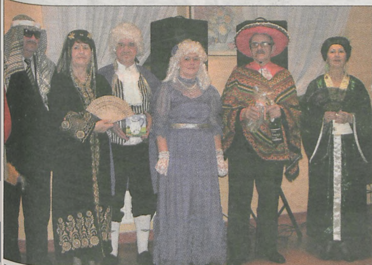
Nagrodami za najlepsze przebrania były drobne upominki. Uwagę wszystkich zwracała „myszka Miki” bawiąca się z „kotem w butach”