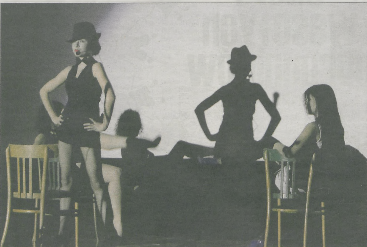
3 marca 2011, kino „Echo” w Jarocinie. Festiwal Piosenki Filmowej, zorganizowany przez klasę II h z ZSO w Jarocinie