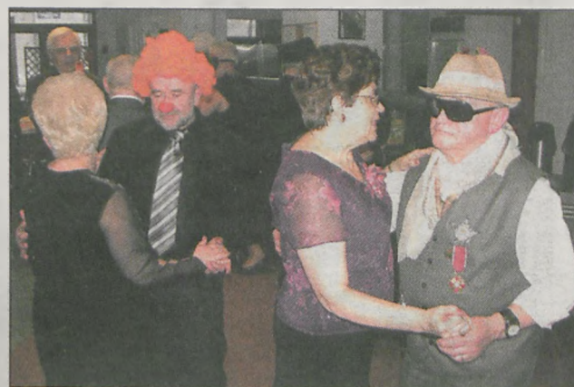
Po trzech latach nikogo już nie dziwi fakt, że seniorzy przebierają się w kostiumy. Chętnych jest więcej niż miejsc na balu

więcej zdjęć na stronie www.jarocinska.pl