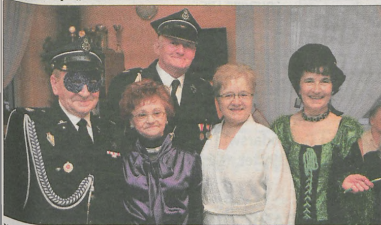
W tym roku obrodziło w mundurowych. Pojawili się strażacy i górnik