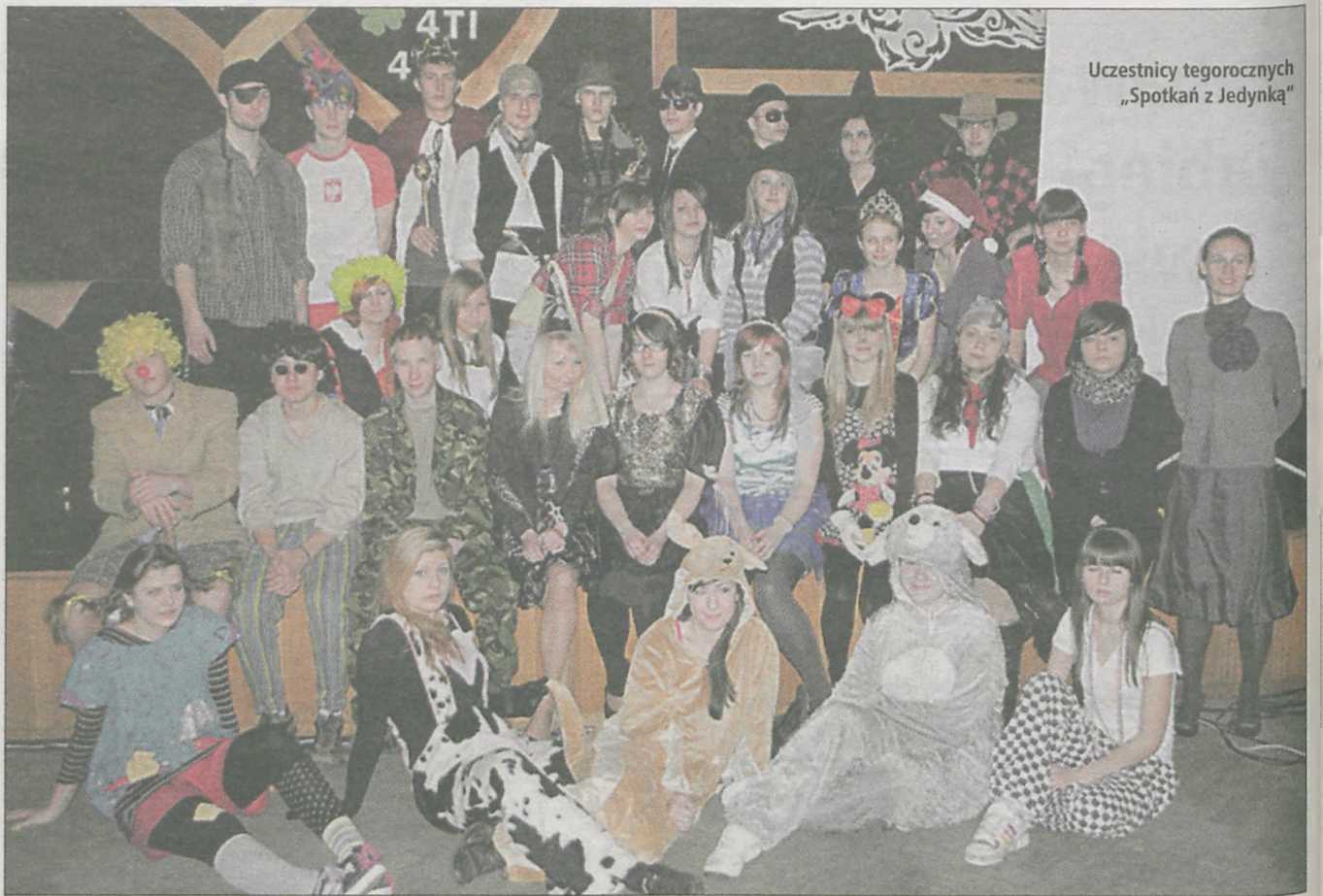
Uczestnicy tegorocznych „Spotkań z Jedyńką”

Organizatorem tegorocznej imprezy była pierwsza klasa liceum ogólnokształcącego, a poczęstunek przygotowali uczniowie pierwszej klasy technikum żywienia. (ann)