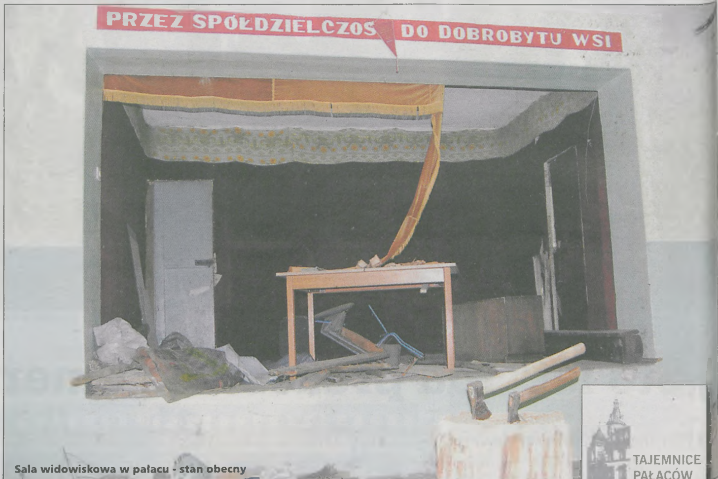
Sala widowiskowa w pałacu - stan obecny