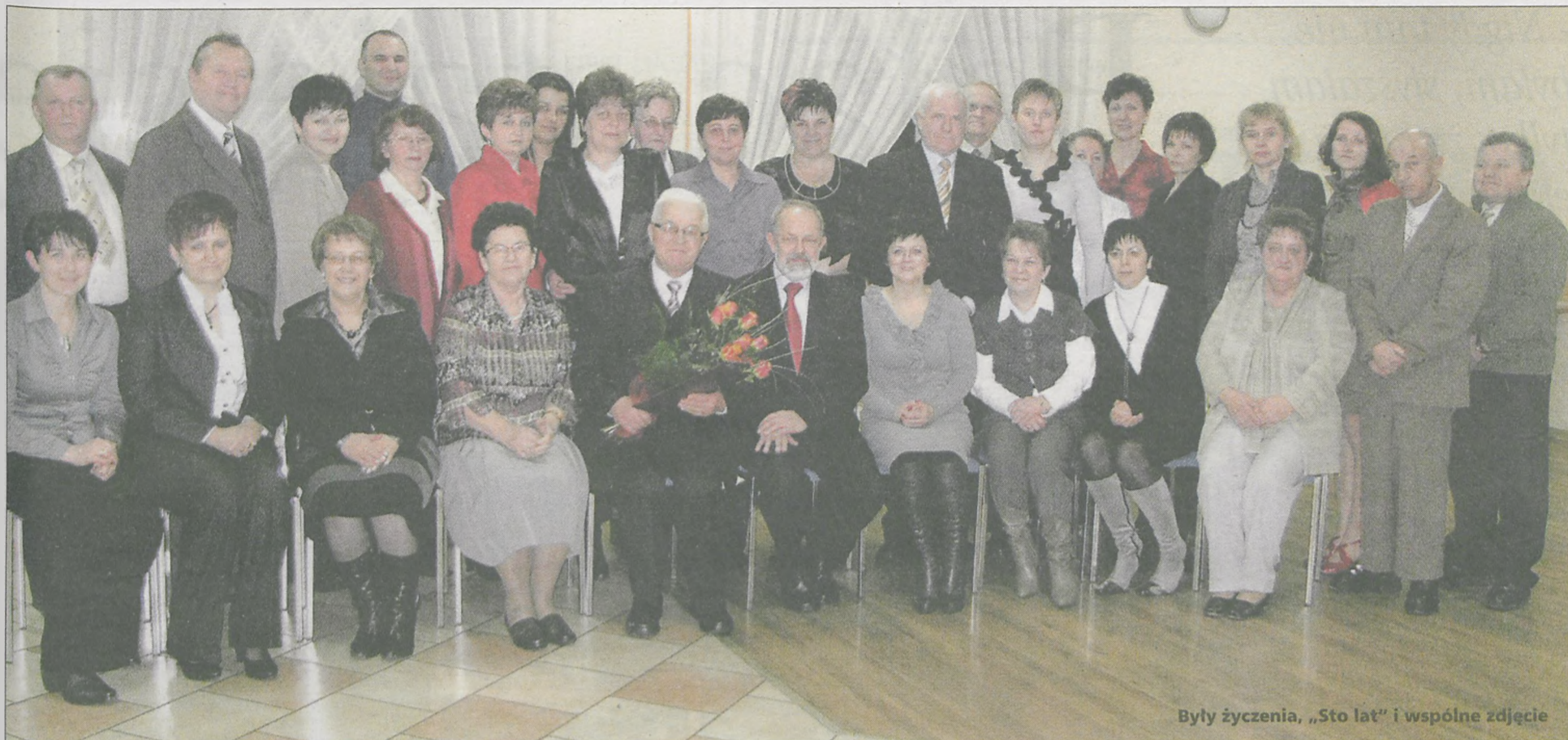
Były życzenia, „Sto lat” i wspólne zdjęcie