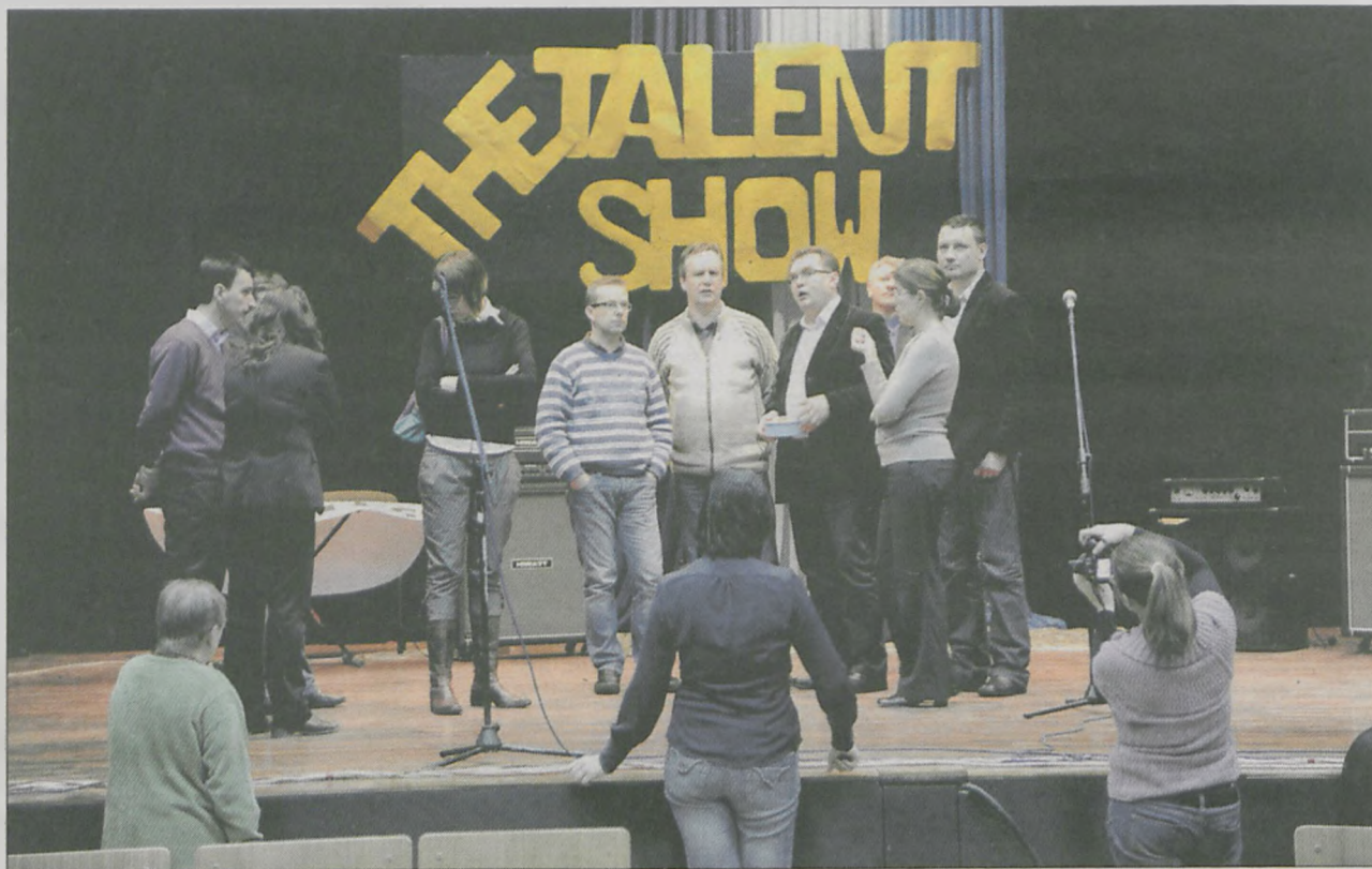
The talent show - czyli radni Rady Miejskiej w Jarocinie na scenie Jarocińskiego Ośrodka Kultury