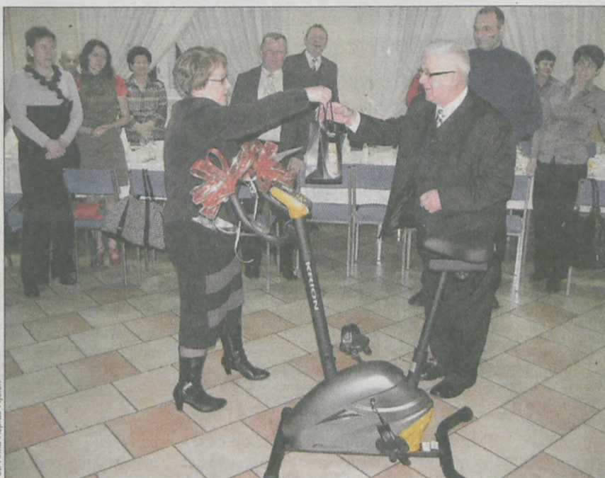
Od pracowników prezes otrzymał w prezencie m.in. rower treningowy

Od załogi dostał w prezencie rower treningowy - „żeby nie wyszedł z formy” i szwajcarski zegarek - „żeby odmierzał tylko same dobre chwile”. - To jest coś, co mi doktor ortopeda w Poznaniu zalecił - przyznał mile zaskoczony prezes. - (...) Wiek emerytalny po to jest nam dany, by realizować niespełnione plany. Więc nie ma co patrzeć na swą kartę zdrowia, tylko żyć i się delektować. Brać wszystko, co jeszcze do wzięcia zostało, póki posłuszeństwa nie odmówi ciało - odczytała jeszcze dołączone do prezentu życzenia księgowa.