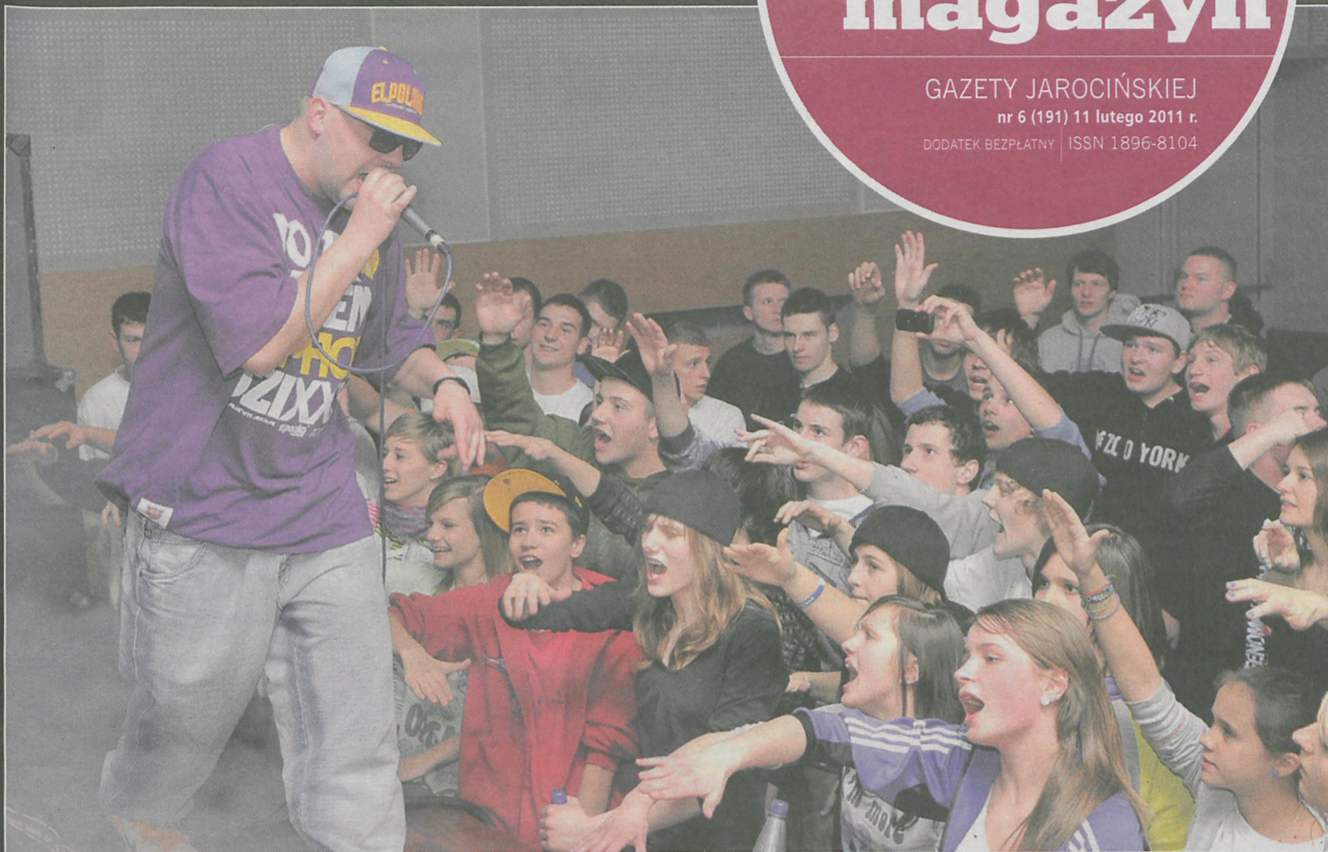
Gwiazdą show był raper DonGURALesko

GAZETY JAROCIŃSKIEJ nr 6 (191) 11 lutego 2011 r. DODATEK BEZPŁATNY | ISSN 1896-8104