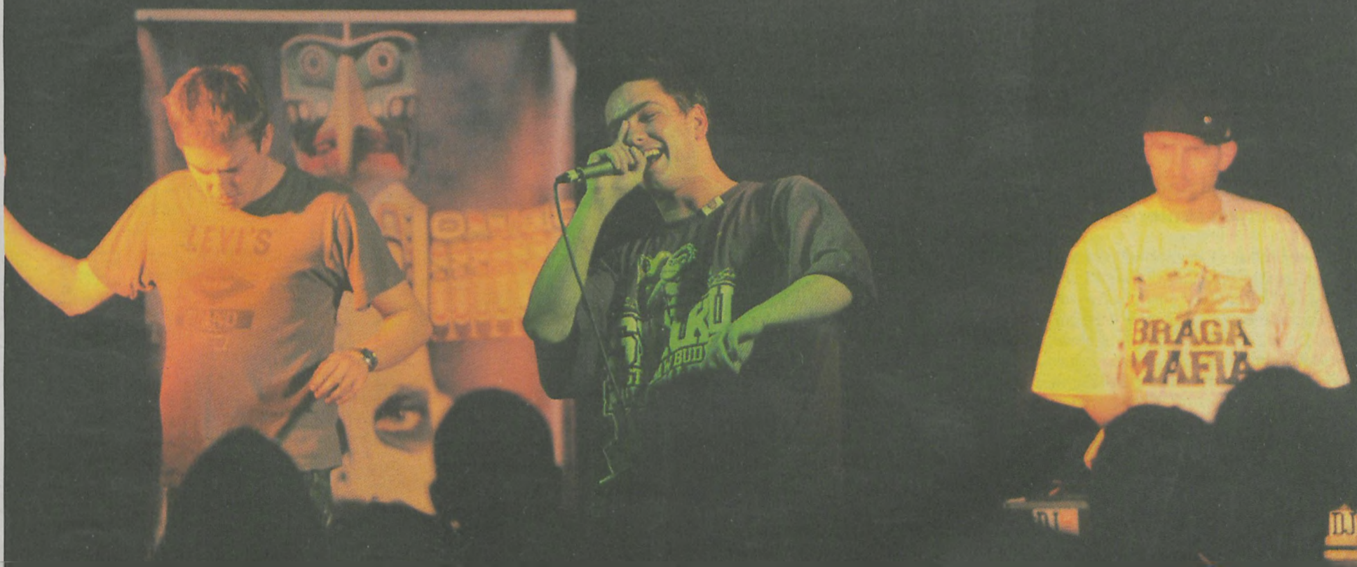
DonGURALesko supportowała grupa Gryph