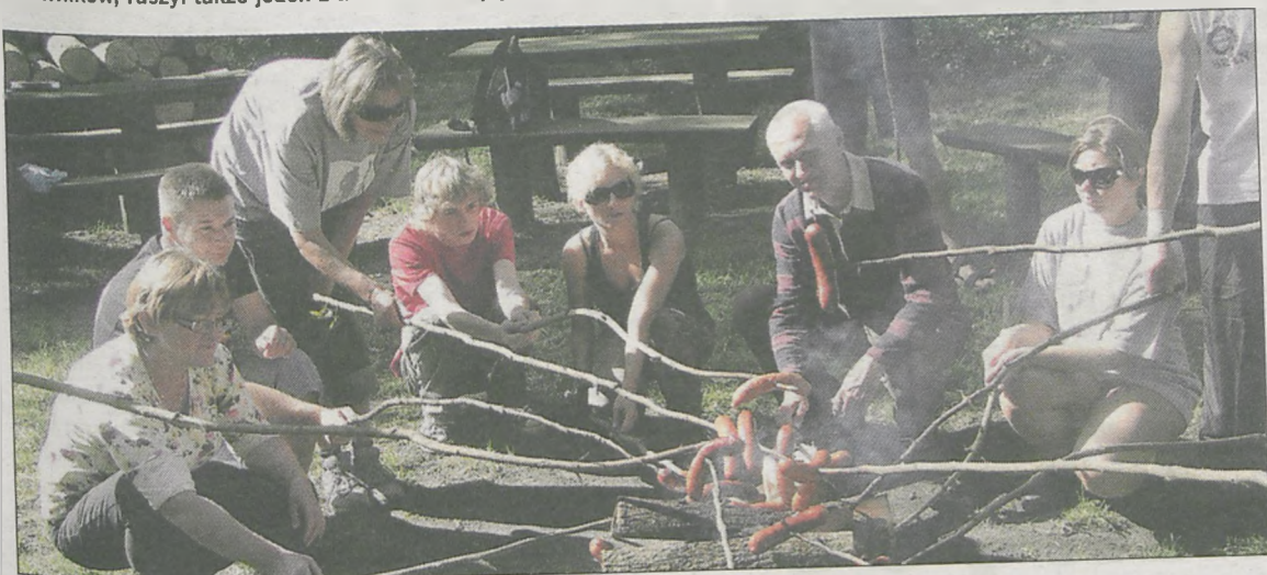
Tradycyjnym punktem spływu kajakowego jest pieczenie kiełbasek

Spływ kajakowy na zakończenie „Letnich wędrówek z Gazetą”