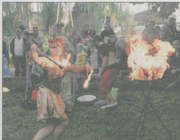
Aktorzy z Zielonej Góry zaprezentowali przedstawienie „Kozieł” (na zdjęciu) oraz pokaz żonglerki ogniem