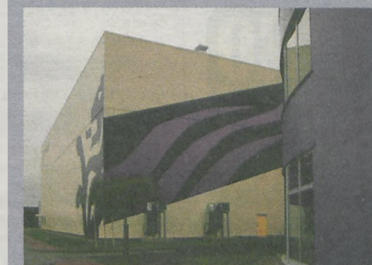
Hala produkcyjna Zeelandia Super Bake, Tarnowo Podgórze

15 lat, ponad 110 wybudowanych hal stalowych i żelbetowych.