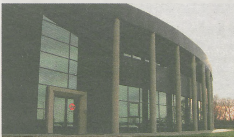
Hala magazynowa Lobo w Poznaniu.

— Generalne wykonawstwo w zakresie budowy hali produkcyjnej wraz z zapleczem biurowo-socjalnym w technologii konstrukcji stalowej oraz obudowy hali w technologii płyty warstwowej wraz z zagospodarowaniem i utwardzeniem terenu wokół hali. Powierzchnia: 1000 m 2 . Inwestor: ZOBAL Zakład Obróbki Aluminium.