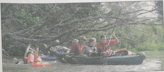
Nikt nie spodziewał się, że nurt na Prośnie będzie tak wartki. Podczas zderzenia z przewróconym drzewem, załoga dwóch kajaków już na samym początku trasy znalazła się w wodzie. Na pomoc, oprócz ratowników, ruszył także jeden z uczestników spływu