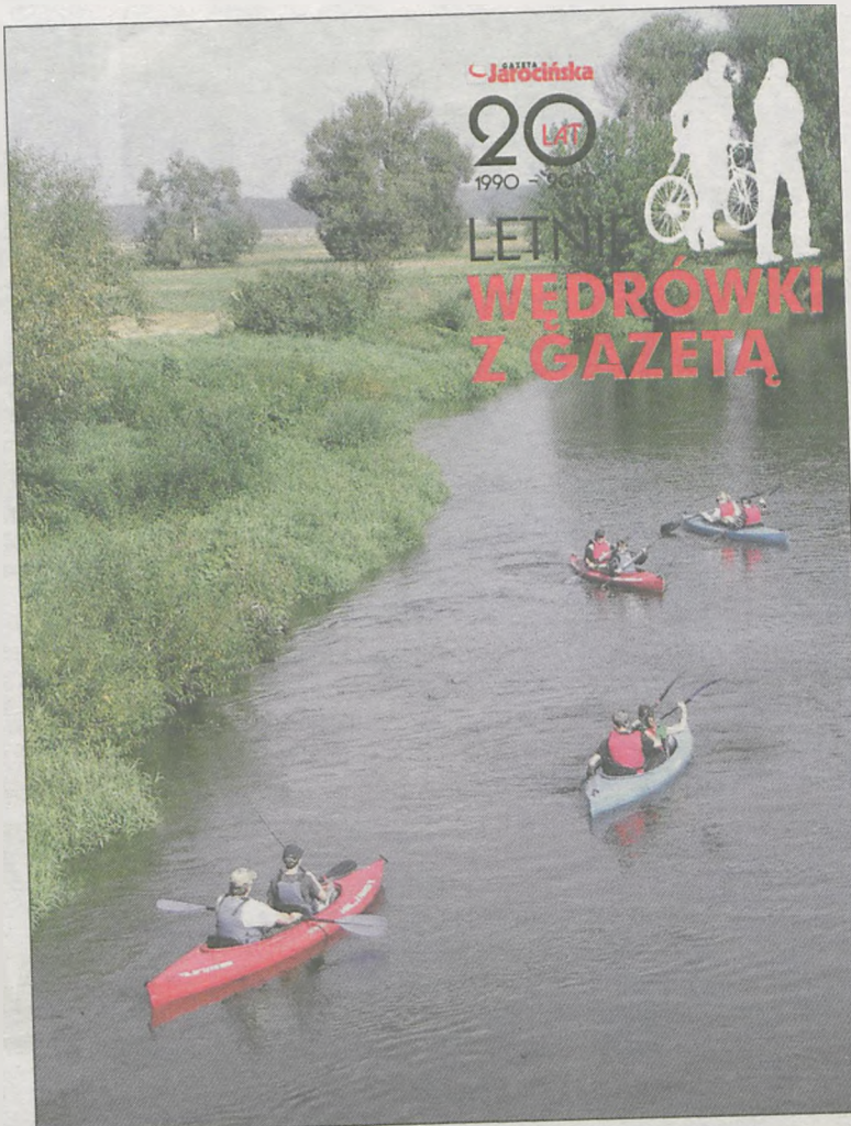
Spływ zaczynał się na Prośnie w Rudzie Komorskiej (gm. Pyzdry), a kończył na Warcie w Dębnie