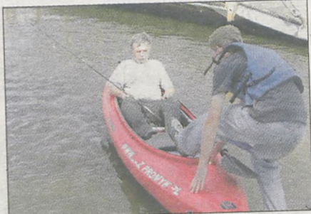
Jeden z uczestników płynąc łowił ryby