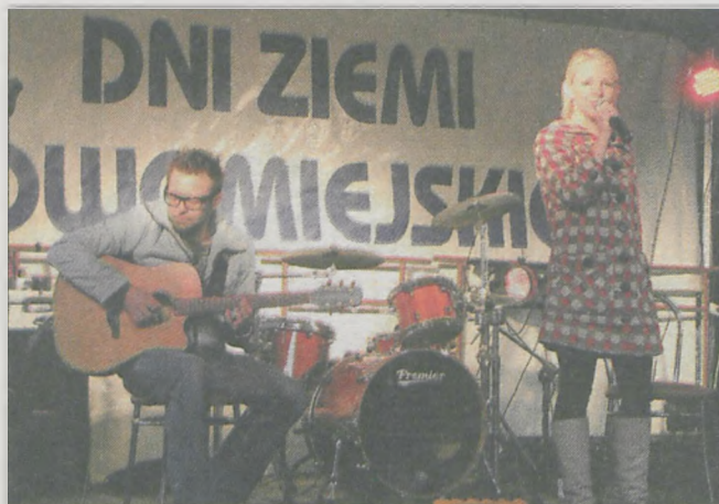
Gwiazdą Dni Ziemi Nowomiejskiej była Alicja Janosz - laureatka pierwszej edycji programu „Idol”