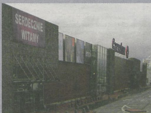
Centrum handlowe Twierdza I i II, Kłodzko