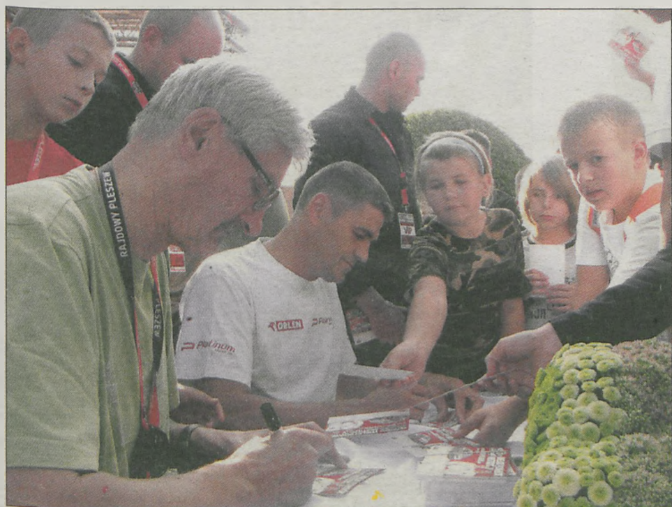
Po autografy do Krzysztofa Hołowczyca i Macieja Wisławskiego ustawiły się kolejki dorosłych i dzieci

Największą atrakcją był powrót Krzysztofa Hołowczyca i Macieja Wisławskiego do rajdów. Zgodzili się, by w małej miejscowości w Wielkopolsce wspólnie znów zasiąść w aucie rajdowym. To najbardziej charyzmatyczny, doświadczony, utytułowany i sympatyczny duet naszego środowiska rajdowego.