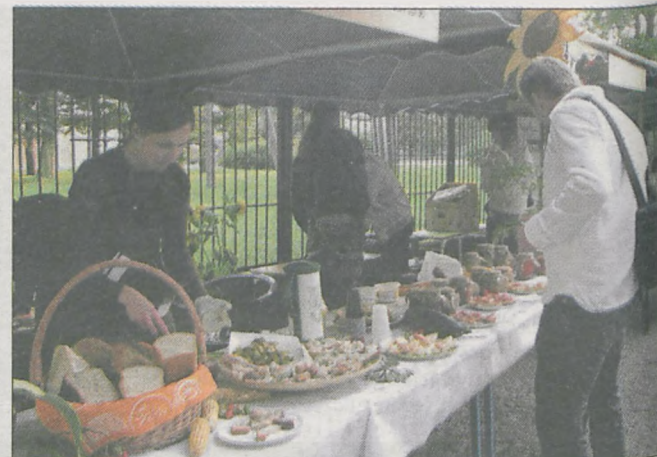
Na festynie nie zabrakło również stoiska kulinarnego, na którym można było spróbować m.in. chleba ze smalcem

Festyn został zorganizowany po raz drugi przez grupę młodych działaczy Stowarzyszenia Miłośników Ziemi Nowomiejskiej. Impreza, której głównym założeniem jest integracja mieszkańców gminy, odbywa się co roku w pierwszy weekend września, za każdym razem w innej miejscowości. Pierwsza edycja Dni Ziemi Nowomiejskiej miała miejsce w Nowym Mieście. W tym roku odbyła się w Klęce, a następna planowana jest w Chociczy.