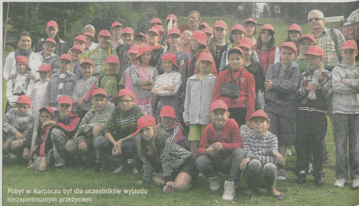
Pobyt w Karpaczu był dla uczestników wyjazdu niezapomnianym przeżyciem