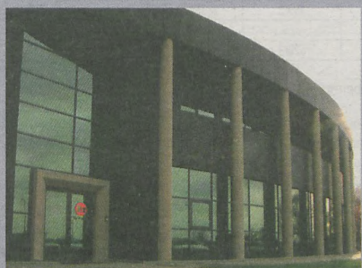
Hala magazynowa Lobo, Poznań