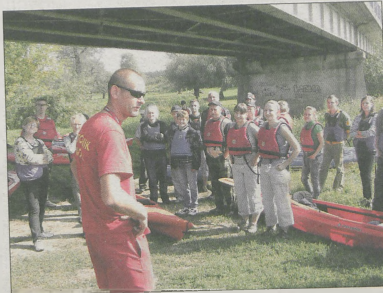
Przed wypłynięciem ratownicy informowali, jak zachowywać się w kajakach i co zrobić w przypadku wypadnięcia do wody