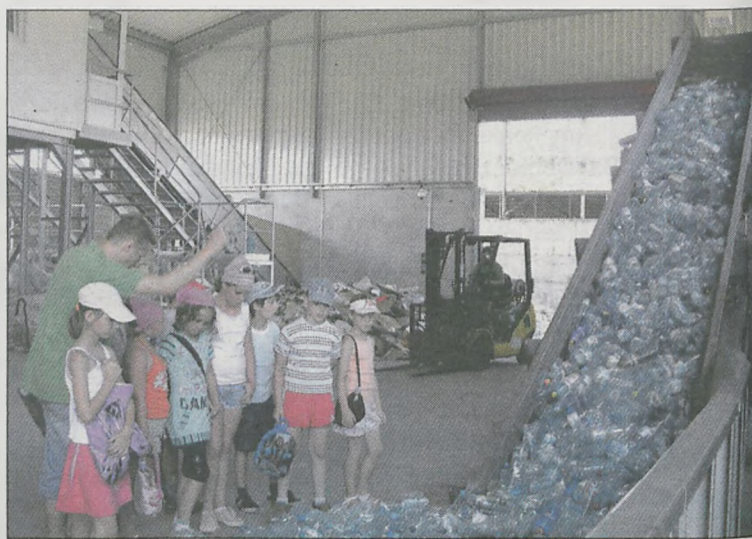
Dzieci odwiedziły m.in. Zakład Gospodarki Odpadami

W TAKICH ZAJĘCIACH WZIELI UDZIAŁ UCZNIOWIE: