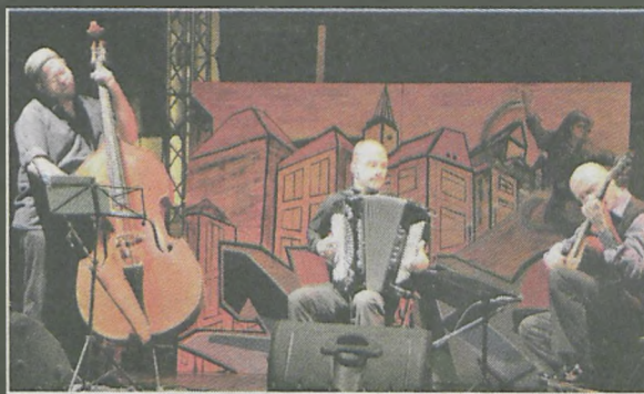
Gitarę można było usłyszeć w różnych zestawieniach instrumentalnych. Na zdjęciu „Trio Fuera” w czasie koncertu „Tango Project - Piazzola, Galliano”