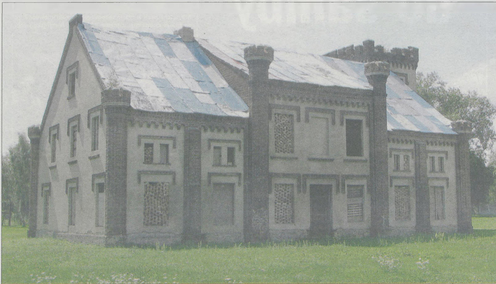
Od 9 lat dwór w Boguszynie znajduje się w prywatnych rękach. Nowy właściciel rozpoczął generalny remont obiektu i uporządkował park

Właściciel dworu w Boguszynie wystawił go na sprzedaż. W przyszłości może stać się hotelem lub centrum odnowy biologicznej. Wybudowany w latach czterdziestych XIX wieku był siedzibą rodu Szczanieckich. Po wojnie mieszkali w nim pracownicy PGR-u.