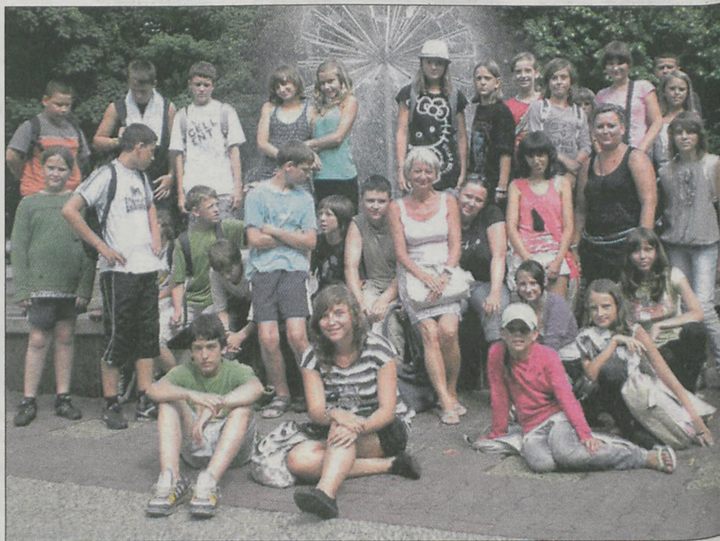
Grupa z Jarocina na tle fontanny w Kołobrzegu