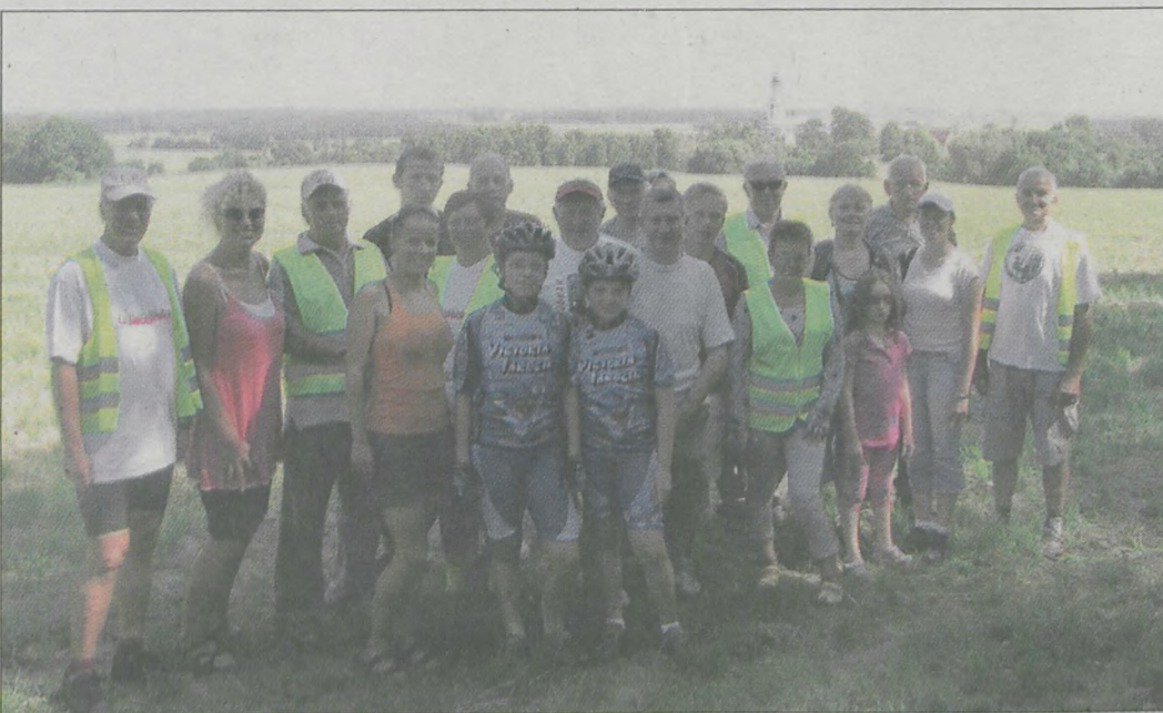
Punkt widokowy przed Śmiełowem