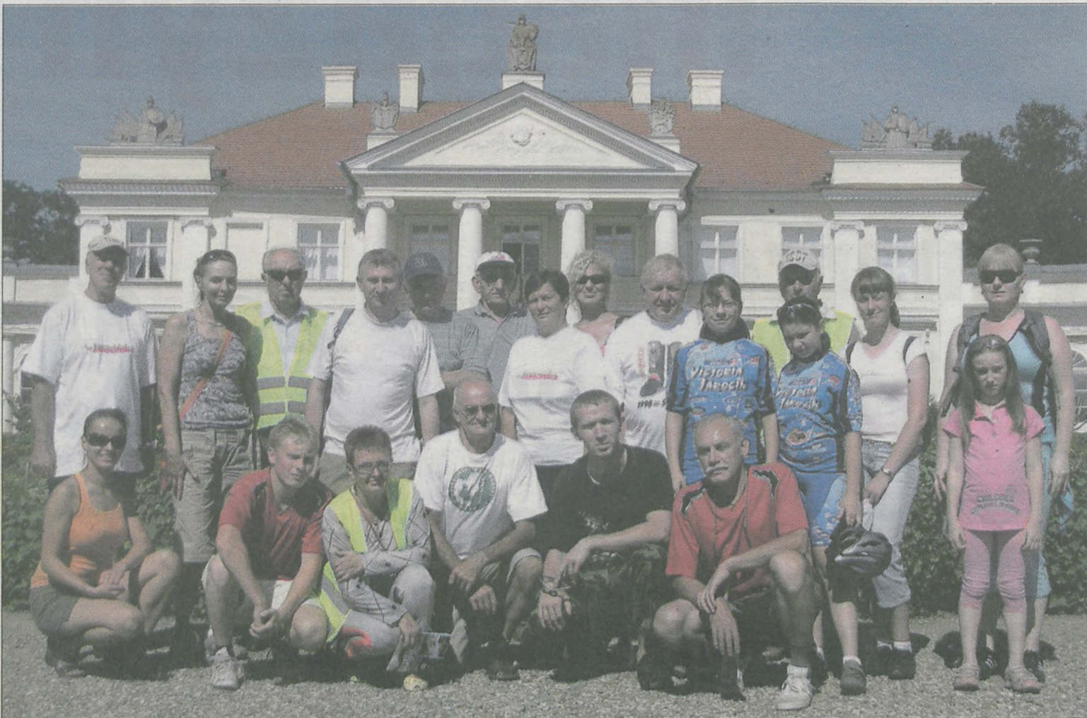
Pamiątkowe zdjęcie przed pałacem w Śmiełowie