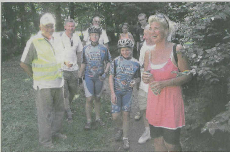
Przed powrotem spacerowaliśmy po śmiełowskim parku