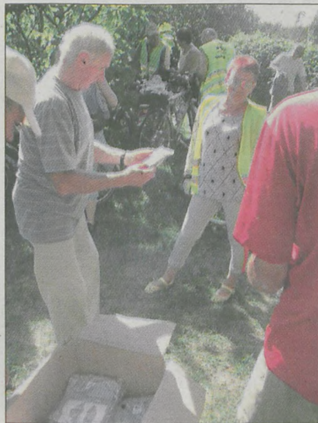
Każdy uczestnik otrzymał okolicznościową koszulkę

Dwa tygodnie temu padający deszcz pokrzyżował nam plany. Tym razem pogoda była już wymarzona i z samego rana w promieniach słońca wyruszyliśmy na wycieczkę rowerową do Szwajcarii Żerkowskiej.