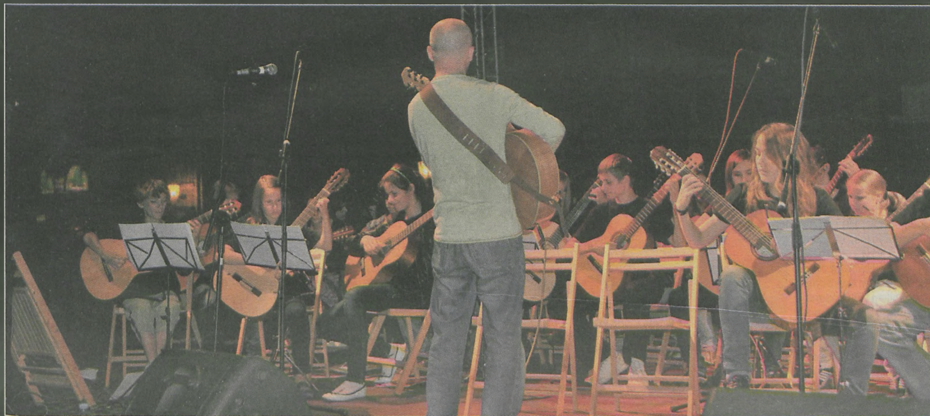
Przed niedzielnym maratonem gitarowym w Poznaniu orkiestra festiwalowa zagrała na rynku. W skład zespołu weszli uczestnicy warsztatów mistrzowskich