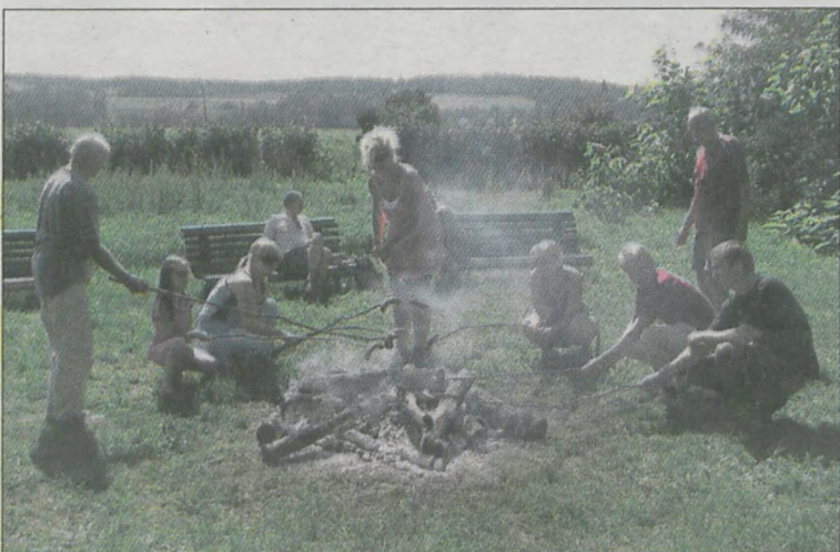
W połowie wyprawy trzeba było się posilić