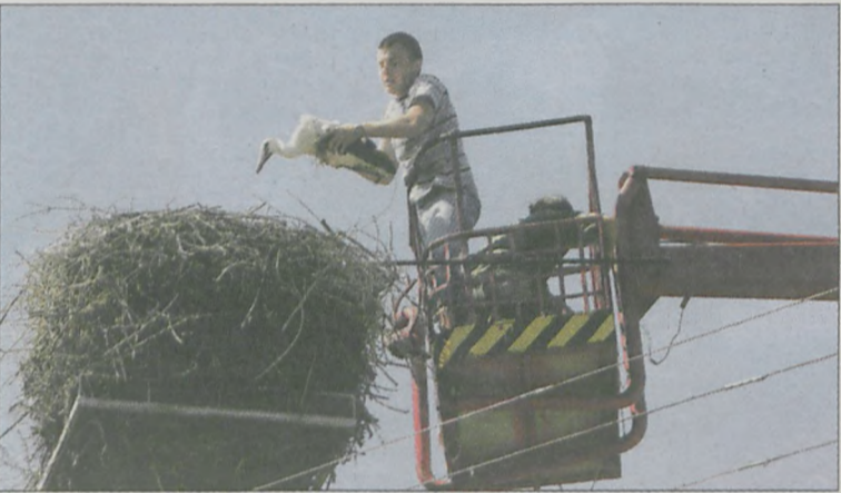
Ornitolodzy sprytnie wyjmują pisklęta z gniazda