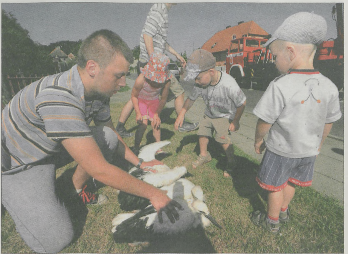
Dzieciaki wykorzystują chwilę, by pogłaskać pisklęta

ADRES REDAKCJI: 63-200 Jarocin, ul. Wolności 1a, tel./fax (62) 747-37-60; 747-15-31, e-mail - redakcja@gj.com.pl, http://www.gj.com.pl