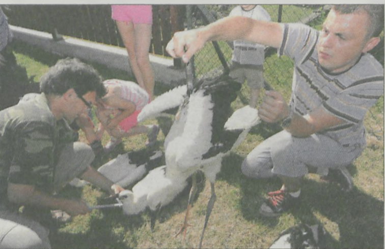
Wszystkie bociany są mierzone suwmiarką i ważone