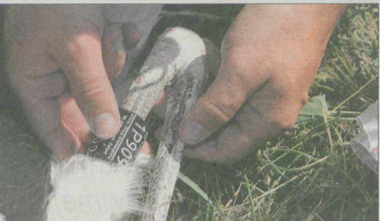
Na koniec otrzymują obrączkę