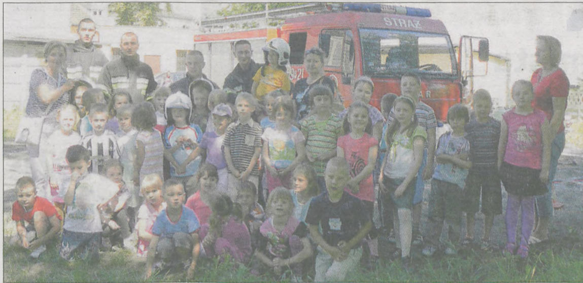
Nie zabrakło wspólnego zdjęcia przedszkolaków ze strażakami

Dyskoteka i pokazy strażackie - to główne atrakcje festynu dla dzieci z Przedszkola nr 2 „Bajeczka” w Jarocinie.