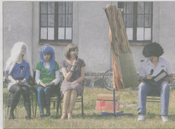
Młodzież zaprezentowała program kabaretowy