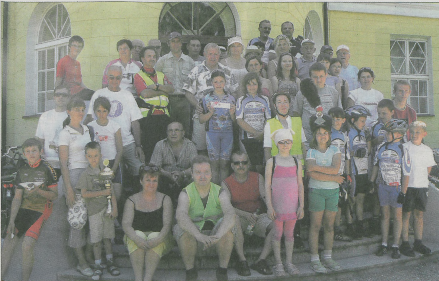
Wspólne zdjęcie miłośników dwóch kółek