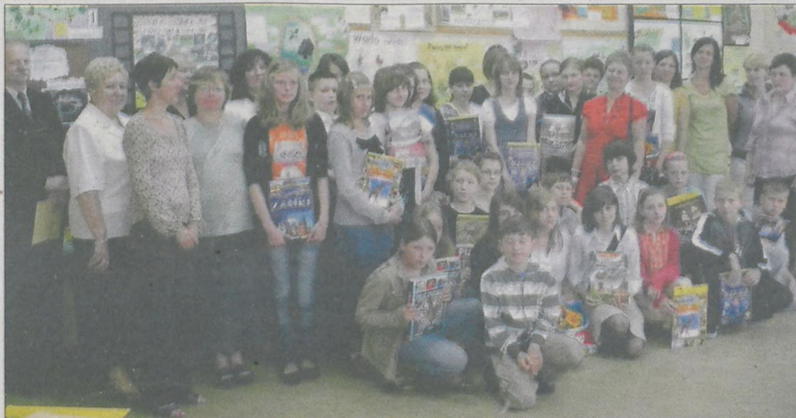
Co roku konkurs przyrodniczy cieszy się dużym zainteresowaniem uczniów z całej gminy. Co roku też na jego uczestników czekają atrakcyjne nagrody