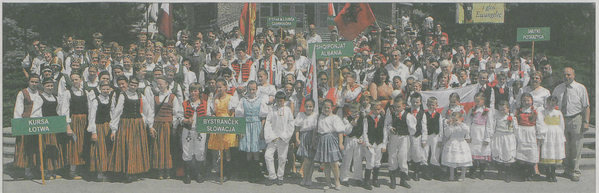
W niedzielę tancerze i kapele uczestniczyli we mszy św. w kościele ojców franciszkanów w Jarocinie