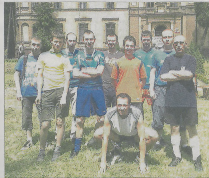
Członkowie jarocińskiego Fan Clubu Lecha wzięli udział w festynie w Górze

Wychowankowie domu dziecka w Górze wygrali 5:4 mecz piłkarski przeciwko kibicom z jarocińskiego Fan Clubu Lecha. Zacięty pojedynek stoczono przed pałacem, w trakcie nieco spóźnionego festynu z okazji Dnia Dziecka. Było ognisko,