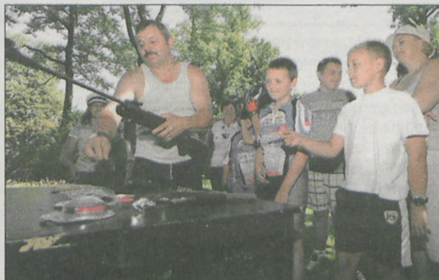
Do strzelania z wiatrówki ustawiła się najdłuższa kolejka