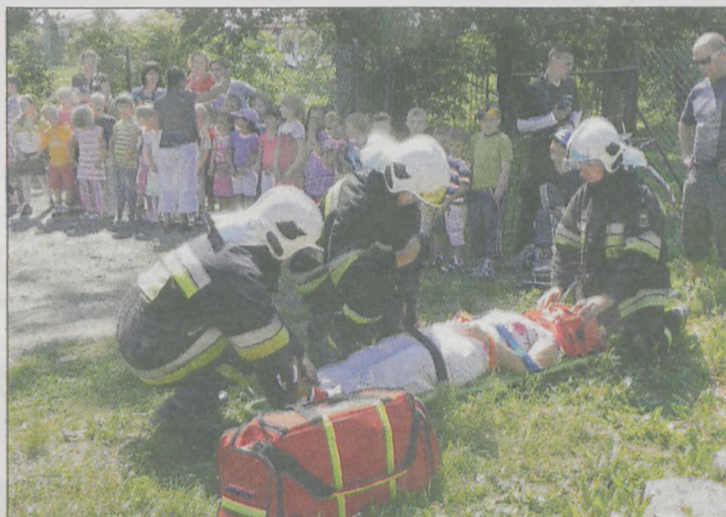
Ratownicy pokazali dzieciom, jak ratuje się uszkodzonego