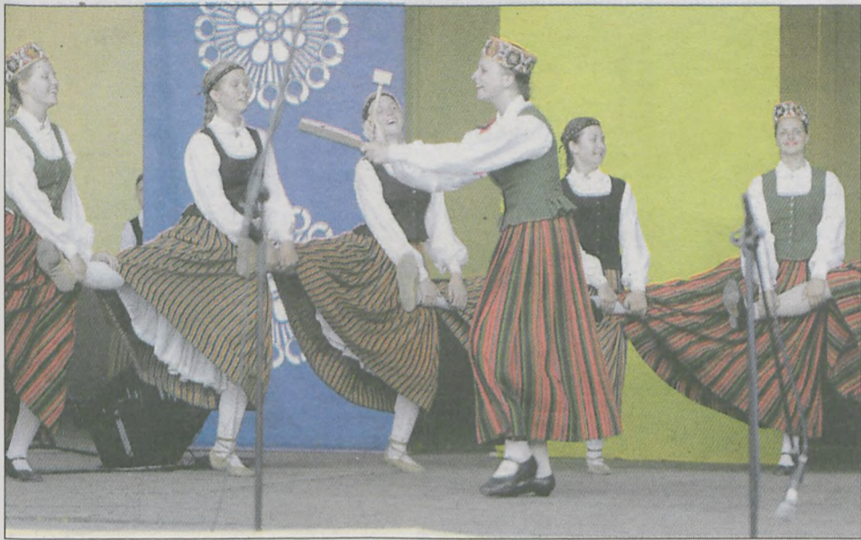
Zespół z Łotwy gościł na jarocińskich spotkaniach folklorystycznych po raz drugi, po sześcioletniej przerwie