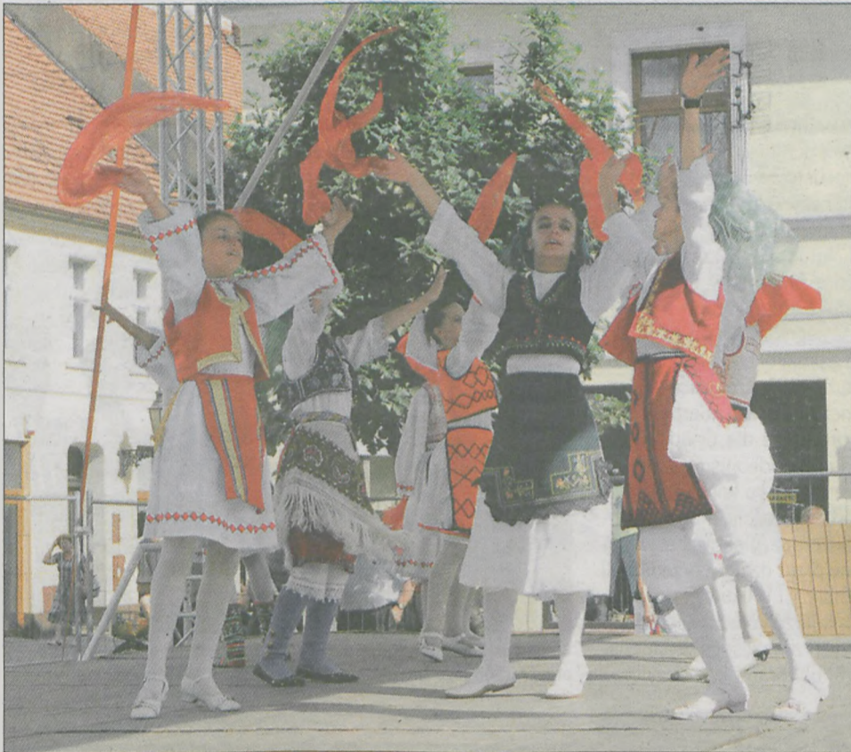
Jak co roku zespoły przeszły w barwnym korowodzie do jarocińskiego amfiteatru. Na rynku każda z grup prezentowała próbkę swojego repertuaru. Na zdjęciu Zespół Folklorystyczny „Shqiponjat” z Tirany (Albania)

Jak co roku na początku lipca Jarocin i Potarzysty stały się miejscami, w których rozbrzmiewało wiele języków i muzyka ludowa z różnych krajów Europy. Mimo początkowych planów na XIII Międzynarodowe Spotkania Folklorystyczne nie dojechali artyści z Rumunii.