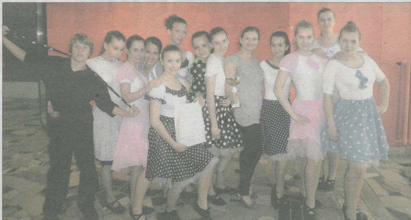
„Siła Tańca” okazała się najlepsza spośród 16 ekip