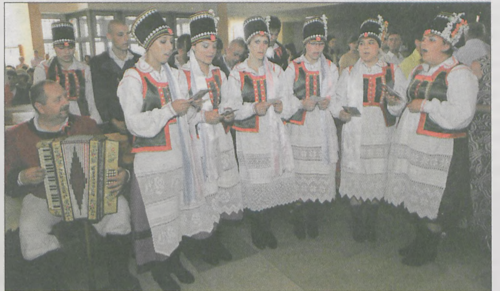
W tym roku wśród 13 zespołów było aż dziewięć z Polski, a wśród nich siedem z Wielkopolski. Pozostałe reprezentowały region Kurpii (na zdjęciu „Puszcza Zielona” z Łysego) oraz Ziemi Sieradzkiej - Zespół Pieśni i Tańca „Bałdrzychów” z Bałdrzychowa