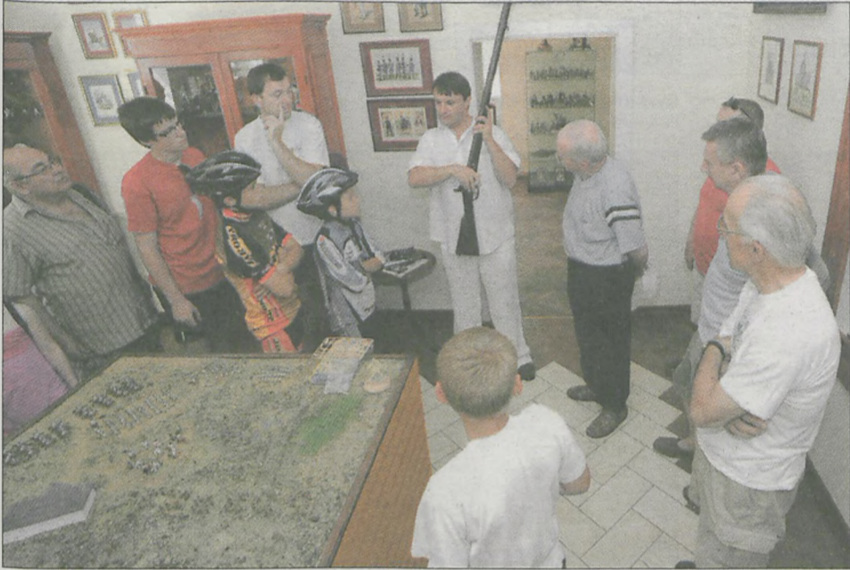
Zwiedziliśmy Muzeum Wojen Napoleońskich

Oprócz jazdy na rowerze, przebieraliśmy się w stroje z epoki napoleońskiej, strzelaliśmy z łuku i wiatrówki - to wszystko działo się na rajdzie rowerowym. W sobotę z „Gazetą” i członkami PTTK-u pojechało 50 miłośników dwóch kółek.