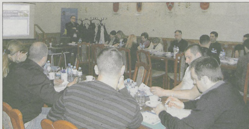
(ann) W szkoleniu wzięło udział ponad 20 przedsiębiorców

we zasady konkursów i możliwości pozyskania dofinansowań ze środków unijnych w ramach Działania 1.1 Wielkopolskiego Regionalnego Programu Operacyjnego. Przedsiębiorcy dowiedzieli się między innymi, w jaki sposób wypełniać wnioski oraz jakie są kryteria ich oceny. Każdy uczestnik szkolenia otrzymał materiały informacyjne. Do dyspozycji przedsiębiorców byli pracownicy jarocińskiego Punktu Informacyjnego Funduszy Europejskich.