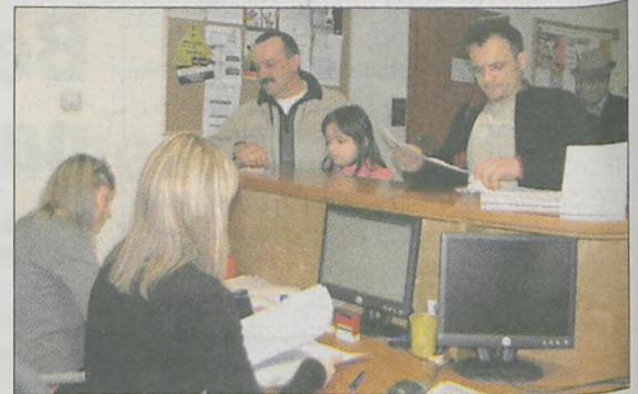
W piątek rano w Biurze Powiatowym Agencji Restrukturyzacji i Modernizacji Rolnictwa nie było kolejki