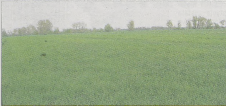
Po odpowiednich zabiegach agrotechnicznych dłużej niż trzy lata ten sam gatunek zboża można uprawiać na tej samej działce

Trzy lata temu postanowiono, że na gruntach ornych na tej samej działce ewidencyjnej dłużej niż 3 lata nie można uprawiać pszenicy, żyta, jęczmienia i owsa. Przepisy miały zostać zastosowane po raz pierwszy w 2011 r. Wprowadzono w nich jednak zmiany, które zezwalają na dłuższą niż trzyletnią uprawę tych samych zbóż. Aby skorzystać z nowelizacji, trzeba spełnić pewne warunki. Rolnik będzie musiał wykazać, że ten sam gatunek zboża nie ma degradującego wpły-