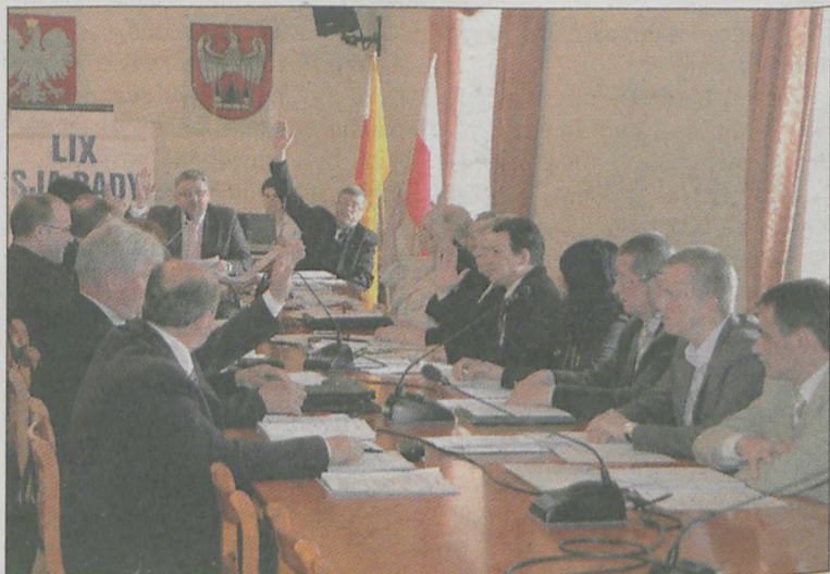
Na dwiętnastu obecnych na sesji radnych, dwunastu było za udzieleniem absolutorium