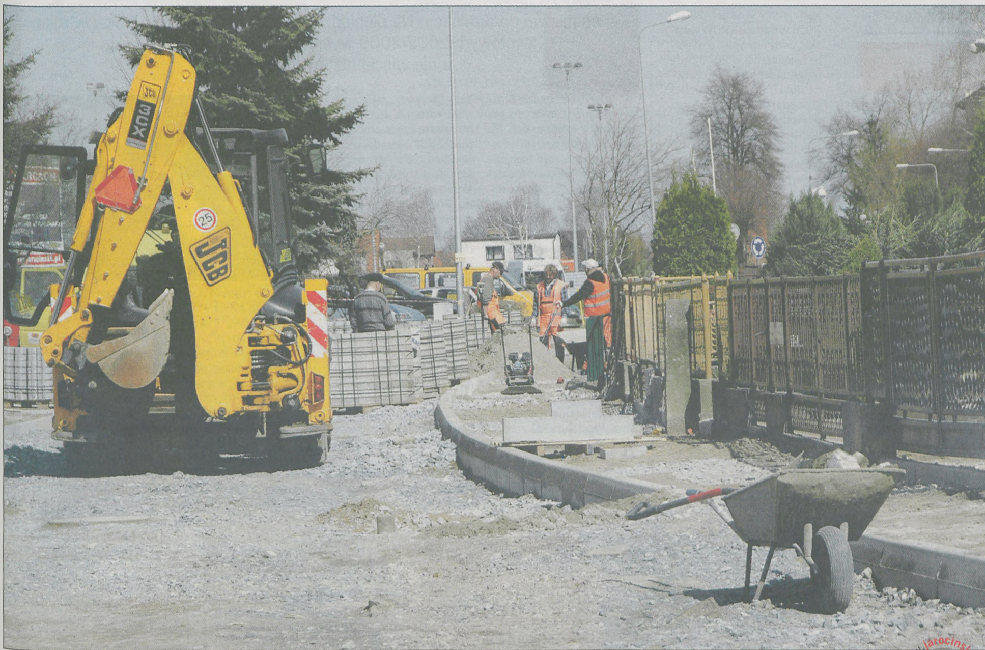
Budowa ul. Waryńskiego na osiedlu 1000-lecia w Jarocinie

Takim sposobem, jak na osiedlu 1000-lecia, gmina Jarocin zamierza budować kolejne drogi.