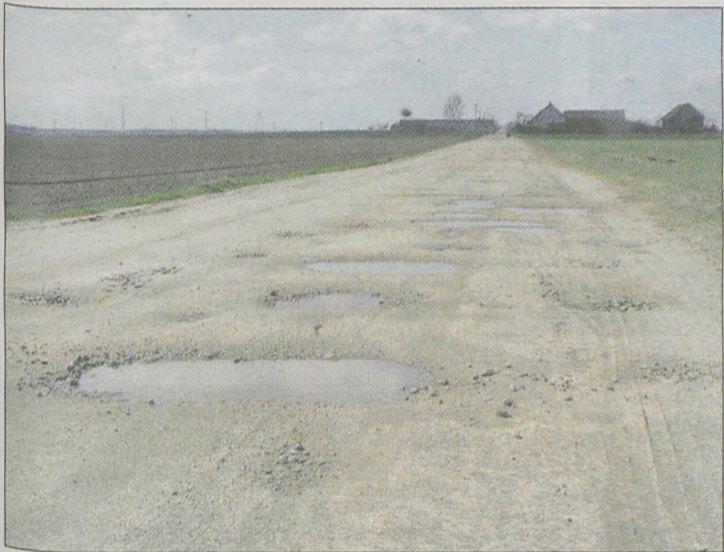
Pełna dziur jest droga Panienka - Mec