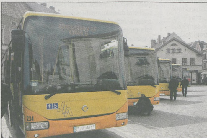
We wtorek na rynku zaprezentowano pięć nowych autobusów kupionych przez Jarocińskie Linie autobusowe

ponad 3 mln zł, z czego 2,4 mln zł pochodziło z Unii Europejskiej. Resztę pieniędzy wyłożyły Jarocińskie Linie Autobusowe. Spółka ma obecnie 22 nowe pojazdy.