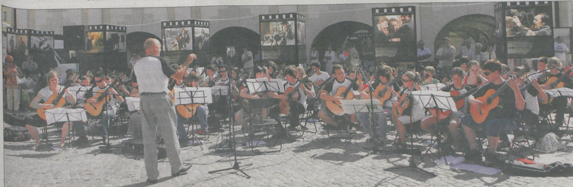
Podczas Happeningu Gitarowego swoje umiejętności pokazali uczniowie Kursu Mistrzowskiego, którzy przybyli do Jarocina z całej Europy