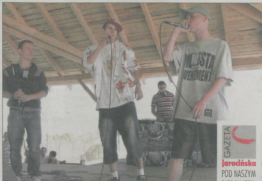
Razem z artystami na Street Levels było 400 osób