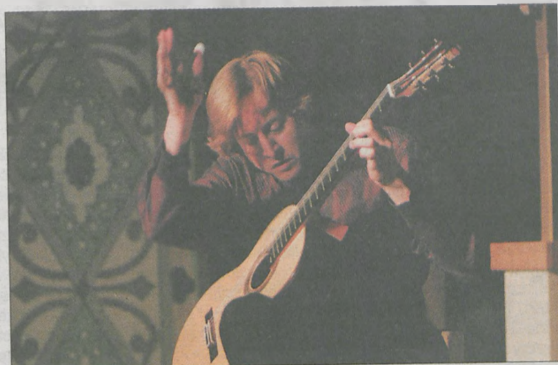
Koncert Jasona Vieaux, jednego z czołowych amerykańskich gitarzystów, zainauguował festiwal w Jarocinie