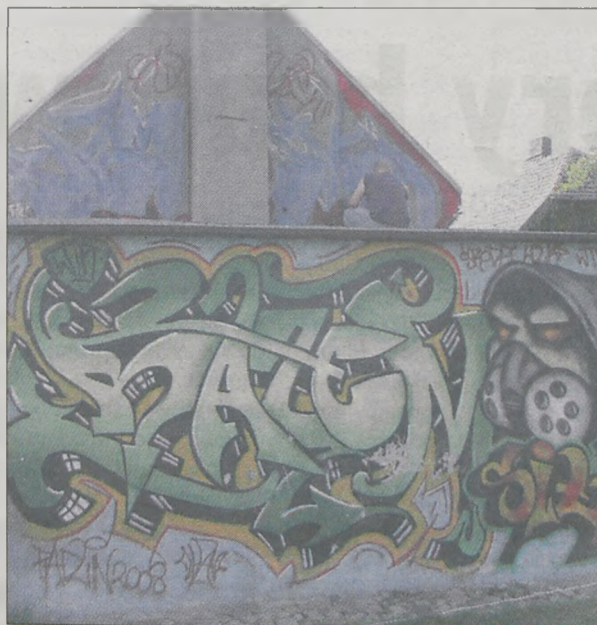
W tym roku graffiti ozdobiło cały budynek ośrodka rekreacji „Tęcza”