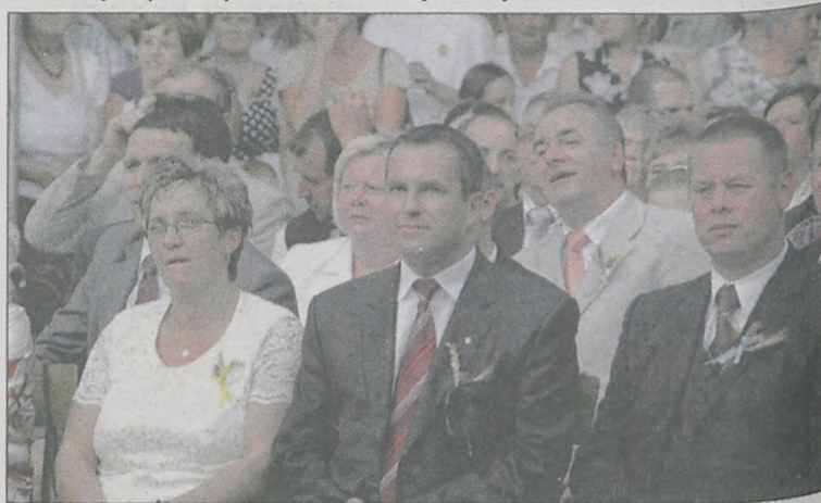
Goście i zgromadzeni mieszkańcy z zaciekawieniem przyglądali się występom