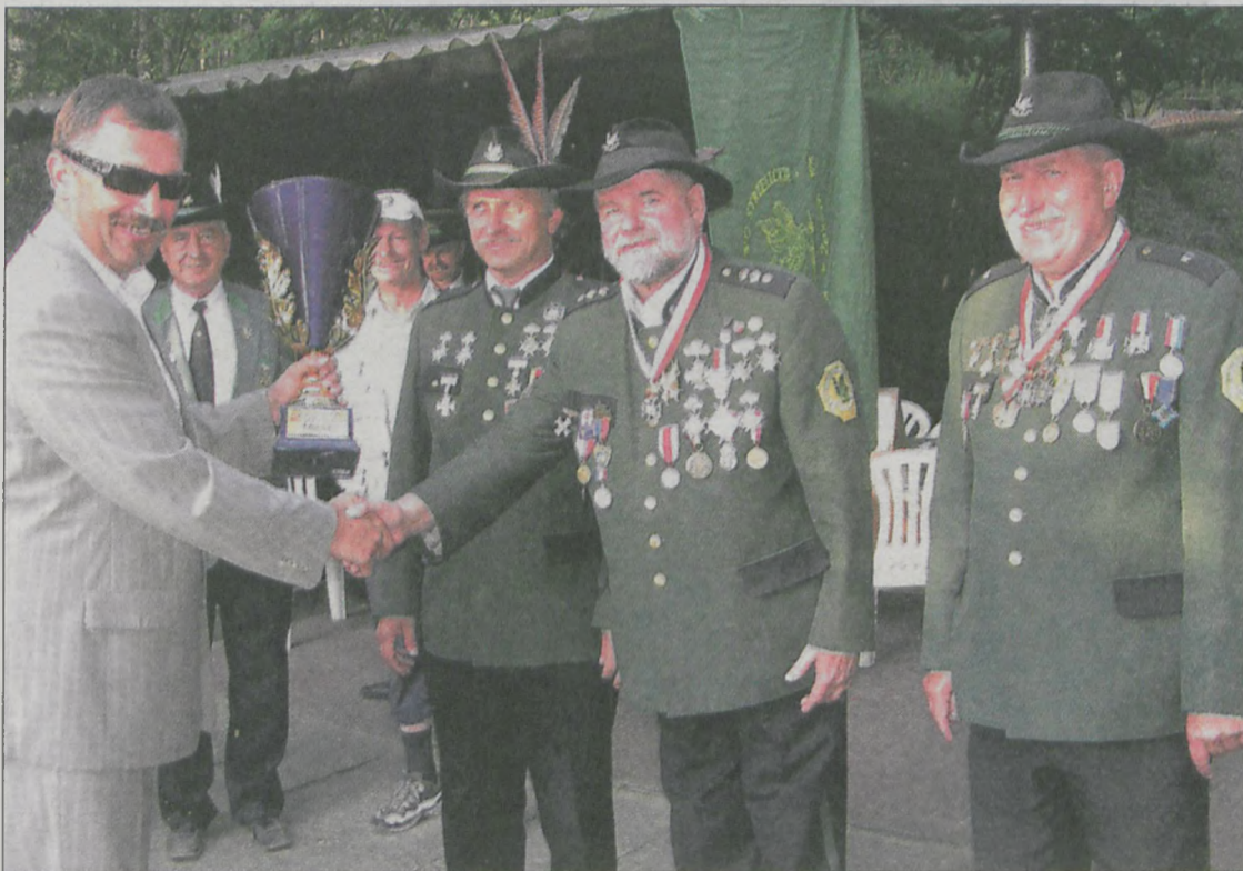
Puchar dla najlepszej drużyny turnieju z rąk starosty jarocińskiego odebrała reprezentacja KBS Jarocin