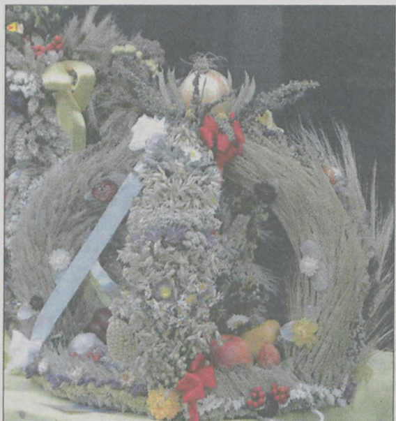
Wieńec uznany za najlepszy przez komisję konkursową