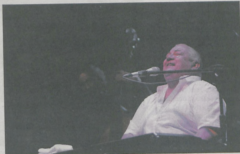
Charyzmatyczny Stanisław Soyka podbił serca publiczności śpiewając swoje największe przeboje