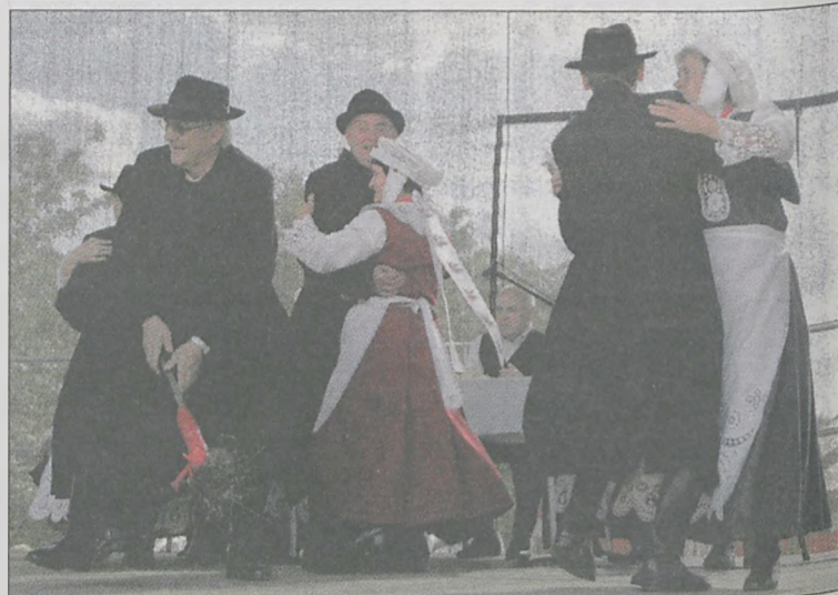
„Goliniacy” wprawili publiczność w dobry nastrój