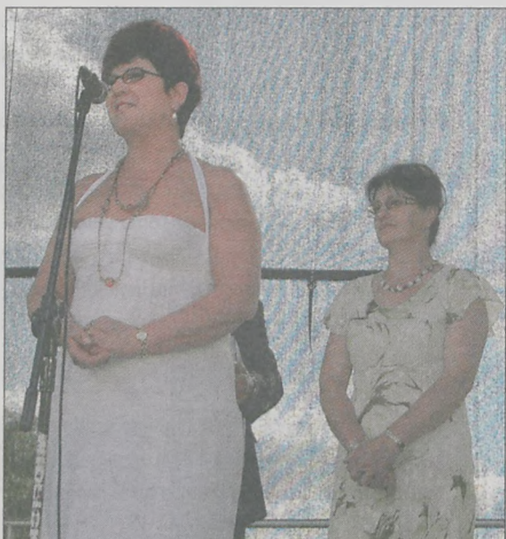
Przedstawiciele sołectwa Siedlemin - tegoroczni zwycięzcy konkursu wieńców