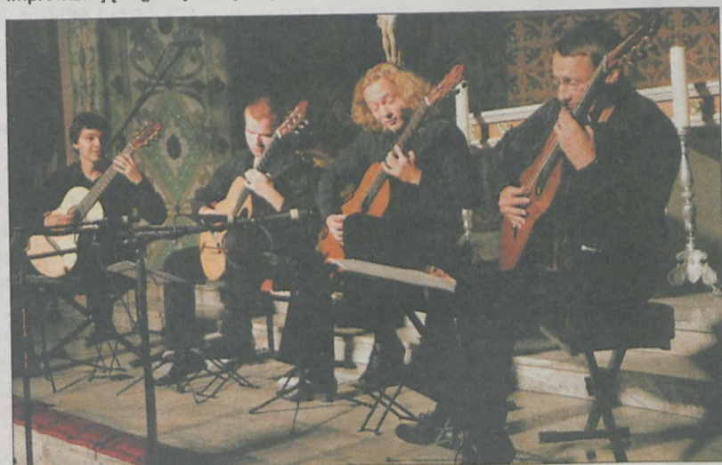
Poznań Guitar Quartet. Młodzi muzycy zaprezentowali m.in. fragmenty opery Carmen