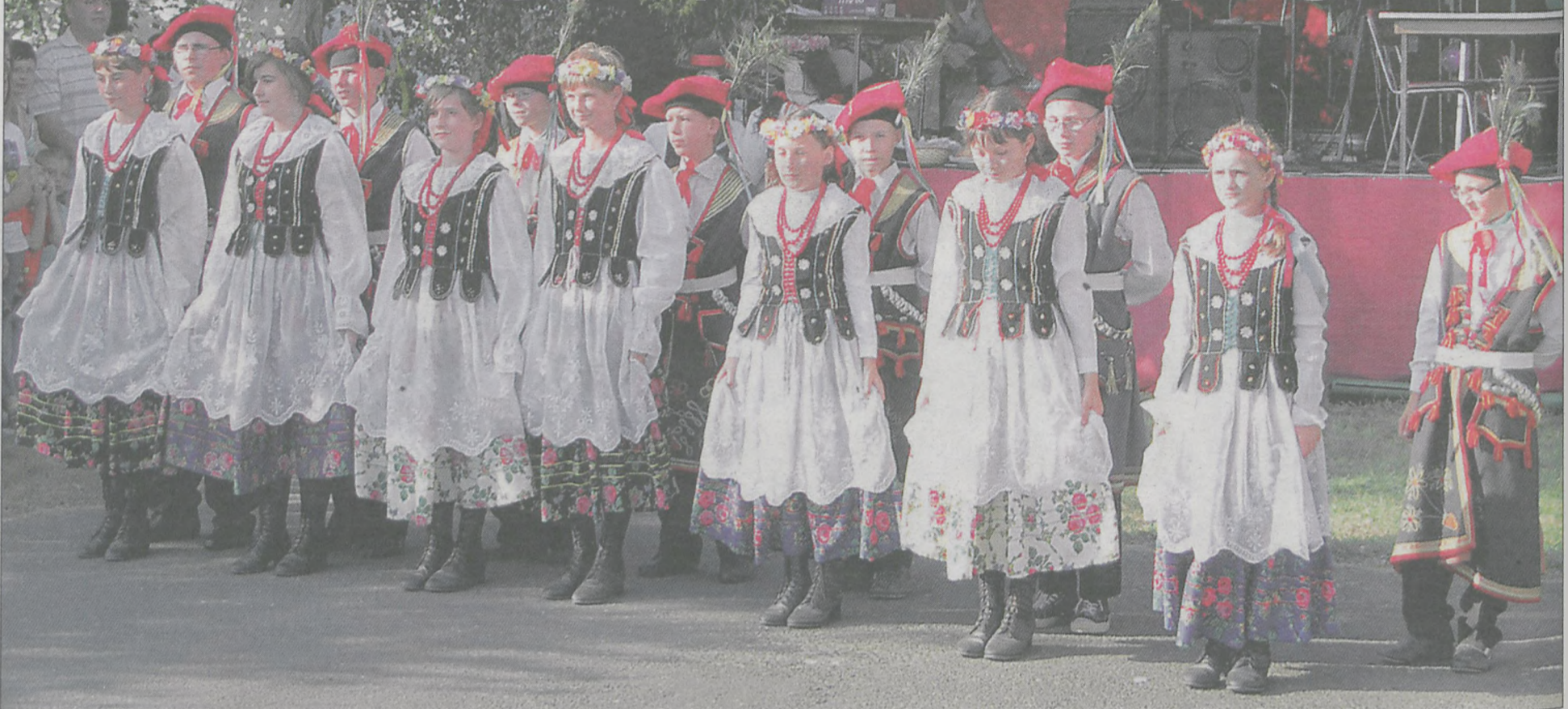
Po raz kolejny dożynki wzbogacił występ zespołu „Sławoszewiaczy”

165 chlebów rozwiózł przed dożynkami po Sławoszewie i Parzewie zespół „Sławoszewiaczy”.