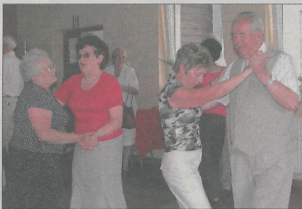
W Centrum Socjalnym w Jarocinie znów organizowane są czwartkowe potańcówki

taneczne. Imprezie zwykle towarzyszy muzyka grana na żywo. We wtorki w Klubie Seniora przeprowadzane są pogadanki, prelekcje, zajęcia muzyczne i rozgrywki sportowe. W tym roku na prośbę uczestników zarząd klubu skrócił wakacje, z dwóch do jednego miesiąca i dlatego imprezy organizowane są już od sierpnia.