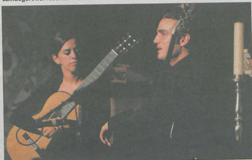
Duo Melis, hiszpańsko-grecki duet gitarowy