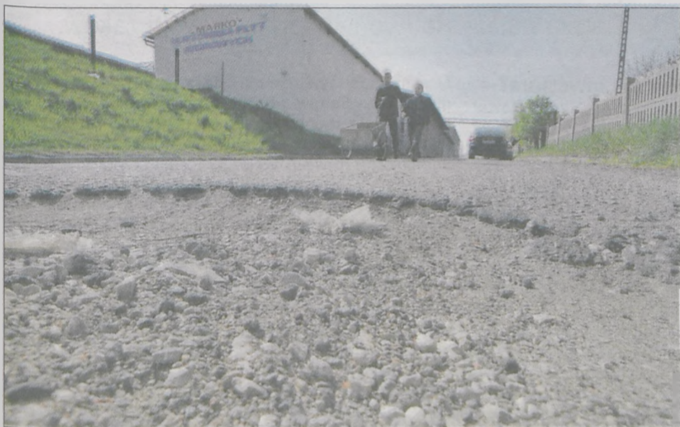
„Japy” na ul. Ceglanej w Jarocinie, o których pisze nasz Czytelnik, jeszcze długo mogą straszyć kierowców, bo póki co nikt się do drogi nie przynajnie

nych”. Tymczasem oświadczenia i informacje udostępnione przez poszczególne zarządy dróg zaprzeczają temu. Jako przykład urzędnicy podają działkę nr 424 przy ul. Ceglanej, która według jednego oświadczenia jest fragmentem drogi gminnej, a już według innego dokumentu częścią tej samej ulicy (Sienkiewicza), ale posiadającą charakter drogi powiatowej. Według urzędu wojewódzkiego brak decyzji uwłaszczeniowej ma znikomy wpływ na możliwość pełnego gospodarowania nieruchomością, a co za tym idzie jej utrzymywanie, czyli np. remonty, których domagają się użytkownicy ul. Ceglanej. „Do momentu ewentualnego wydania decyzji odmawiającej potwierdzenia nabycia prawa użytkowania wieczystego, nieruchomości znajduje się w formalnym zarządzie PKP S.A. - pisze dalej Czuchra. „Jednocześnie oczywistym jest, iż podmiot, którego uprawnienia nie zostaną potwierdzone deklaratoryjną decyzją uwłaszczeniową, niezbyt chętnie będzie „poczuwał się” do realizowania faktycznego władztwa nad nieruchomością.” (nba)