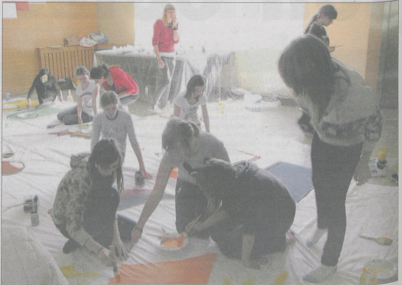
Ekologiczna makieta z okazji Dnia Ziemi powstawała podczas „Drzwi otwartych”

Zainteresowanie rodziców przekroczyło oczekiwania organizatorów „Drzwi otwartych” w Zespole Szkół nr 5 w Jarocinie.