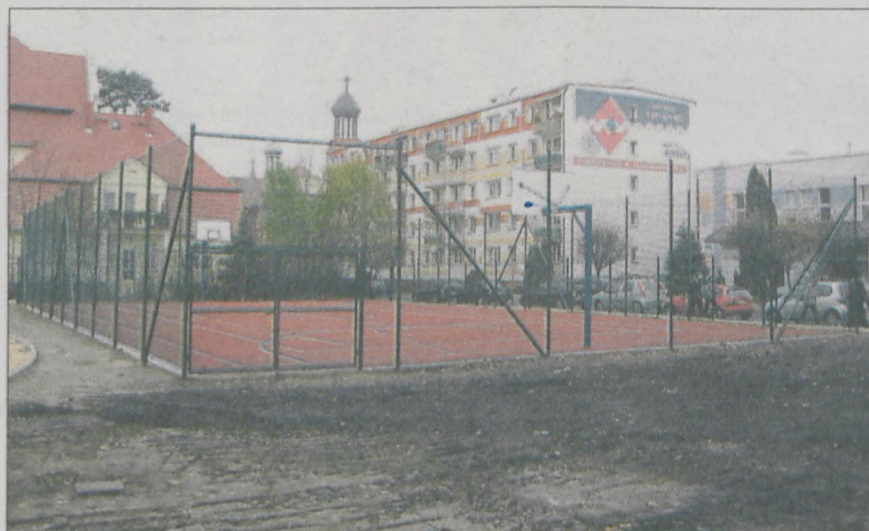
Budowa nowoczesnych boisk sportowych przy jarocińskim ogólniaku rozpoczęła się w ubiegłym roku

W poprzedni poniedziałek, Sejmik Województwa Wielkopolskiego podjął uchwałę o dofinansowaniu przedsięwzięcia kwotą 60 tys. zł. Tego samego dnia Rada Miejska w Jarocinie również podjęła decyzję o przekazaniu na ten cel 350 tys. zł. Dodatkowe 50 tys. zł pochodzić będzie z Powiatowego Funduszu Ochrony Środowiska i Gospodarki