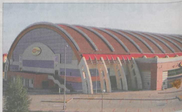
Firma Novum wybudowała m.in. halę Winiary Arena w Kaliszu, która jest obiektem o konstrukcji łukowej

że szkoła mieści się na terenie wielkiego osiedla, a więc myślę, że sala będzie wykorzystywana nie tylko na lekcje wychowania fizycznego, ale również na zajęcia dodatkowe dla młodzieży popołudniami - dodaje. Obecnie zdarza się, że dzieci muszą ćwiczyć na korytarzu, bo istniejąca