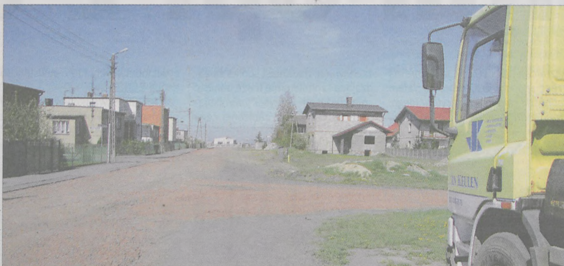
MIESZKAŃCÓW GOLINY DZIWI, dlaczego tylko na jednej bocznej ulicy - Klonowej została utwardzona nawierzchnia

- Nic nie wiem. Nie wiem. Ale to rzeczywiście bardzo śmieszne - przyznał pracownik z Zakładu Ulic,