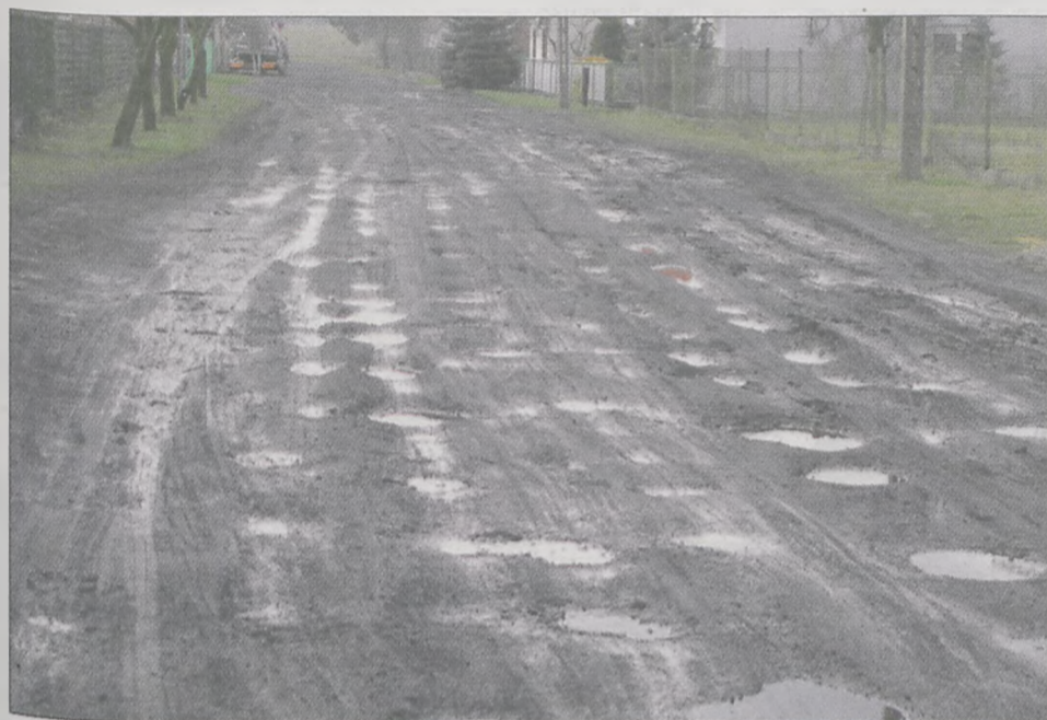
Tak ul. Marcina wyglądała pod koniec marca