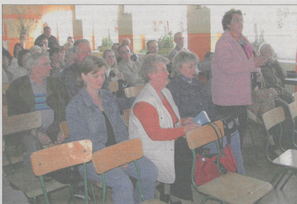
Burzliwy przebieg miało zebranie w Witaszycach w sprawie budowy ulic