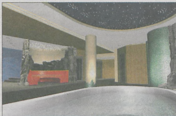
Tak, według projektu, ma wyglądać park wodny