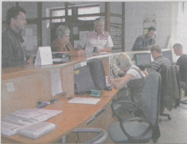
Na razie w biurze ARiMR w Jarocinie nie ma kolejek

czyli do 9 czerwca 2009 r., jednakże za każdy dzień roboczy opóźnienia należna rolnikowi płatność będzie pomniejszana o 1 %.