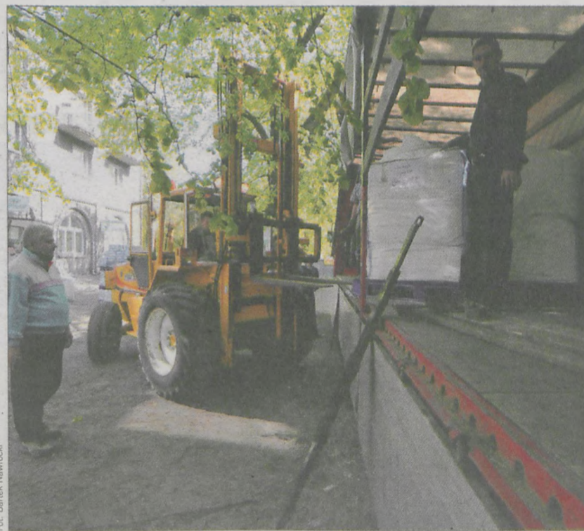
Przywiezione dary rozładowano w piątek przed siedzibą jarocińskiego oddziału Polskiego Czerwonego Krzyża