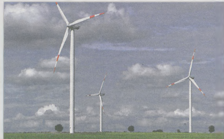
OPRÓCZ JAROCINA I KOTLINA firmy zainteresowane budowaniem wiatraków pojawiły w gminie Jaraczewo

życie biologiczne. Niektórzy rolnicy zgadzają się na to, żeby za stodołę je postawić. Kara za wycofanie się rolnika z umowy 100 tys. euro to