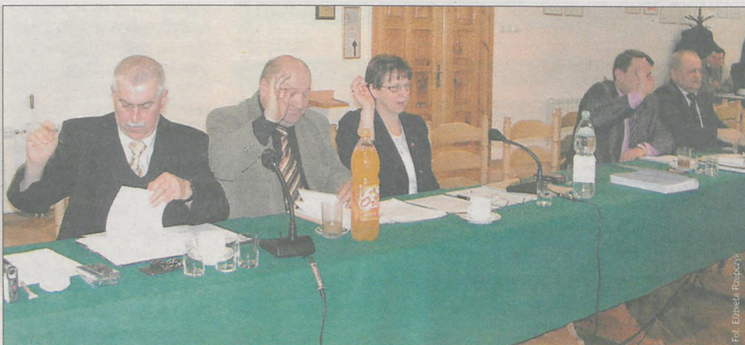
Wszyscy radni zagłosowali za wyższymi cenami wody i ścieków

dopłaci w tym roku do ścieków gmina Jaraczewo