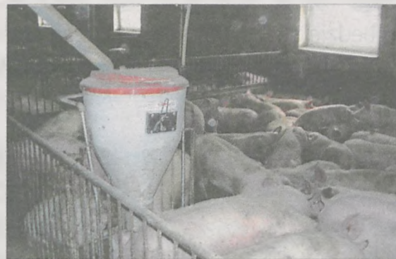
AGENCJA dofinansowuje w 75 procentach utylizację padłych świń

Pomoc finansowa agencji realizowana na podstawie umów zawartych na 2009 r. dotyczy również usług zrealizowanych