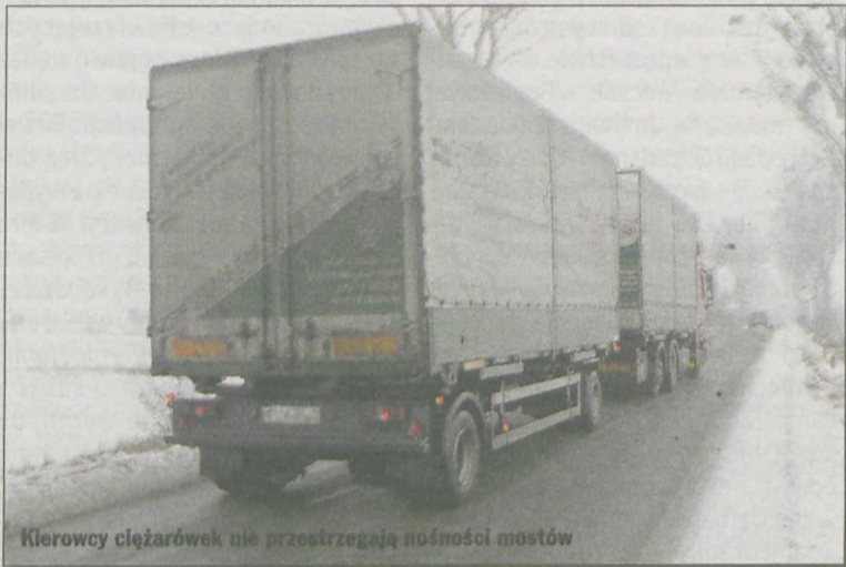
Kierowcy ciężarówek nie przestrzegają nośności mostów

Czasy furmanek pamięta większość mostów w powiecie jarocińskim. Ich ograniczona nośność utrudnia prowadzenie działalności gospodarczej przedsiębiorcom. Tirowcy zanim wyjadą w trasę przez CB-radio sprawdzają, czy czatuje na nich policja. Kierowcy aut osobowych i rowerzyści narzekają na stróżów prawa, że nie reagują na notoryczne łamanie prawa.