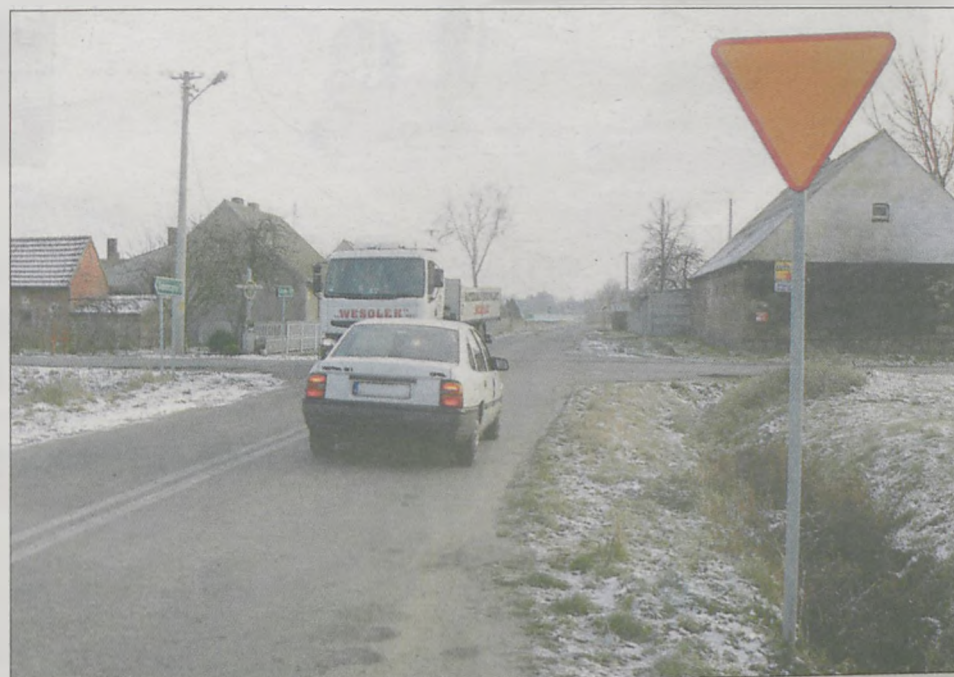
NA FERALNYM SKRZYŻOWANIU W SUCHEJ Zarząd Dróg Powiatowych w Jarocinie proponuje wykonanie poziomego oznakowania wypukłego

2008 - 1 wypadek, 4 kolizje, 2 rannych, 2 osoby zginęły 2007 - 3 kolizje 2006 - 2 wypadki, 2 kolizje, 1 ranny, 1 osoba zginęła 2005 - 3 wypadki, 3 kolizje, 4 rannych