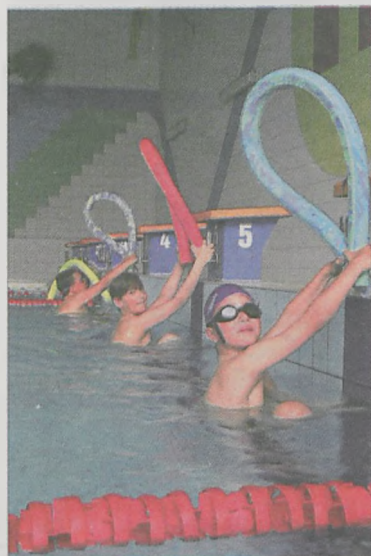
275 tys. 790 zł - granty na sport

Najwięcej z niespełna 280 tys. zł rozdysponowanych w kulturze trafi do jarocińskiego Towarzystwa Muzycznego - 54 tys. zł. Za te pieniądze stowarzyszenie zamierza zorganizować VI edycję festiwalu muzyki organowej i kameralnej, zajęcia gry na instrumentach muzycznych dla dzieci i młodzieży oraz Międzynarodowy Dzień Muzyki. Prawie 41 tys. zł otrzyma Stowarzyszenie Miłośników Kultury Ludowej w Potarzysty, a 35 tys. Stowarzyszenie Jarocin XXI.