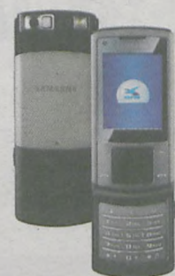
SAMSUNG U900 SOUL