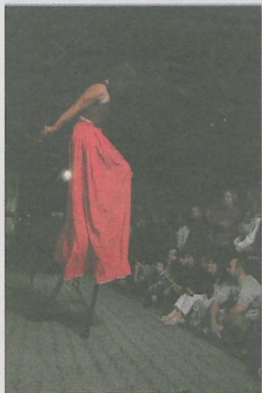
279 tys. 340 zł - granty na kulturę

Pomiędzy 42 organizacje pozarządowe z gminy Jarocin podzielono ponad pół miliona złotych.