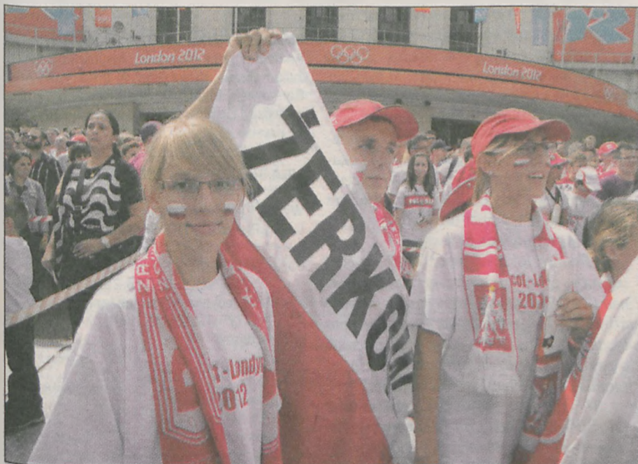
Igrzyska olimpijskie w Londynie na żywo miała także okazję obejrzeć grupa lekkoatletów i trenerów UKS Przelaj Żerków