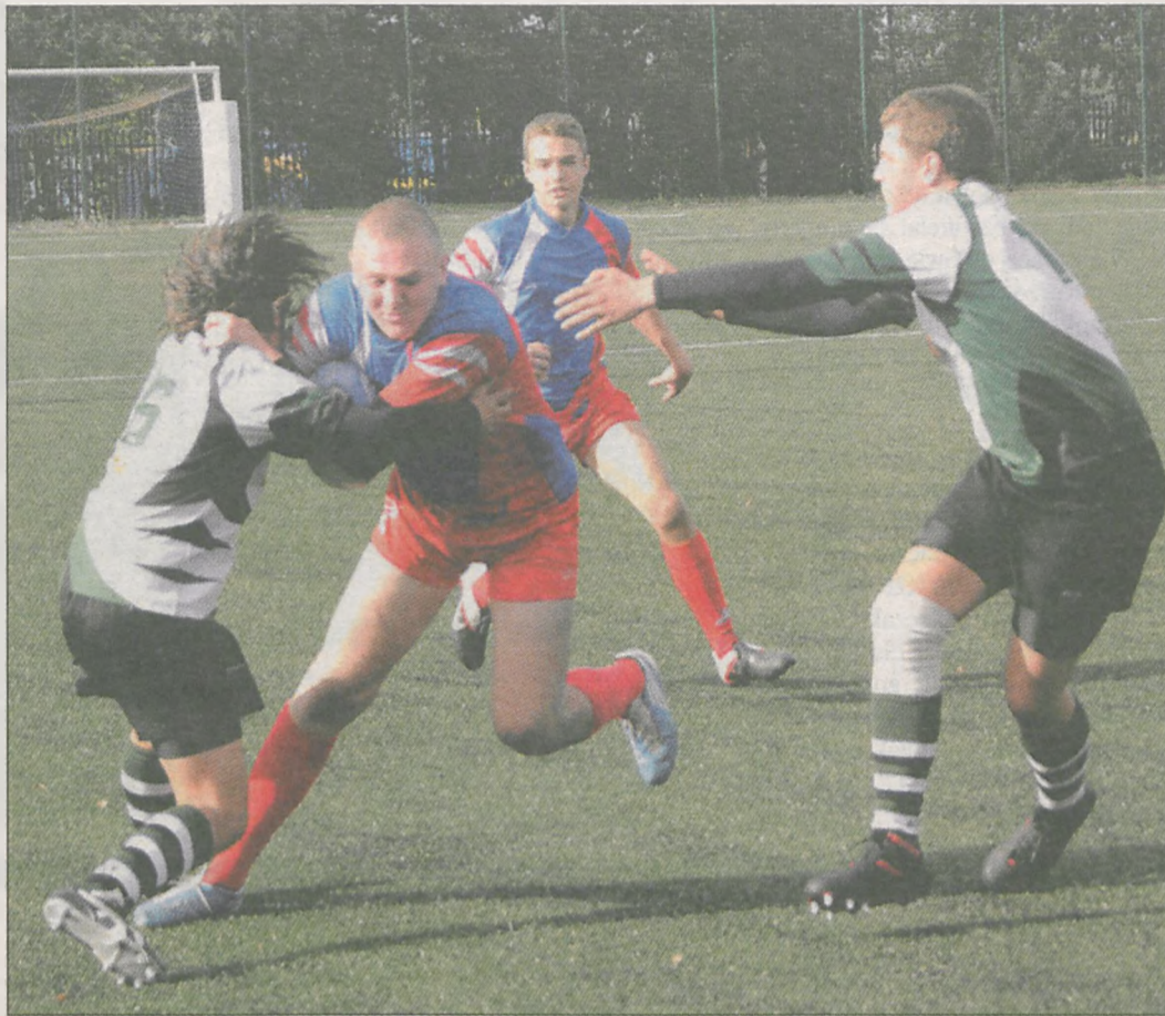
Kadeci Sparty Jarocin zdecydowanie przegrali z aktualnymi mistrzami Polski - Budowlanymi Łódź w meczu eliminacyjnym do Ogólnopolskiej Olimpiady Młodzieży (faf)

W najbliższą sobotę, 6 października (godz. 15.00) na stadionie spółki Jarocin Sport ponownie naprzeciwko siebie staną drużyny Sparty Jarocin i Budowlanych Łódź, które zmierzą się w ramach eliminacji do Mistrzostw Polski Juniorów.