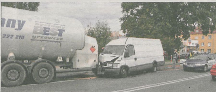
Kolizja spowodowała duże utrudnienia w ruchu