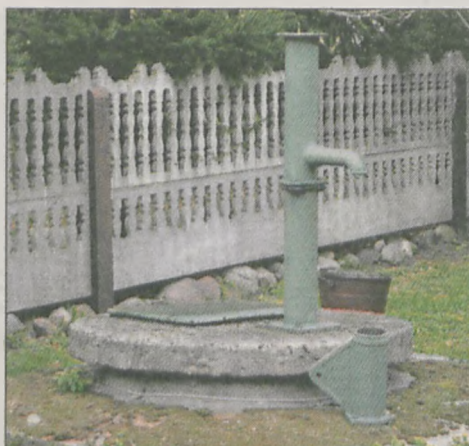
W ubiegły wtorek 60-letnia mieszkanka Lubini Małej wpadła do tej studni