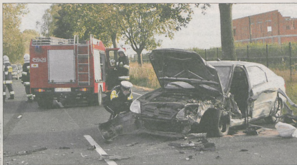
Kobieta jadąca tym citroenem nie doznała obrażeń ciała