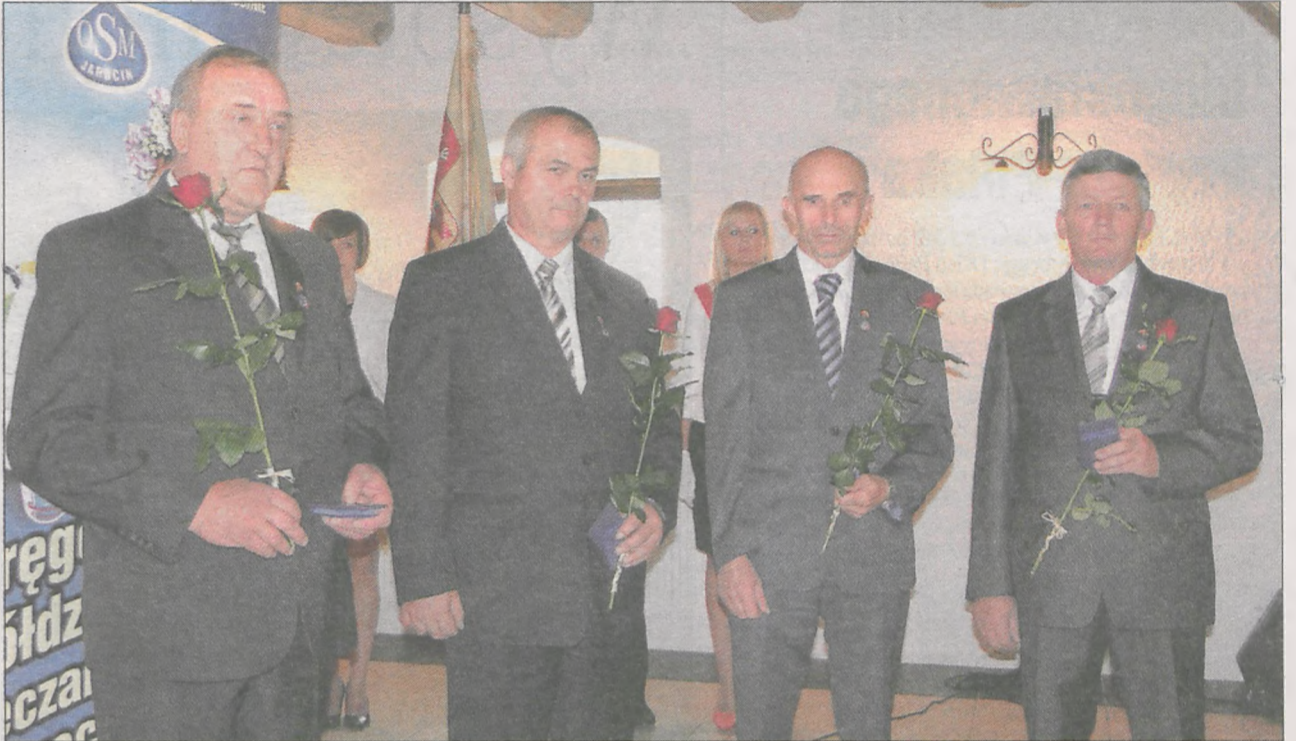
Z okazji jubileuszu mleczarni przyznano kilkanaście odznaczeń. Na zdjęciu osoby zasłużone dla ruchu spółdzielczego

Po części oficjalnej w namiocie obok pałacu w Witaszycach przygotowano poczęstunek oraz część artystyczną, w której wystąpili Chór Mieszany im. K.T. Barwickiego z Jarocina, Zespoły Akordeonowe „Kotlin” oraz orkiestra Mickiewiczowskiego Centrum Turystycznego w Żerkowie.