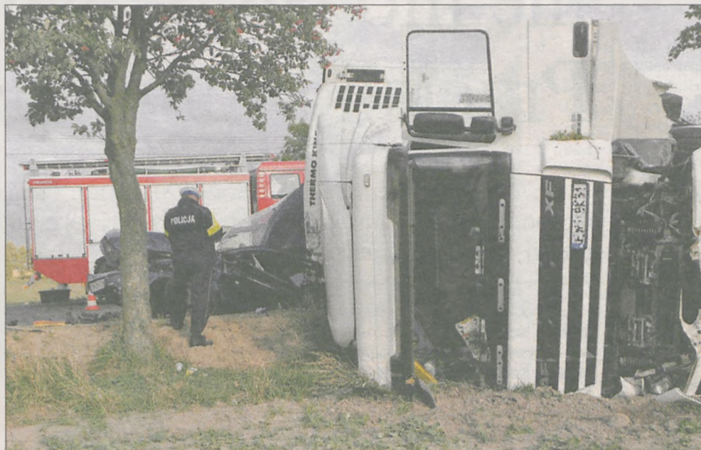
Ciężarowy daf zmiążdżył forda mondeo