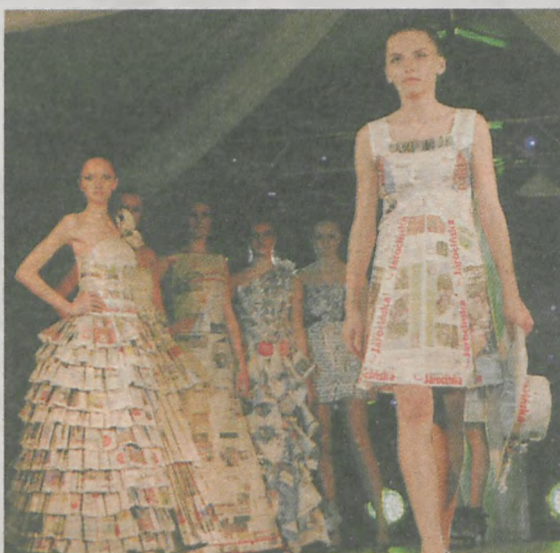
Sukienki, które przygotowano z „Gazety Jarocińskiej” w 2010 roku

Z surowców wtórnych można zrobić rzeźbę, instalację, zabawkę lub mebel. W tym konkursie mogą wziąć udział tylko uczniowie gimnazjów. Przedmioty mogą wykonać osoby indywidualne, ale też drużyny lub całe klasy. Pula nagród to 1000 zł (główna 500 zł i dwie nagrody po 250 zł).