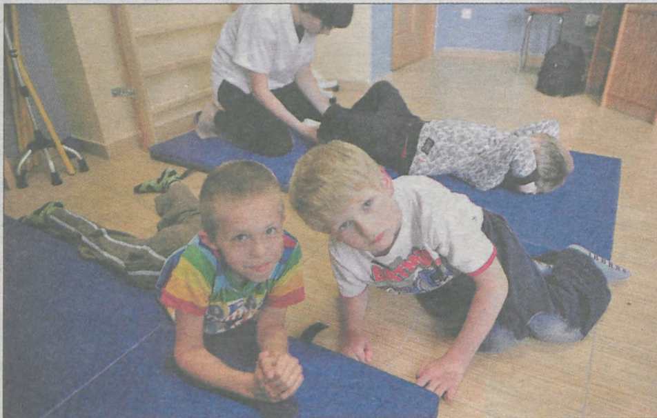
Podopieczni Fundacji „Ogród Marzeń” potrzebują stałej i systematycznej rehabilitacji

Dwa dni później, w niedzielę, w tym samym miejscu wystąpi zespół DAAB, a przed nim ZA ZU ZI w nowej odsłonie. To nie jedyne atrakcje, jakie przygotowano na IX Święto Spółdzielczości. Podczas festynu wolontariusze również będą zbierać pieniądze.