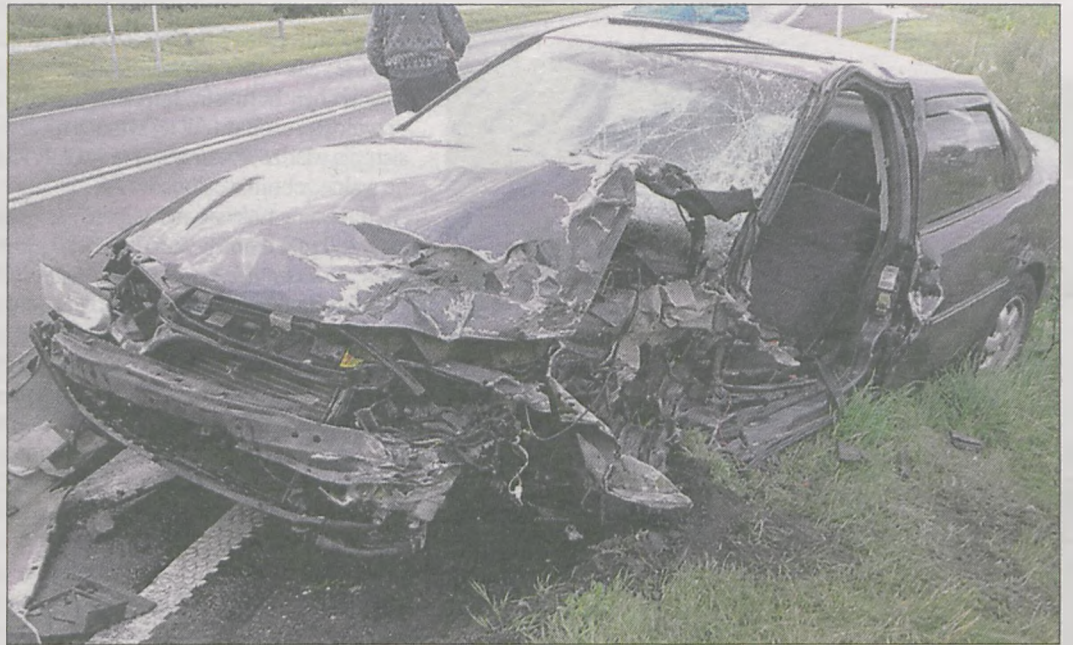
(era) Tak wyglądał opel vectra po zderzeniu z tirem

Policjanci ustalili, że kobieta przejechała ponad 300 kilometrów i nie robiła żadnych postoi na odpoczynek. Policja apeluje do kierujących o rozsądek w trakcie jazdy i dokonywanie częstych przerw.