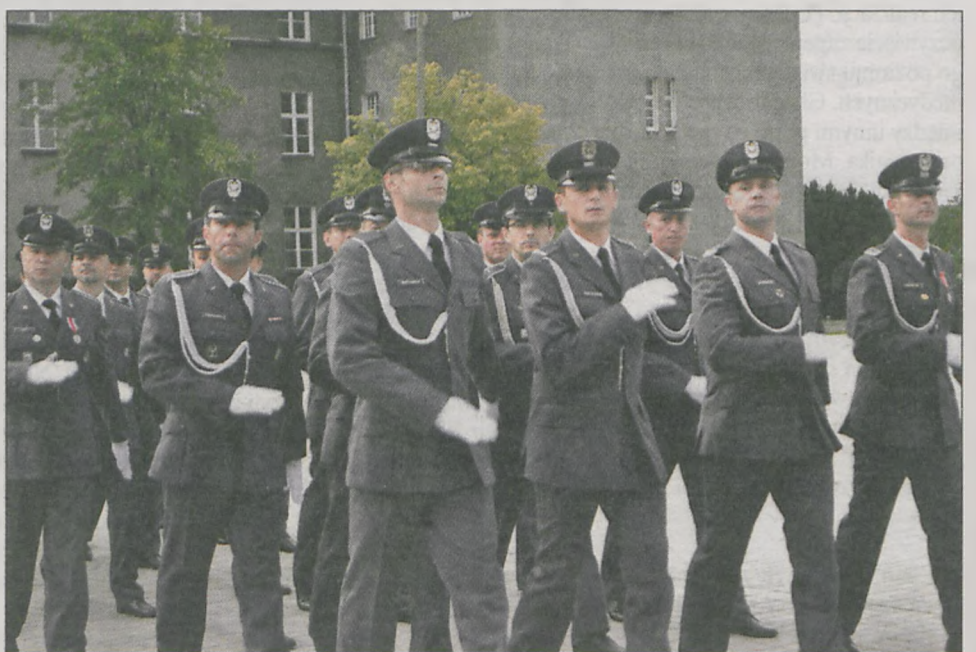
Apel zakończył się defiladą