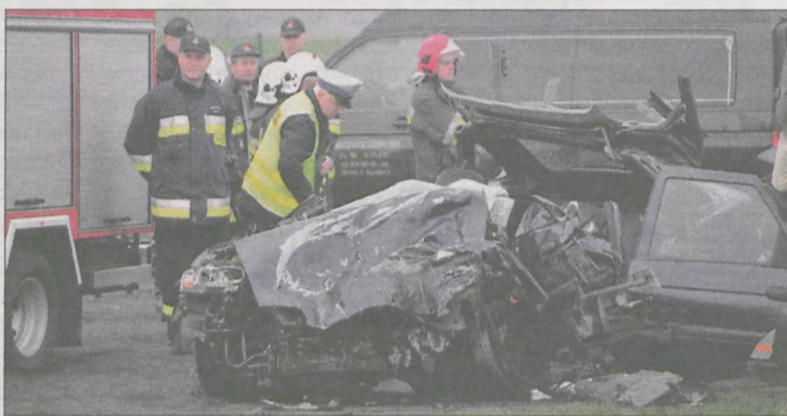
Ford escort był kompletnie zmiądzony

Sprawa dotyczy tragedii, która rozegrała się 21 kwietnia w Kotlinie na drodze krajowej nr 11. Jarocińska prokuratura zarzuciła mężczyźnie, że umyślnie naruszył zasady bezpieczeństwa w ruchu drogowym. - Kierując mercedesem sprinter, na łuku drogi, jadąc z nadmierną prędkością, nie stosując się do istniejącego na drodze ograniczenia prędkości oraz zakazu wyprzedzania,