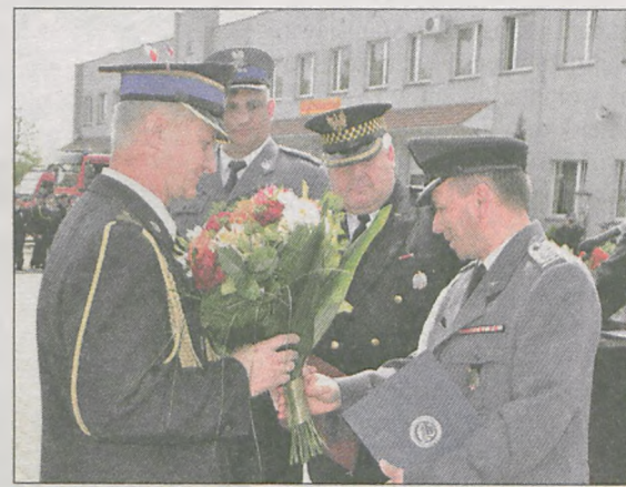
Z życzeniami do ratowników przybyli przedstawiciele pozostałych jarocińskich służb mundurowych