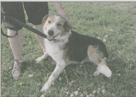
Rafano jest zaszczepiony, odrobaczony i gotowy do adopcji

schroniska mówi, że pies został schwytany przez mieszkankę Chrzana, który zamknął go w budzie na swojej posesji. Stamtąd przewieziono go do Radlina. - To jest młody pies, ma może 2 - 3 lata. Ale jest naprawdę bardzo kochany, łagodny, nie boi się obcych, daje się głaskać i prowadzić na smyczy. Poza tym jest bardzo ładny, bo wyglądem przypomina owczarka szkockiego.