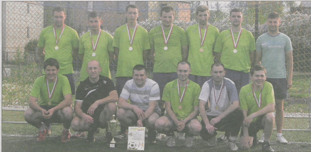
Drużyna LZS Szyplów, występująca jako Portugalia wygrała turniej Euro w Chociczy

W pierwszej grupie bezkonkurencyjna okazała się Polska (Bromast), która wygrała wszystkie mecze, a drugą pozycję zajęła Grecja (LZS Cielcza). Z drugiej awans wywalczyły ekipy Portugalii (LZS Szyplów) i Danii (Żubry Chocicza). W grupie C zabrakło Chorwacji (Stęgosz), która nie dojechała na turniej, a do dalszych gier przeszły: Irlandia (Wesołek Chocicza) oraz Włochy (Korporacja Nowe Miasto). Kom-