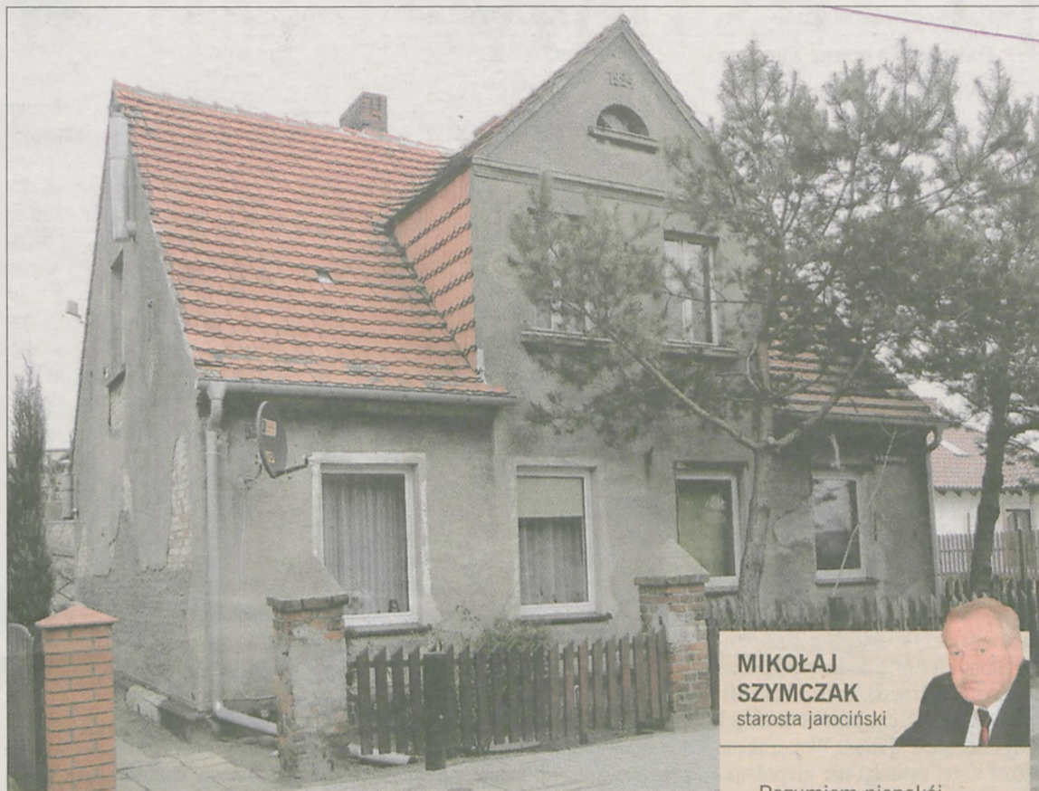
Dom przy ul. Brandowskiego może wkrótce zmienić właściciela. Lokatorka, która mieszka tam od jakiegoś czasu obawia się, że znowu będzie musiała szukać domu dla siebie i swojej córki

Kobieta udała się do Wydziału Geodezji i Gospodarki Nieruchomościami Starostwa Powiatowego w Jarocinie. - Usłyszałam, że na tym etapie to oni nie potrzebują nikogo o niczym informować. Więc poszłam do starosty - relacjonuje lokatorka. - Ten z kolei mi powiedział, że jak będzie nowy właściciel, to on już się ode