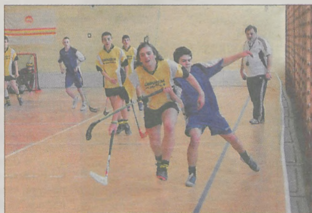
Walka w meczu finałowym była bardzo zacięta, ale nikt goli nie strzelił i o tytule mistrzowskim zdecydowały rzuty karne

Turniej sędziował Włodzimierz Szymkowiak. (pw)