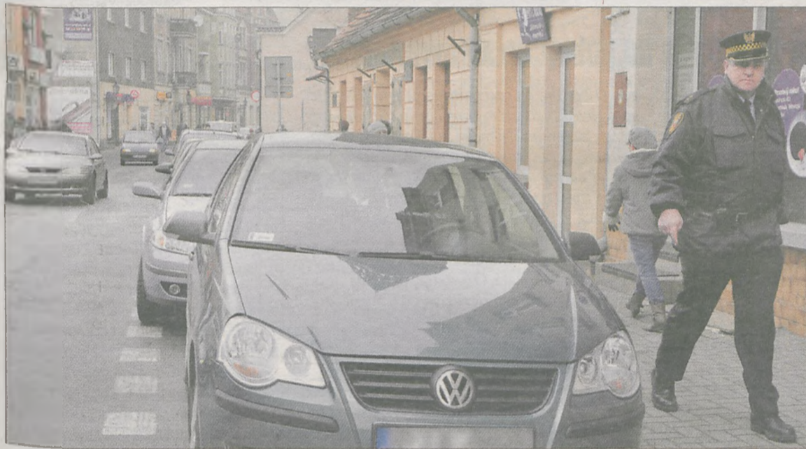
Strefa płatnego parkowania obejmie między innymi ul. Wrocławską (na zdjęciu). Biuro strefy będzie zlokalizowane w komendzie Straży Miejskiej