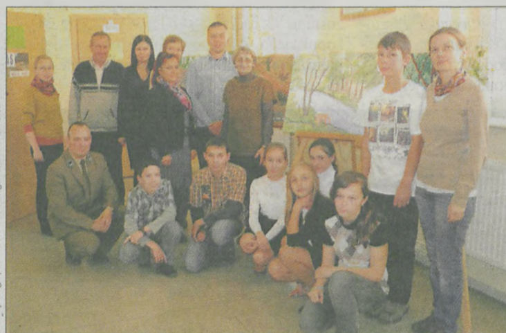
Uczestnicy i organizatorzy konkursu