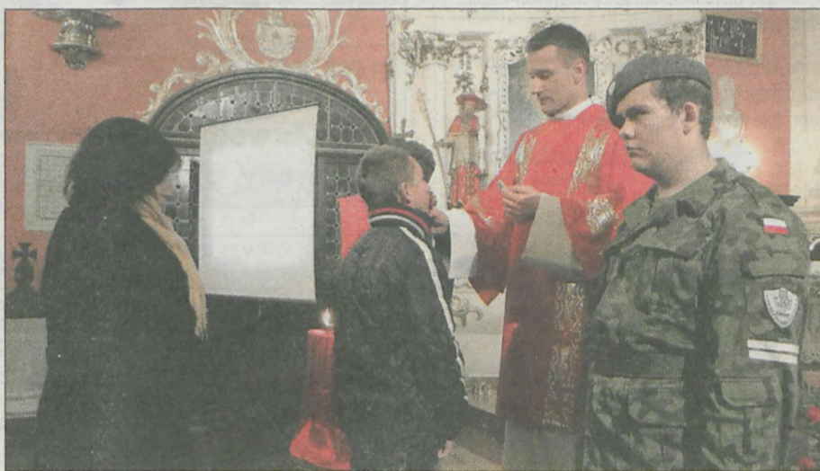
Na trzy dni do Jarocina sprowadzone zostały relikwie błogosławionej Karoliny Kózkówny

cie, które nie było prawdziwe, was poraniło. Prawdziwa miłość jest delikatna i to o nią trzeba się troszczyć - tłumaczył uczestnikom szkolnego spotkania katecheta.