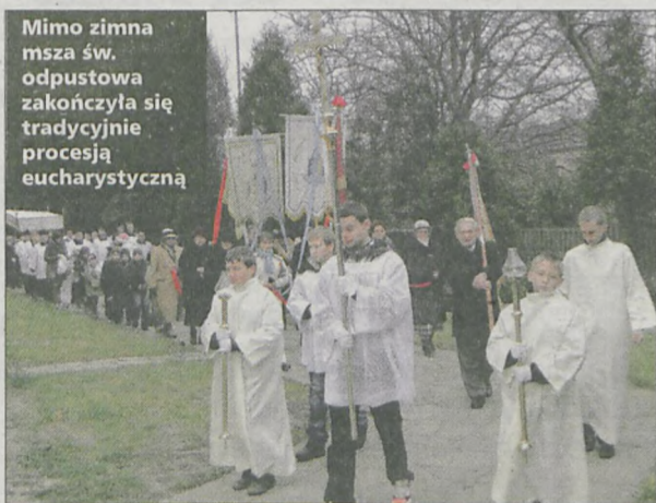
Mimo zimna msza św. odpustowa zakończyła się tradycyjnie procesją eucharystyczną