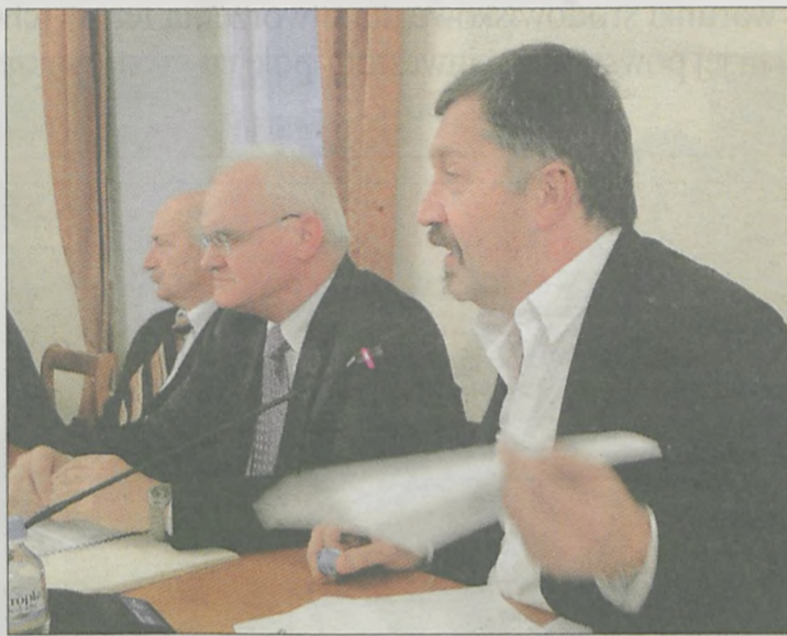
Radnym powiatowej opozycji nie podobało się, że nie zostali zaproszeni na uroczystości Święta Niepodległości