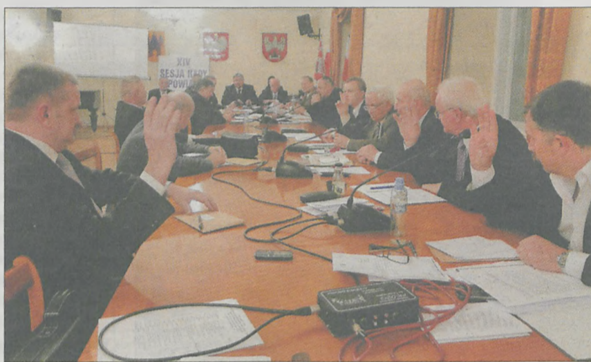
Swoj sprzeciw wobec sposobu wprowadzenia do WPF-u 12 mln zł obligacji wyraziło w głosowaniu czterech radnych powiatowej opozycji

▶ Możliwości wydatków majątkowych w powiecie do 2021 roku będą równe zero - stwierdzili radni powiatowej opozycji podczas dyskusji nad Wieloletnią Prognozą Finansową Powiatu Jarocińskiego na lata 2011 - 2021. W dokumencie znalazła się bowiem emisja obligacji na 12 mln zł.