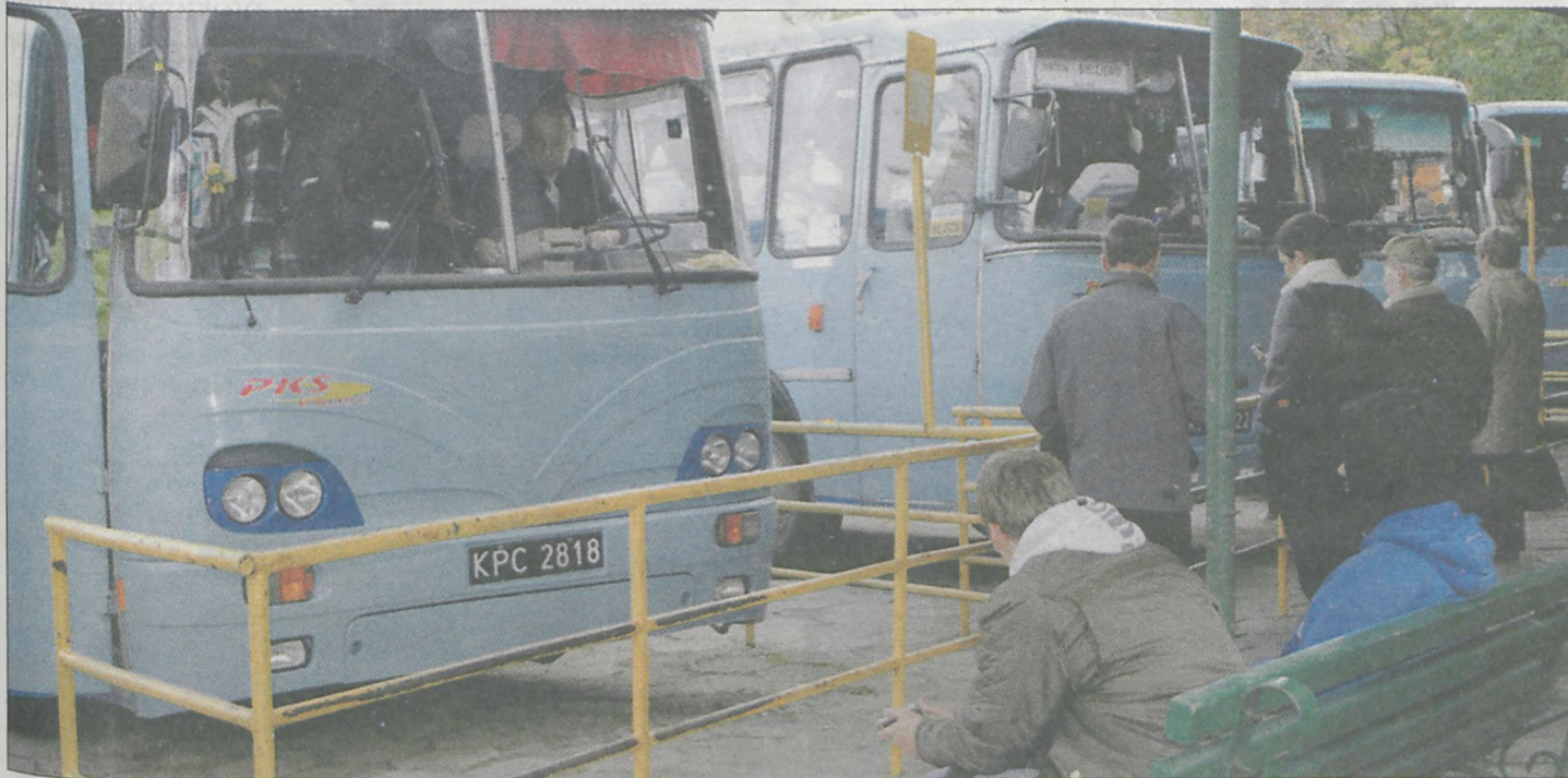
Od Nowego Roku autobusy PKS nie będą jeździły do gmin Żerków i Jaraczewo

▶ Od Nowego Roku PKS zawiesza kursy do gmin Żerków i Jaraczewo. Tylko samorząd Kotlina zdecydował się dopłacić do przewozów.