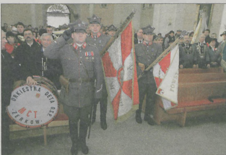
Nowy sztandar grupy rekonstrukcyjnej Powstania Wielkopolskiego z Mieszkowa