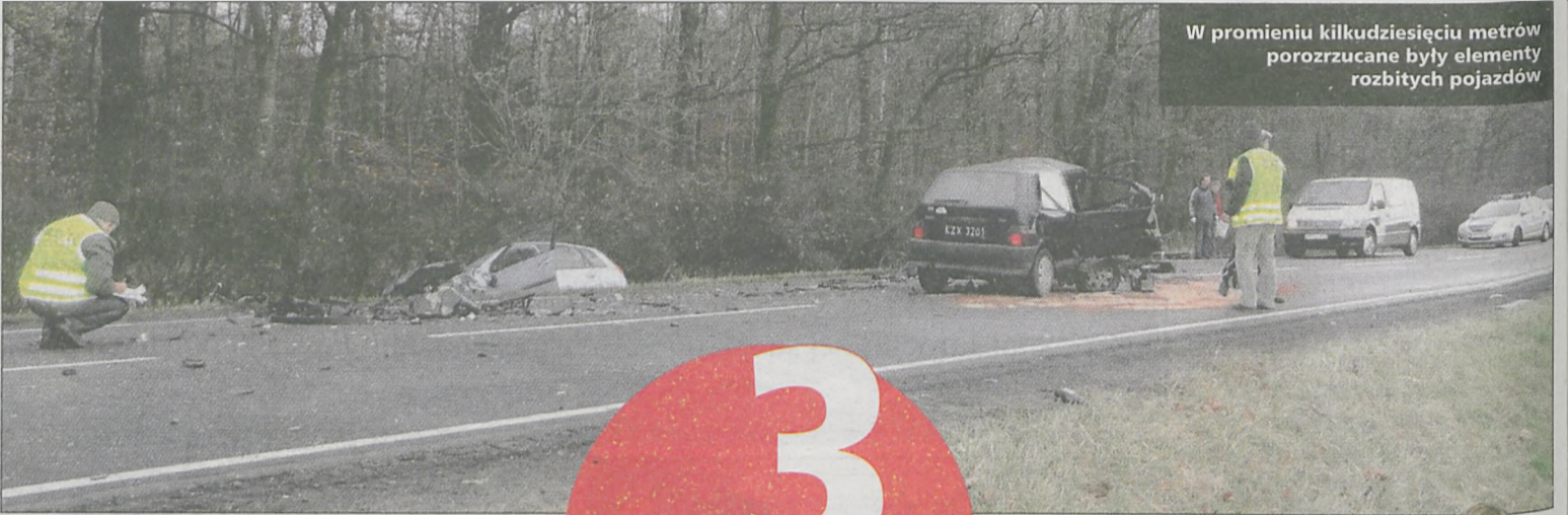
W promieniu kilkudziesięciu metrów porozrzucone były elementy rozbitych pojazdów