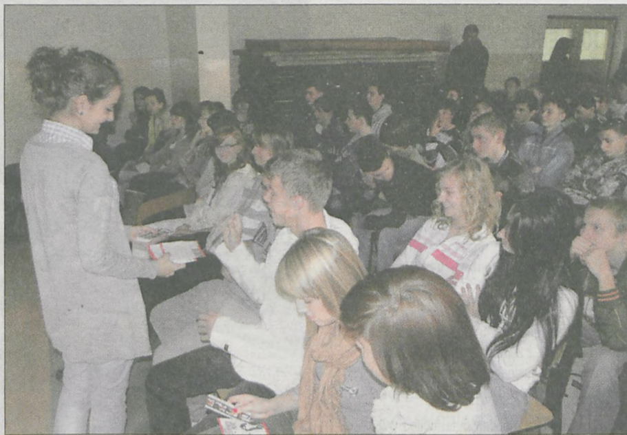
Na zakończenie każdego ze spotkań chętni mogli otrzymać materiały dotyczące Ruchu Czystych Serc, któremu patronuje błogosławiona Karolina. Pierwsza w diecezji kaliskiej grupa RCS-u od niedawna działa w parafii św. Marcina