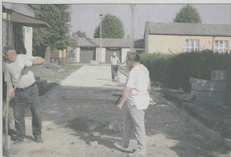
We wrześniu utwardzono plac przy świetlicy wiejskiej w Woli Książęcej