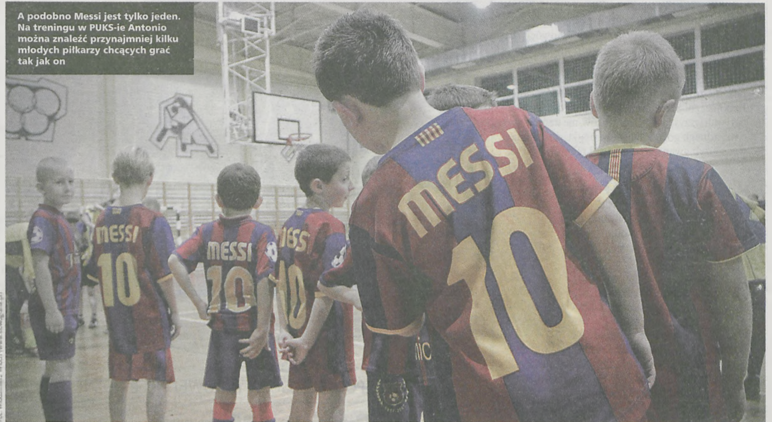
A podobno Messi jest tylko jeden. Na treningu w PUKS-ie Antonio można znaleźć przynajmniej kilku młodych piłkarzy chcących grać tak jak on

▶ Jeżeli Twoje dziecko ma ochotę uprawiać sport, a nie wystarczają mu zajęcia w szkole czy w przedszkolu, to nie powinno mieć problemu, aby realizować swoją pasję gdzie indziej.