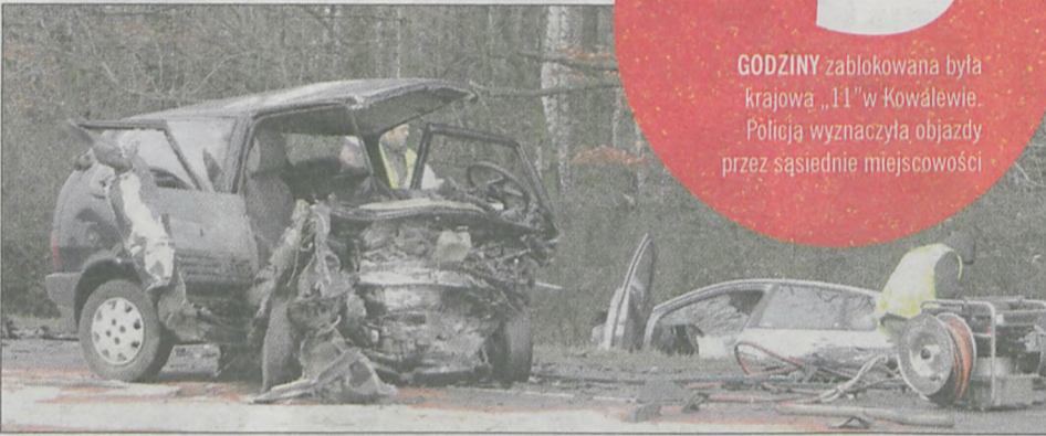
Przód fiata był kompletnie roztraskany

Niedzielną poranek, krajowa 11 w Kowalewie. W kierunku Pleszewa jedzie ford fiesta. Auto prowadzi 28-letni mieszkaniec Wroniek. Nagle, na łuku drogi, ford zjeżdża na przeciwny pas ruchu. Dochodzi do czołowego zderzenia z fiatem uno, którym kieruje 23-latek z Golin. O godz. 8.24 o wypadku poinformowany zo-