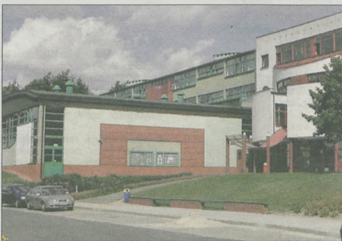
W gimnazjum w Żerkowie przed rozpoczęciem roku szkolnego pomalowano natryskowe elementy elewacji i wyremontowano magazyn sprzętu