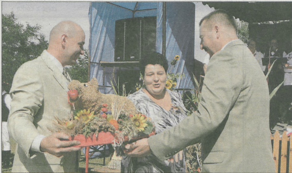
Delegacje poszczególnych sołectw wręczyły wójtowi własnoręcznie przygotowane wieńce dożynkowe. Niektóre miały oryginalne kształty - były m.in. młyn, łódź i prosiak (na zdjęciu delegacja Wojciechowa)