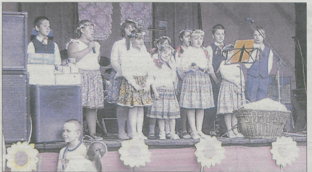
W części artystycznej zaprezentowały się dzieci z miejscowej szkoły

Wiejskie święto plonów zainaugurowała msza święta. Po południu mieszkańcy spotkali się na „rynku” w Sławoszewie, gdzie odbyła się część