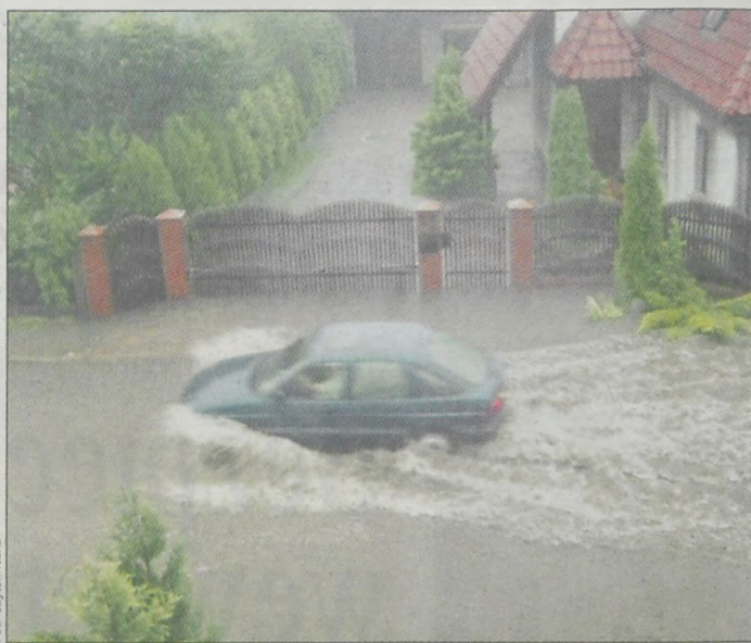
Ulica Cmentarna w Cielczy zamieniła się w rwący potok

35 razy interweniowali strażacy po burzy, jaka w środę przeszła nad Jarocinem. Ich działania polegały głównie na wypompowaniu wody z zalanych piwnic.