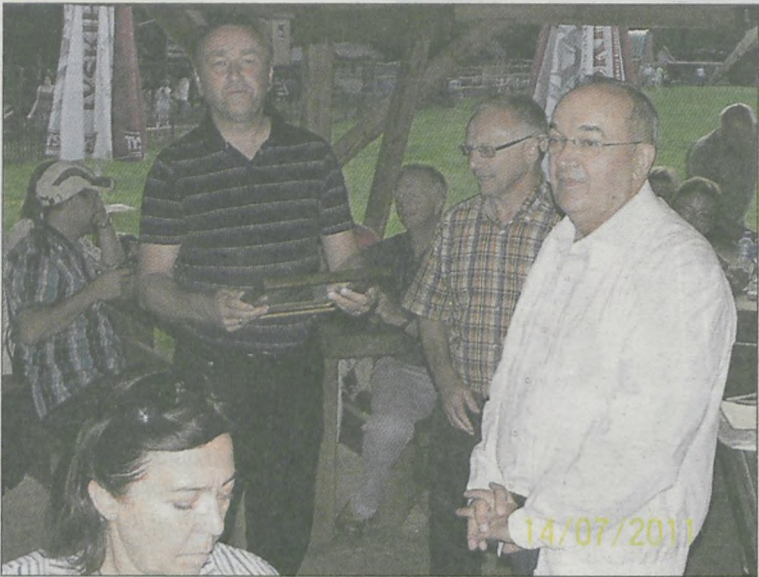
Biesiadę zorganizowano dla niemieckiej delegacji w Hermanowie