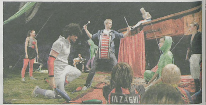
Przedstawienie nawiązywało do książki „Pinokio” Carla Collodiego, ale wzbogacone było o wiele dodatkowych elementów