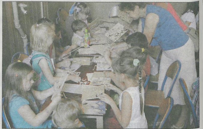
Podczas warsztatów „stolarskich” uczestnicy składali m.in. meble dla bohaterów bajki