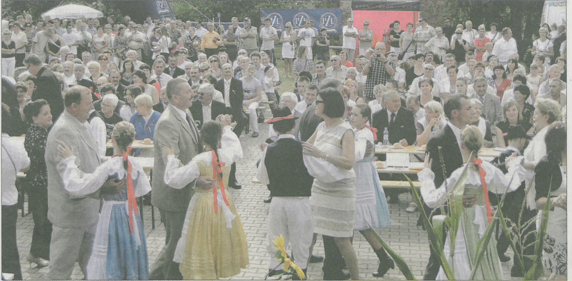
Zgodnie z tradycją dożynkową musiało się odbyć „obtańczenie wieńca”. Gości do tańca poprosiły dzieci z zespołu „Noskowiacy”