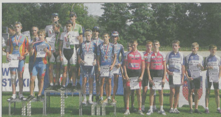
Drużyna chłopców Victorii Jarocin wywalczyła brązowy medal w wyścigu na 2000 m

Międzywojewódzkie Mistrzostwa Młodzików w Kolarstwie Torowym