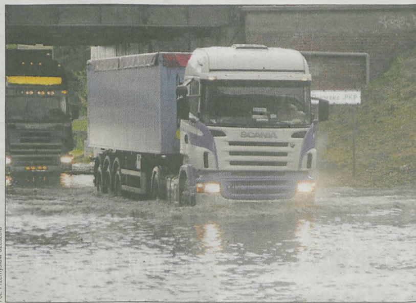
Nawet ciężarówki miały problemy z przejechaniem pod mostem na al. Niepodległości w Jarocinie

Podtopionych zostało kilka jarocińskich budynków użyteczności publicznej, m.in. Sąd Rejonowy, Urząd Skarbowy, Hotel Jarota i Miejsko-