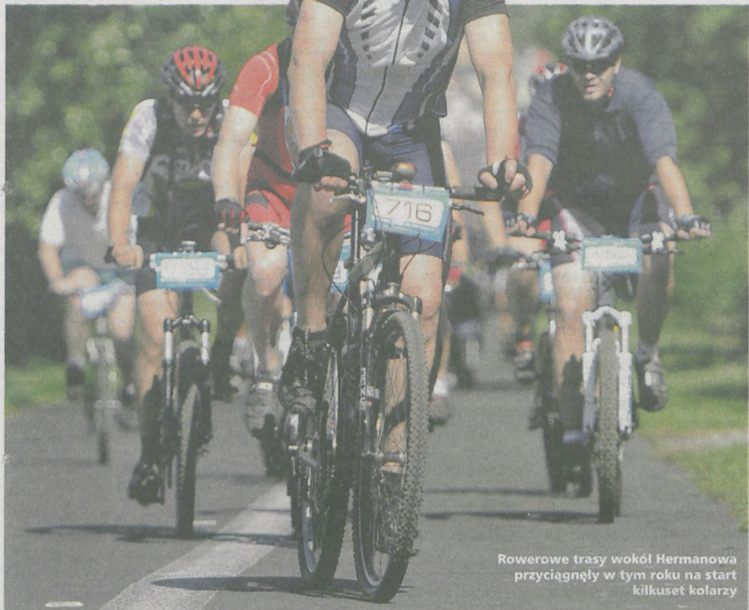
Rowerowe trasy wokół Hermanowa przyciągnęły w tym roku na start kilkuset kolarzy