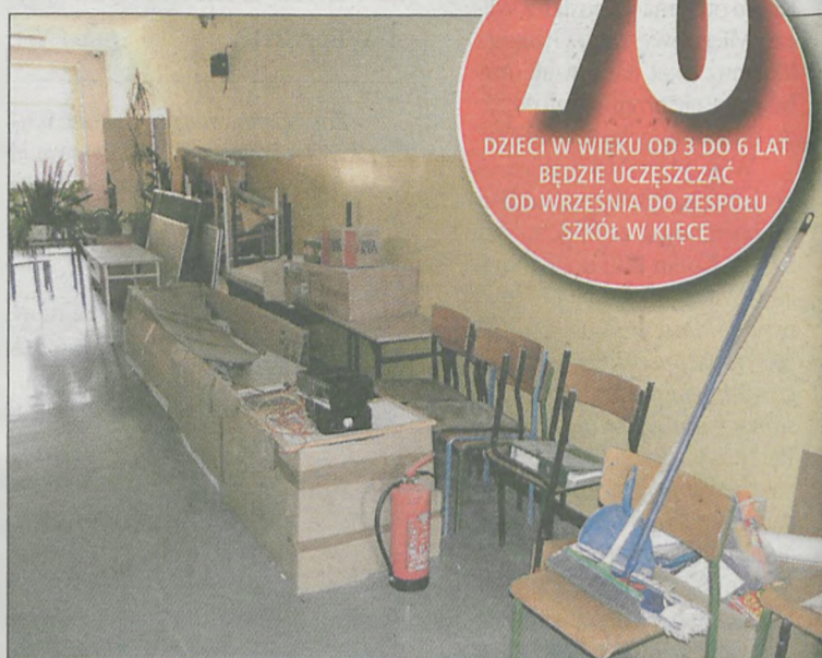
W Zespole Szkół w Klęce zaadaptowane zostały pomieszczenia do przyjęcia większej ilości małych dzieci

70 DZIECI W WIEKU OD 3 DO 6 LAT BĘDZIE UCZĘSZCZAĆ OD WRZEŚNIA DO ZESPOŁU SZKÓŁ W KLĘCE