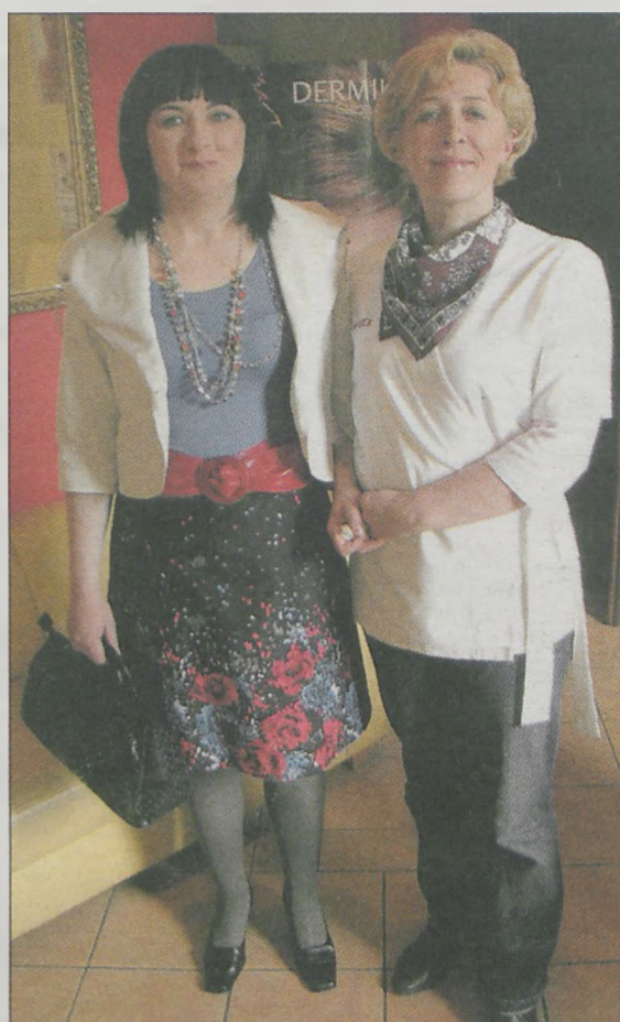
Po raz kolejny salon „DanHen” wypożyczył rzeczy do sesji zdjęciowej. Nasza Czytelniczka otrzymała też upominki - broszkę i apaszkę