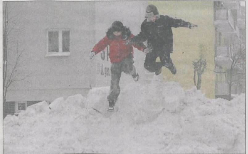
CO DLA JEDNYCH BYŁO UTRAPIENIEM , dla innych okazją do zabawy. Ul. gen. Bema w Jarocinie