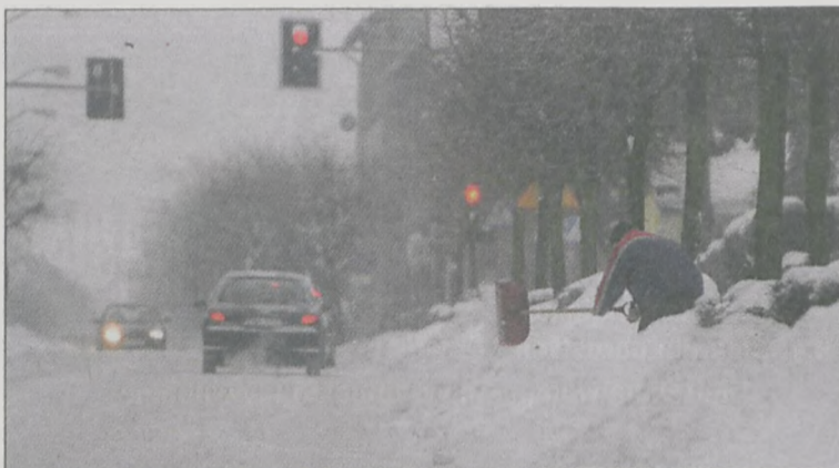
UL. MONIUSZKI. Służby i mieszkańcy wymienili się stertami śniegu