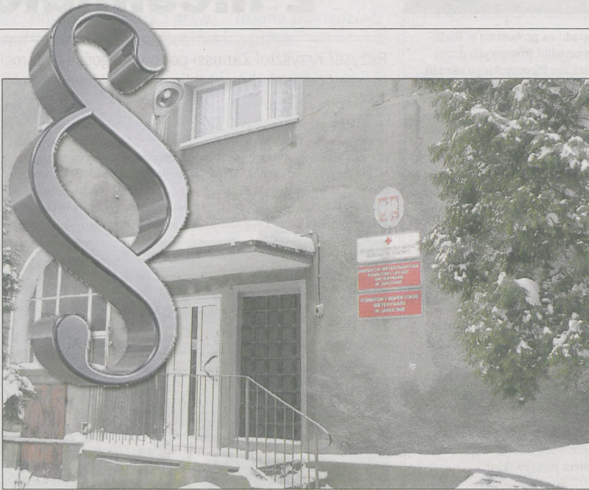
BYŁEJ KSIĘGOWEJ z Powiatowego Inspektoratu Weterynarii prokuratura postawiła zarzut z art. 278 par. 1 kodeksu karnego - kradzież. Jak to możliwe, że kobieta - tak twierdzą śledczy - przez kilka lat bezkarnie wyprowadzała pieniądze z tej instytucji?

„Gazeta” dotarła do wystąpienia pokontrolnego, jakie pracownicy wojewody wysłali do Powiatowego Lekarza Weterynarii w lipcu 2009 r. Skontrolowali wtedy finan-