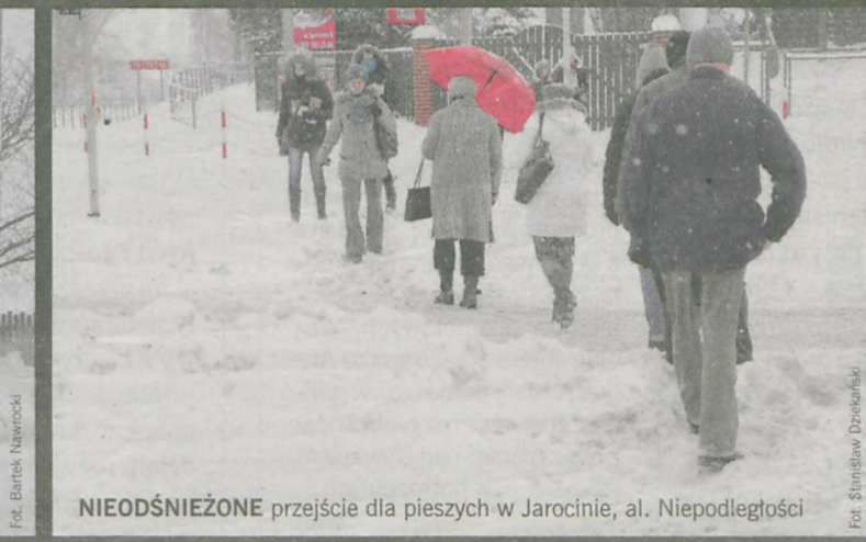
NIEODŚNIEŻONE przejście dla pieszych w Jarocinie, al. Niepodległości