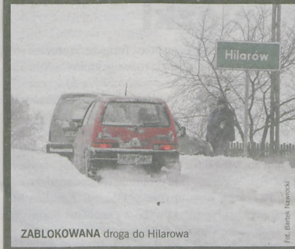
ZABLOKOWANA droga do Hilarowa