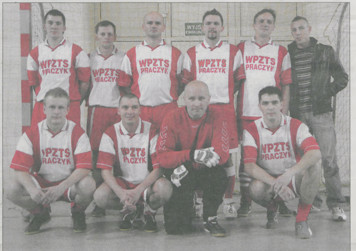
ZESPÓŁ WPZTS PRACZYK po zwycięstwie 7:2 nad Francesco awansował na czwarte miejsce w tabeli