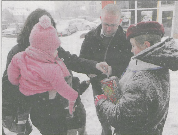
W ZGODNEJ OPINII WOLONTARIUSZY, jarociniacy chętnie sięgali do portfeli