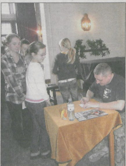
PO SPOTKANIU do pisarza ustawiła się długa kolejka - po autograf

Czy ma żonę, jakim samochodem jeździ, jaką drużynę piłki nożnej lubi najbardziej, czy cierpiat z powodu nieszczęśliwej miłości, czy napisze książkę specjalnie dla swojego syna, gdy będzie go miał i ile razy przeczytał „Trylogię” - dopytywali się chłopcy z piątej i szóstej klasy.