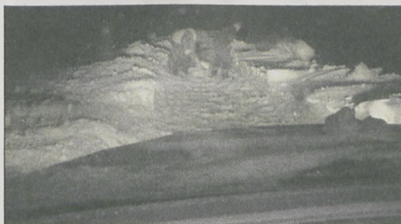
NIE PRZEKOPIESZ, NIE PRZEJEDZIESZ. Droga w Chromcu (gm. Nowe Miasto) w sobotę wieczorem, jak twierdzi internauta, zasypany śniegiem ponad pół metra