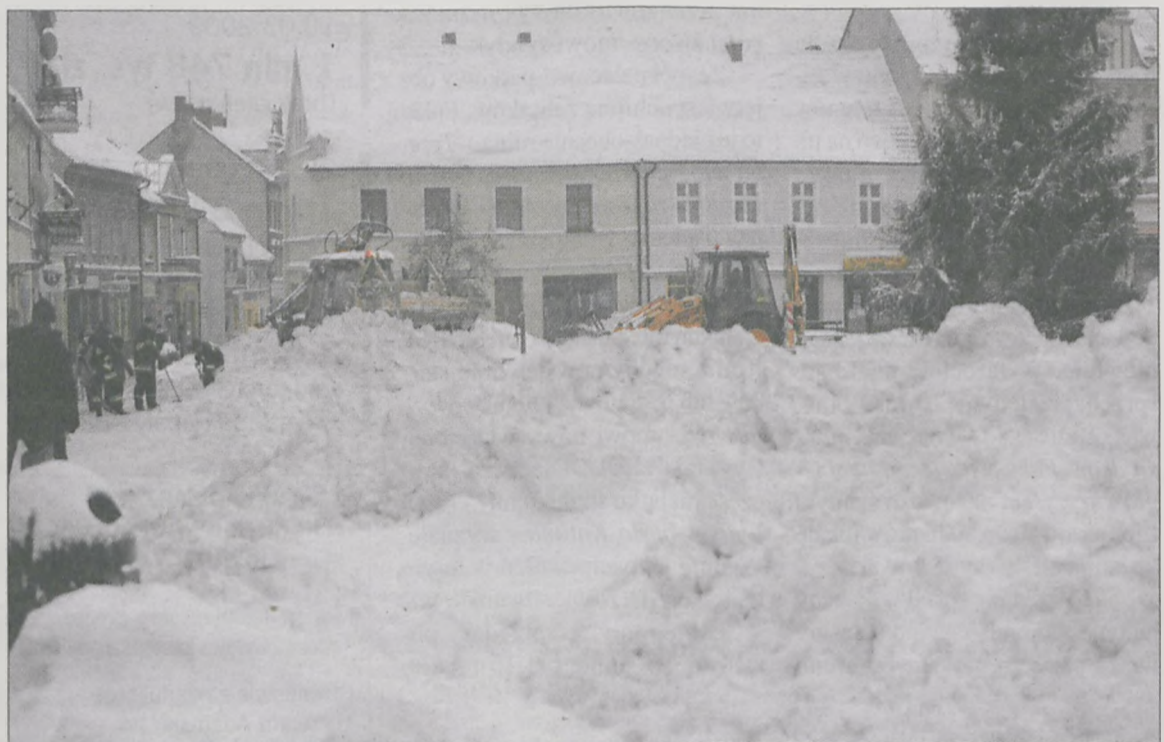
CO ZROBIĆ Z ZALEGAJĄCYM na rynku i jarocińskich ulicach śniegiem, zastanawiał się w poniedziałek w urzędzie specjalnie powołany sztab kryzysowy. W końcu na ulice wyjechały koparki i wywrotki, bo uradzono, że... śnieg trzeba wywieźć. W pierwszej kolejności oczyszczono rynek. W akcji firmom Eko-Dbaj i Drobud pomagali strażacy z Ochotniczej Straży Pożarnej