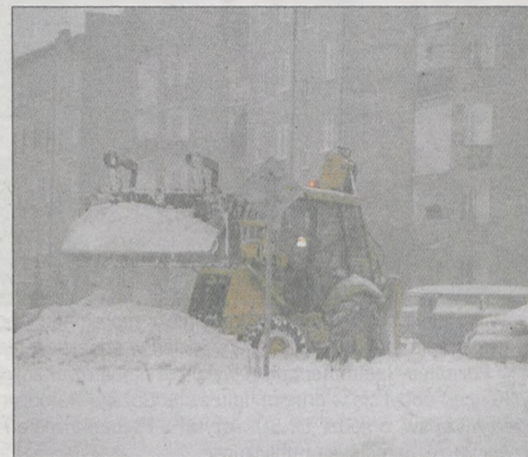
WALKA ZE ŚNIEGIEM na os. Konstytucji 3-go Maja. Tutaj w niedzielę po południu większość przejazdów była udrożniona