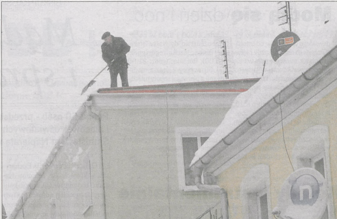
STRAŻ POŻARNA APELUJE o odśnieżanie dachów. Jak widać, nie wszyscy czekają na ponaglenia służb. Kamienica przy rynku w niedzielę przed południem