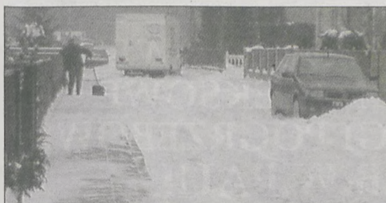
TAK WYGLĄDAŁA ulica Sosnowa w Nowym Mieście w niedzielę po południu