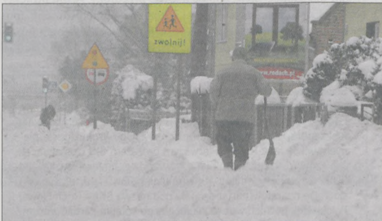
WIĘKSZOŚĆ MIESZKAŃCÓW niedzielę spędziła na walce ze skutkami śnieżycy. Ul. Wrocławska w Jarocinie