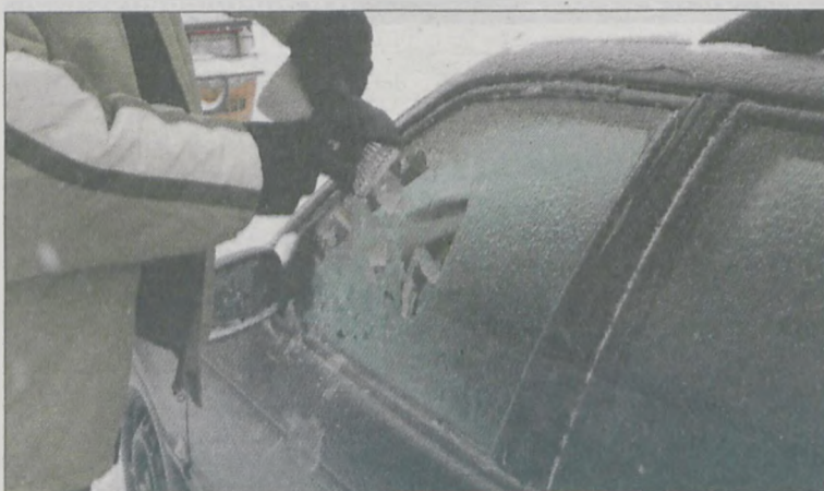
KIEROWCY MIELI PROBLEM z uruchomieniem aut