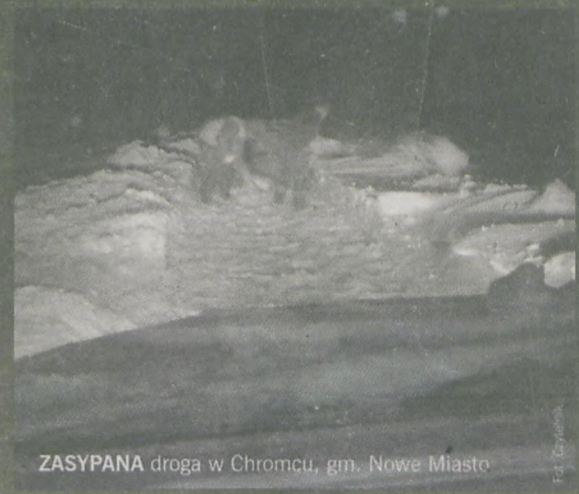
ZASYPANA droga w Chromcu, gm. Nowe Miasto