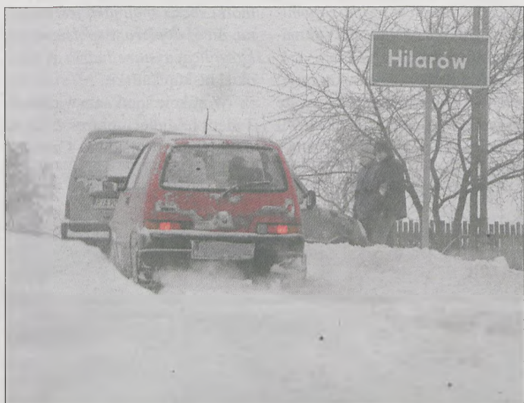
WYSTARCZYŁA CHWILA I WJAZD do miejscowości został zablokowany. Najlepiej służby radziły sobie na drogach krajowych. Najgorzej, jak zwykle, było na trasach gminnych i powiatowych.