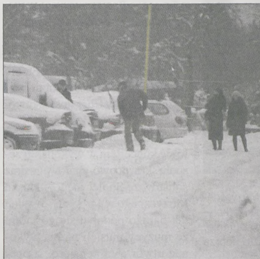
TYŁY KAMIENICY na ul. T. Kościuszki w Jarocinie. Większość dróg osiedlowych była kompletnie nieprzejezdna