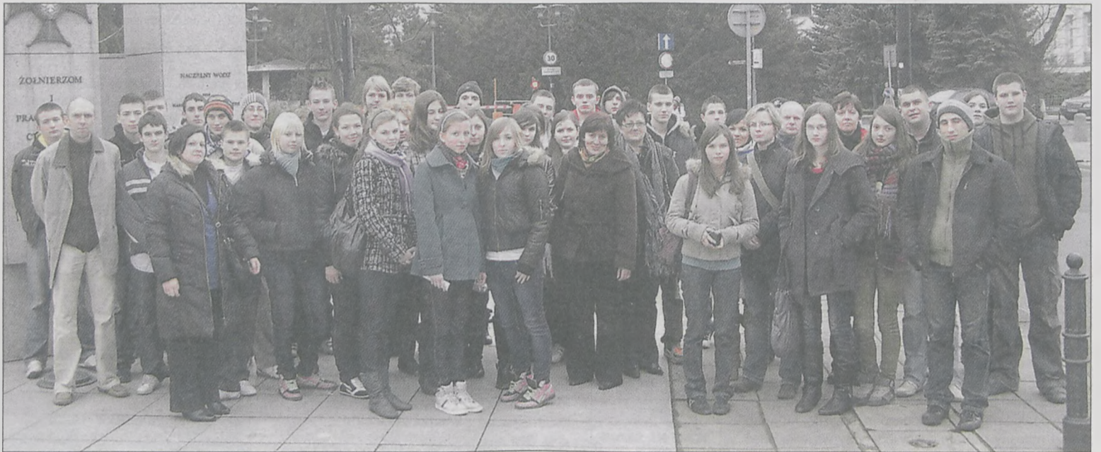
DO WARSZAWY WYJECHALI uczniowie z Jarocina, Wilkowyi, Cielczy, Goliny, Witaszyc i Potarzycy

Zwiedzanie Warszawy rozpoczęło się od wizyty w Sejmie. Uczestnicy wyjazdu mieli możliwość zwiedzenia sali obrad, Sali Kolumnowej, przeszli korytarzami sejmowymi, a także zatrzymali się przed tablicą upamiętniającą posłów, którzy zginęli w czasie II wojny światowej. Duże wrażenie na zwiedzających wywarło spotkanie z posłem Grzegorzem Napieralskim, który opowiedział im o codziennym życiu w Sejmie, swoich początkach jako polityka, a także o bliskich związkach z Jarocinem. Młodzież miała możliwość zadawania pytań posłowi, a na koniec zro-