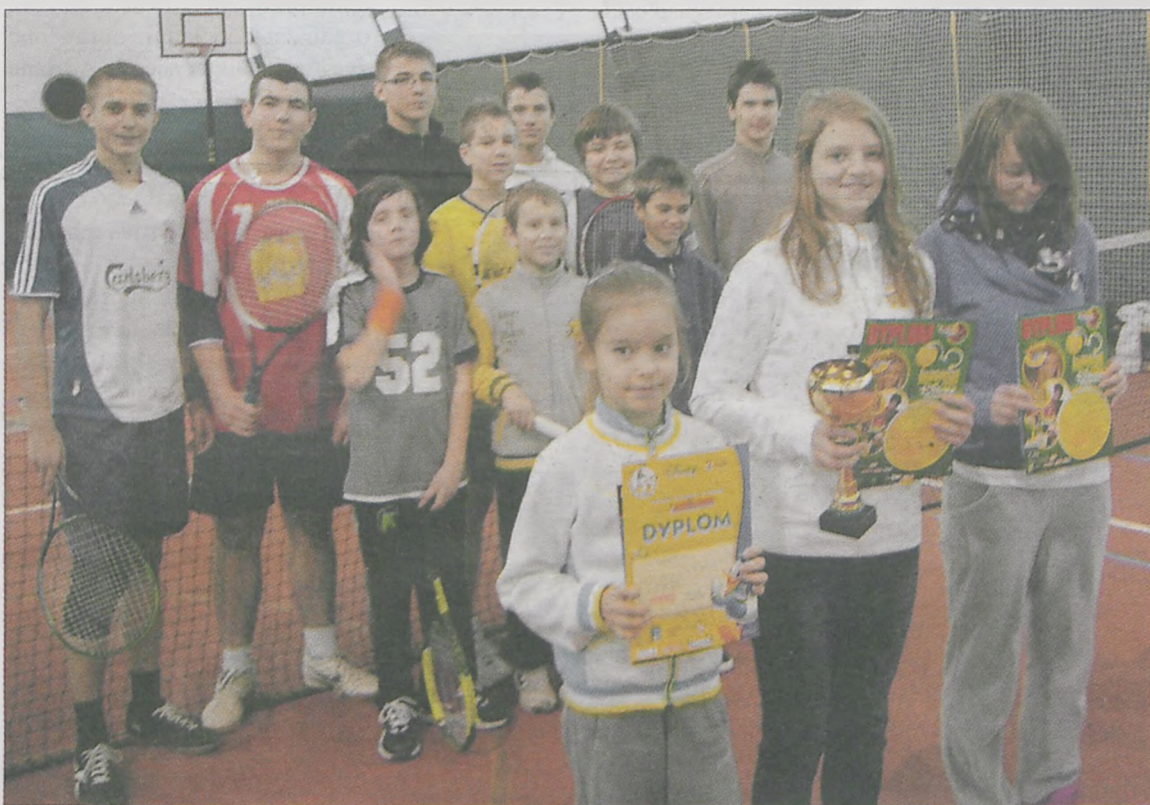
W I TENISOWYM TURNIEJU GWIAZDKOWYM w Jarocinie wzięło udział 16 tenisistów