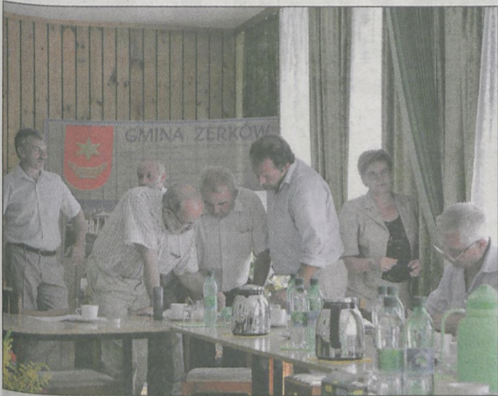
FORMALNIE ŻERKOWSCY RADNI nie mają żadnego wpływu na wybór osoby, która pokieruje gminą. Na zdjęciu podczas czwartkowej komisji.

głosowanie. Zdaniem prawnika żerkowska rada powinna przyjąć we wrześniu uchwałę o nieprzewodzeniu wyborów. Nie jest ona wiążąca dla wojewody, ale jest pewnym sygnałem opiniotwórczym. Gdyby jednak wybory ogłoszono, stałoby się to nie wcześniej niż na początku przyszłego roku. Przykłady z wo-