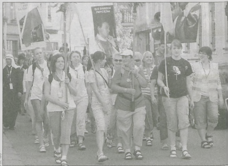
PIELGRZYMI WYRUSZYLI Z JAROCINA ze śpiewem na ustach. Tydzień później, w czwartek 13 sierpnia dotarli na Jasną Górę