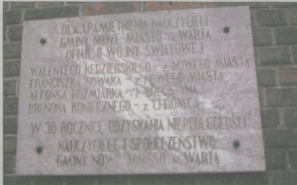
TABLICA umieszczona na budynku szkoły w Nowym Mieście n. W.