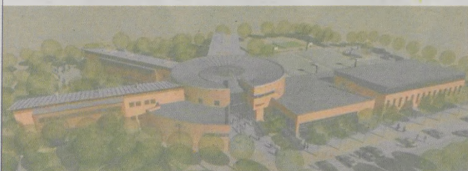
Nowy budynek dydaktyczny WWSSE w budowie

Jednocześnie wszystkich zainteresowanych ofertą i działalnością www.wwsse.pl , a także do subskrypcji naszego e-biuletynu, który zapewni stały dopływ bieżących informacji z życia uczelni. Dziękuję za rozmowę.