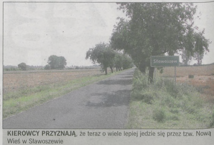
KIEROWCY PRZYNAJĄ, że teraz o wiele lepiej jedzie się przez tzw. Nową Wsieć w Sławoszewie

DZIECI Z JARACZEWA, KOTLINA I ŻERKOWA PÓJDĄ DO PRZEDSZKOLA W JAROCINIE