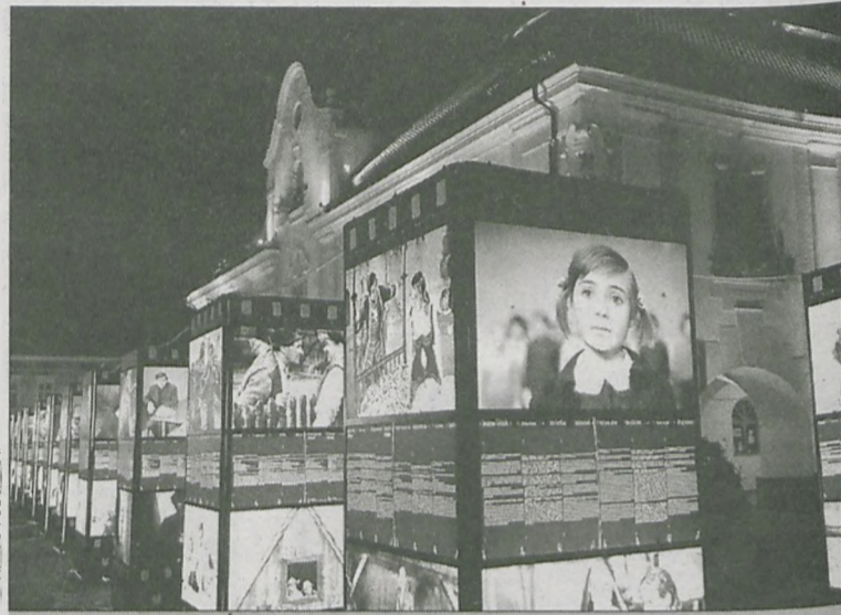
WYSTAWA FOTOSÓW została otwarta w środowy wieczór. Fotosy można będzie oglądać u nas do 10 września

Do naszego miasta ekspozycja trafiła dzięki staraniom Stowarzyszenia Jarocin XXI, które wzięło udział w konkursie ogłoszonym przez Polski Instytut Sztuki Fil-