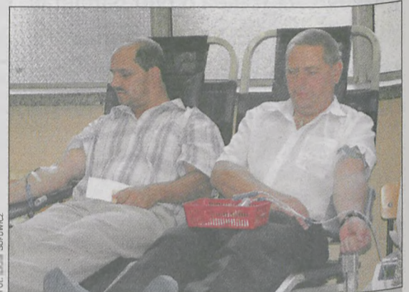
PODCZAS AKCJI krew oddało mimo sezonu urlopowego ponad czterdziestu dawców

dzie Konwój Muszkieterów, który po raz drugi organizuje akcję pod hasłem: „Oddaj Krew - Uratuj Życie”. Akcja trwa od kwietnia do października i obejmuje 126 miejscowości w całej Polsce. Pobieranie w Jarocinie odbywać się będzie w godz. 10.00 - 15.00 w specjalnym ambulansie ustawionym na parkingu przy Intermarche „Szarotka” (ul. Powstańców Wielkopolskich 16). W tym dniu wyjątkowo nie będzie czynny punkt krwiodawstwa w klasztorze franciszkanów. Dawcą może zostać