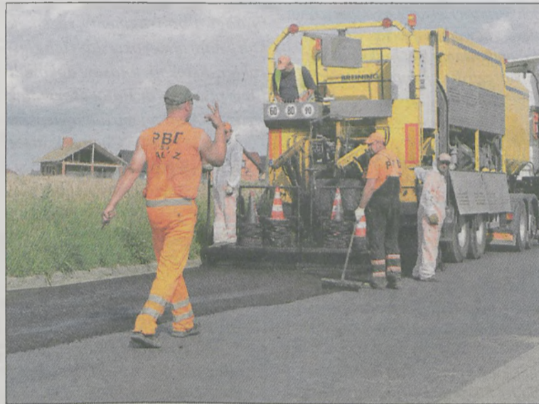
NAWIERZCHNIĘ NA UL. GLINKI wykonuje Przedsiębiorstwo Budownictwa Drogowego z Kalisza

Pod koniec września zaplanowano oddanie do użytku chodnika z kładką dla pieszych na ul. Potarzyckiej w Siedleminie. Miesiąc później Kanbud ma sfinalizować budowę parkingu przy urzędzie miejskim. Powstanie 80 miejsc postojowych. Na początek listopada przewidziano zakończenie kanalizacji deszczowej na ul. Sienkiewicza w Cielczy oraz Dunajeckiej, Lutyńskiej i Nyskiej w Jarocinie. Kanalizacja budowana będzie także na ul. 700-lecia. (ag)