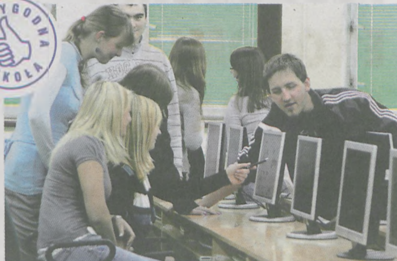
Studenci WWSHE w Jarocinie

W tegorocznej edycji projektu certyfikacji niepublicznych szkół wyższych na listę Wiarygodnych Szkół wpisano 78 uczelni z całej Polski, z czego 10 stanowią szkoły z Wielkopolski. Według organizatorów projekt ma pomóc maturzystom w wyborze takiej szkoły wyższej, która działa w oparciu o silne podstawy prawne, posiada odpowiednią bazę dydaktyczną, zapewnia komfortowe warunki studiowania, tworzy perspektywy dla przyszłej pracy zawodowej, pozwala realizować się słuchaczom poprzez pozadydaktyczne formy działalności Uczelnie poddają się ocenie dobrowolnie. Spośród wszystkich zgłoszonych placówek wylaniane są te, które zasługują na miano wiarygodnych. Na ocenę składa się analiza specjalnie opracowanych ankiet oraz wizytacja placówki. Wielkopolska Wyższa Szkoła Humanistyczno-Ekonomiczna w Jarocinie zgłosiła się do projektu ACI pierwszy raz i od razu została wpisana na Listę Wiarygodnych Szkół. - Przedsięwzięcie