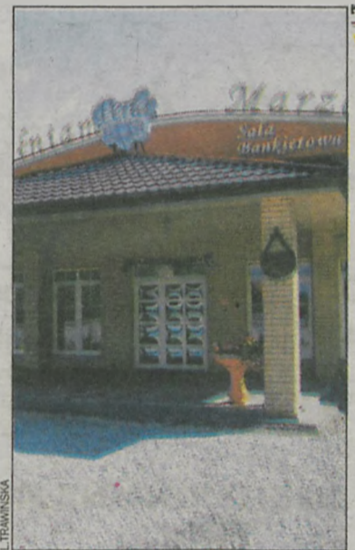
Obiekt robi wrażenie

Sala bankietowa Perła o powierzchni 350 metrów kwadratowych jest w stanie pomieścić nawet 200 osób. Istnieje także możliwość podzielenia jej na mniejsze, gdy organizowane są np. komunie czy chrzciny. Przy wejściu usytuowany jest przestronny hol, dalej także sala konferencyjna i trzy pokoje dla gości. Obiekt ma profesjonalną scenę, wysokiej klasy nagłośnienie oraz w pełni wyposażoną kuchnię. Dużym plusem jest to, że nie stoi bezpośrednio przy drodze, przed salą znalazło się więc miejsce na tereny zielone i ławeczki. W planach właścicielki jest budowa placu zabaw dla dzieci. Auto można zaparkować na utwardzonym parkingu.