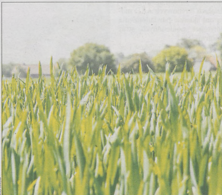
Wymóg różnicowania upraw dotyczy gospodarstw pow. 10 ha

W okresie 15 maja – 15 lipca uprawiane rośliny powinny znajdować się na polu, co będzie sprawdzane. W celu obliczenia udziału upraw rolnik może zadeklarować