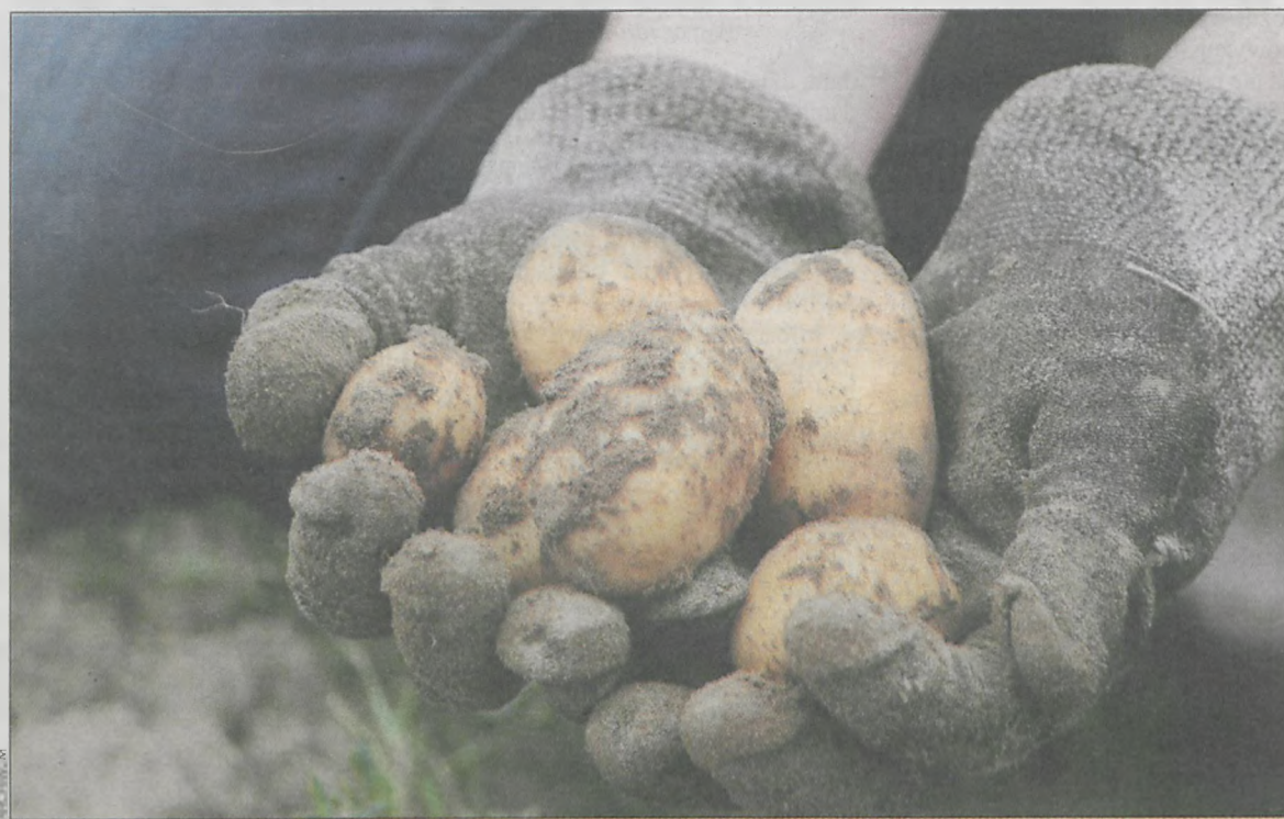
Obecne ceny nie są w stanie pokryć nawet kosztów produkcji