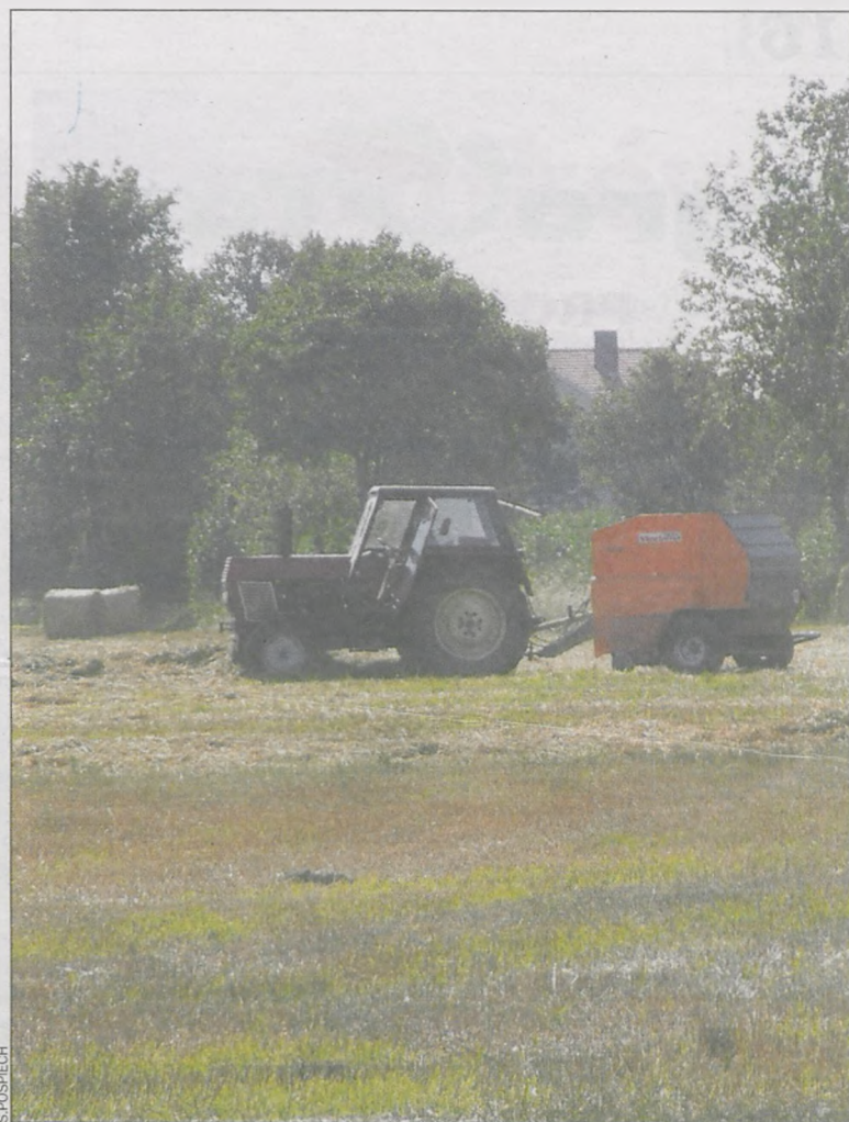
Prace na polach w większości dobiegły już końca