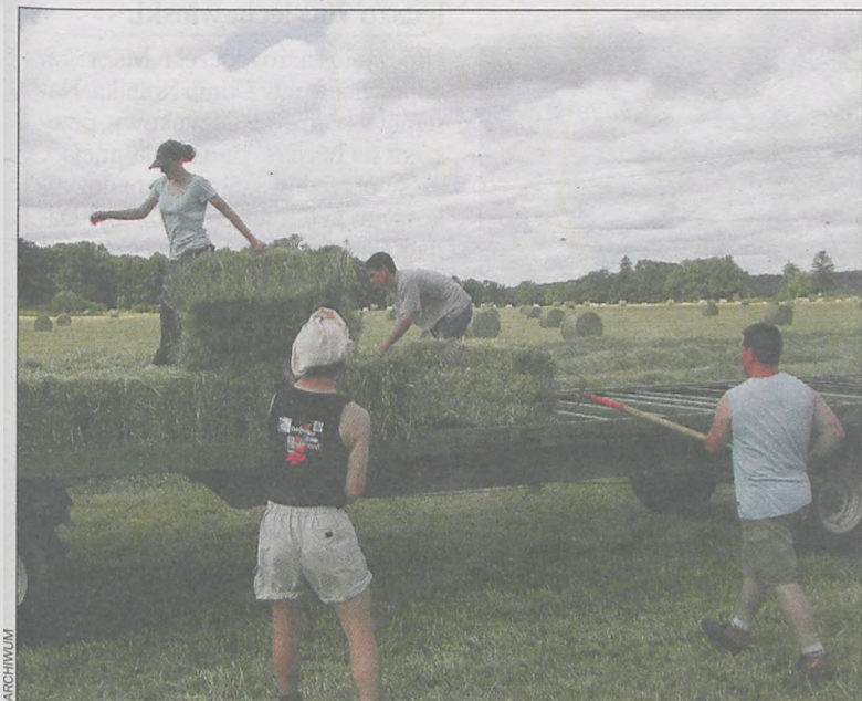
Wnioski o dopłaty złożyło 3700 osób

Ile pieniędzy unijnych otrzymają w tym roku rolnicy z powiatu krotoszyńskiego? Czy będzie to suma większa niż za rok 2013, okaże się niebawem. 30 września zostanie podany kurs euro, według którego będą naliczane płatności bezpośrednie.