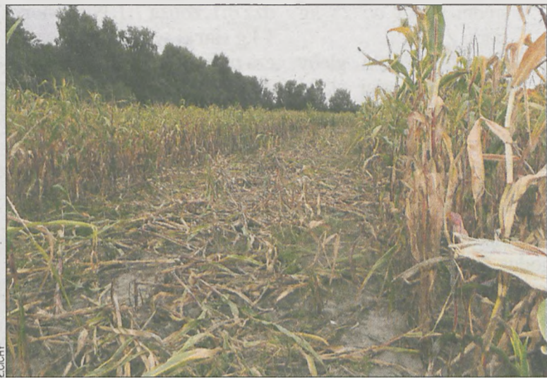
Pole kukurydzy zostało zdewastowane przez dziki

W jaki sposób obliczana jest kwota odszkodowania? Za kwintal kukury-