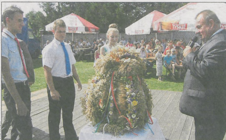
Mistrzynie wykonane wieńce dożynkowe zachwycały wszystkich