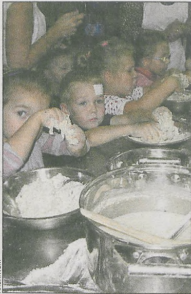
Pieczenie chleba to nie tylko tradycja, ale też dobra zabawa

już wspólnym pomysłem bułakowian. Tym razem zajęto się tradycjami dożynkowymi. – Napisaliśmy projekt i otrzymaliśmy 700 zł z programu grantów powiatu gostyńskiego, realizowanego przez stowarzyszenie „Dziecko”. Przedsięwzięcie polega na podtrzymywaniu tradycji dożynkowych. Jego elementem jest na