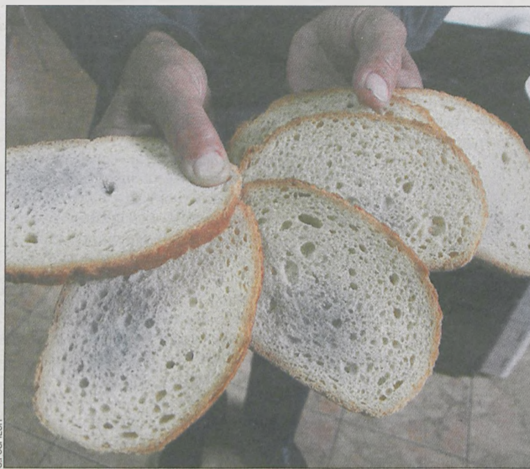
Chleb rzeczywiście był spleśniały. Tylko z czyjej winy?

Do redakcji przyszedł mężczyzna skarżący się na spleśniały chleb z jednej z krotoszyńskich piekarni.