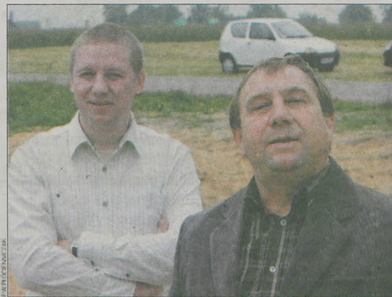
Współwłaściciele firmy Skynet w Tomnicach