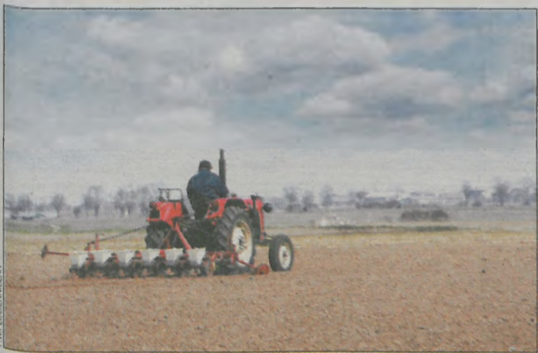
Rolnicy muszą ponownie obsiewać pola, ale nie mają czym

Na rynku brakuje materiału siewnego zbóż jarych, a pozostałe resztki osiągają niebotycznie drogie. To efekt mroźnej i bezśnieżnej zimy, która doprowadziła do wymarznienia upraw ozimych.