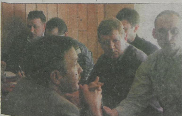
Radni opowiedzieli się za odnową świetlicy w Dąbrowie