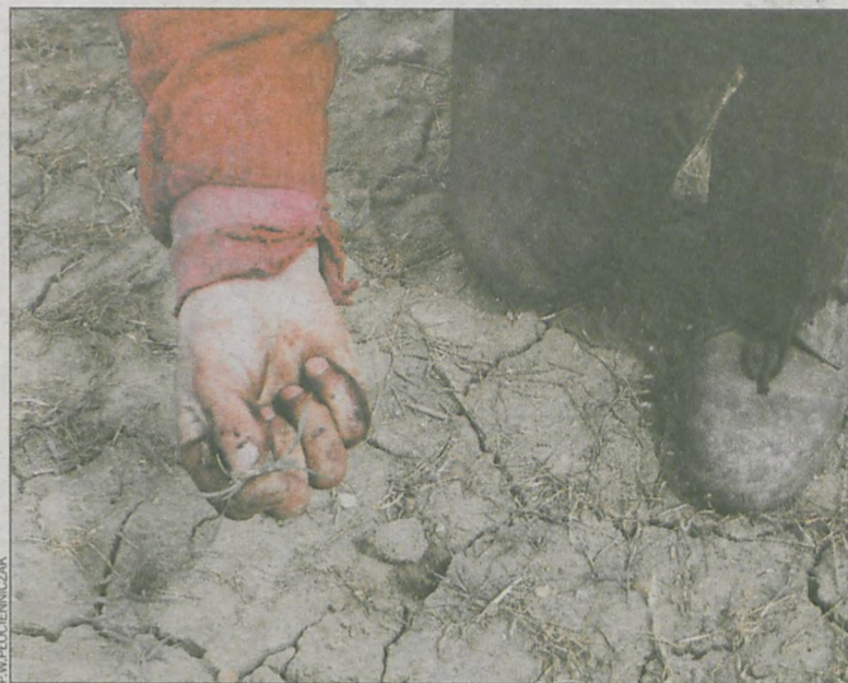
Na polach zboża wymarzło. To zdjęcie zrobiliśmy w okolicach Benic

Rolnicy poszkodowani przez mrozy będą mogli też otrzymać z ARiMR pomoc w postaci niskoprocentowanych tzw. kredytów kłeszkowych. Zasady takiego wsparcia nie zmieniły się. Bardzo istotne jest, że w przypadku wymarznienia upraw oprocentowanie kredytu wyniesie tylko 0,1 proc., jeżeli rolnik zawarł umowę ubezpieczenia obejmującą ochroną co najmniej połowę powierzchni upraw rolnych, z wyłączeniem łąk i pastwisk, lub co najmniej 50 proc. zwierząt gospodarskich. W przypadku braku umowy ubezpieczenia oprocentowanie kredytu będzie wyższe (obecnie wynosi 3,85 proc.). Rada Ministrów zaakceptowała również inne formy pomocy, takie jak możliwość stosowania przez wójtów i burmistrzów ulg w podatku rolnym,