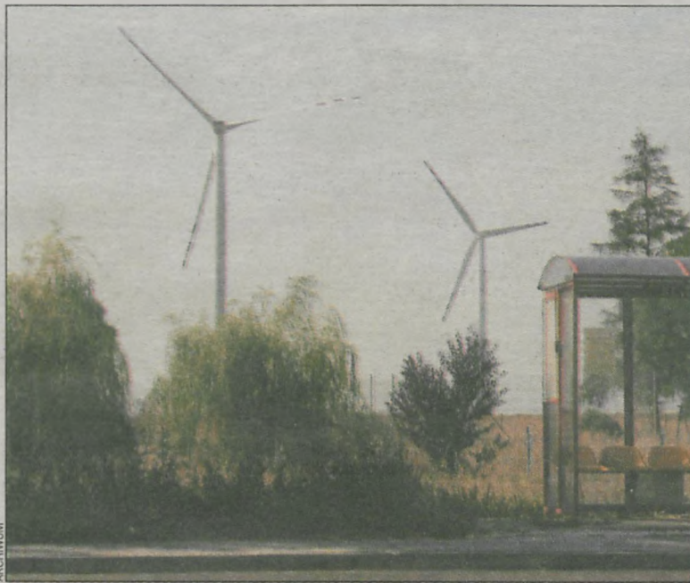
Elektrownie wiatrowe to coraz częstszy widok w krajobrazie