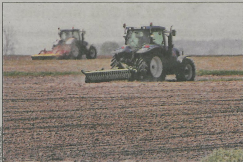
Płatność obszarowa do 1 ha ma wynieść w br. 710,57 zł