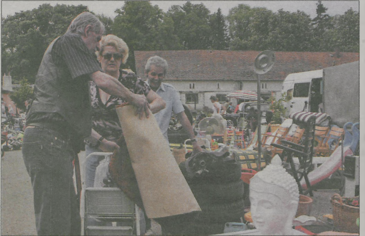
Na bazarze w Baszkowie można kupić wiele używanych rzeczy

Policjanci i strażacy skontrolowali baszkowski bazar – tzw. wystawki i teren wokół niego. Nałożyli 21 mandatów i zatrzymali 3 dowody rejestracyjne.