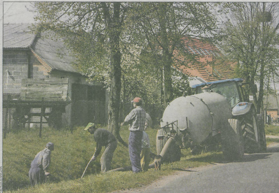
Są pieniądze na wspieranie tworzenia małych firm na wsiach