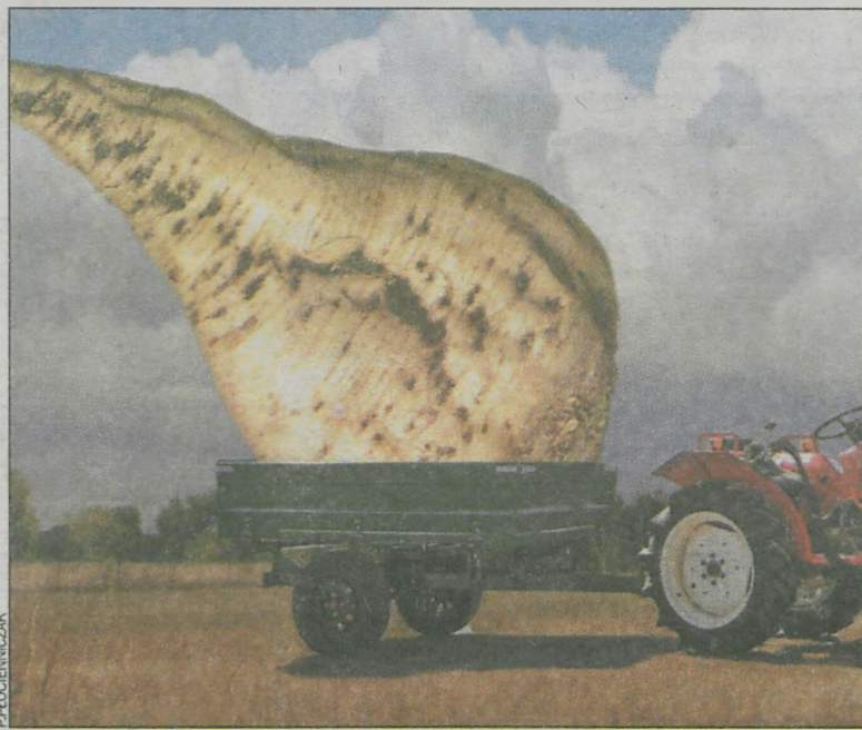
Producenci cukru zobowiązani są podzielić się z plantatorami zyskiem

Rejonowy ZPBC w Zdunach zrzesza około 700 rolników z powiatów: gostyńskiego, kaliskiego, krotoszyńskiego, ostrowskiego oraz pleszewskiego