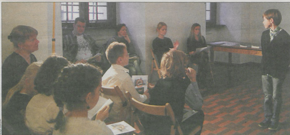
Konkurs odbył się w trzech kategoriach wiekowych