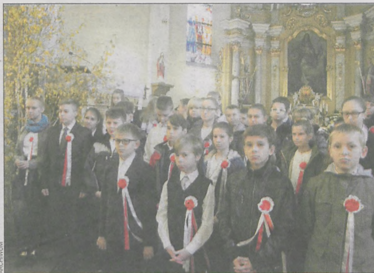
W trakcie programu słowno-muzycznego

W podczas programu przypomniano najważniejsze wydarzenia z okresu zaborów, mówiono także o zasługach jakie dla odradzającej się Rzeczypospolitej mieli Józef Piłsudski, Roman Dmowski, Ignacy Paderewski. Zebrani w kościele wysłuchali fragmentów utworów poetyckich, wzięli udział w koncercie pieśni patriotycznych. Śpiewali je wspólnie z dziećmi. Wśród nich znalazły się takie utwory jak: Pierwsza Brygada, Ułani, ulani, O mój