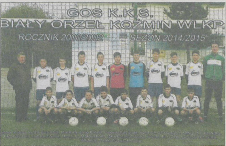
Piłka nożna to ich pasja

Drużyna trampkarzy starszych ze szkółki piłkarskiej Gminnego Ośrodka Sportu w Koźminie zakończyła jesienną rundę sezonu 2014/2015.