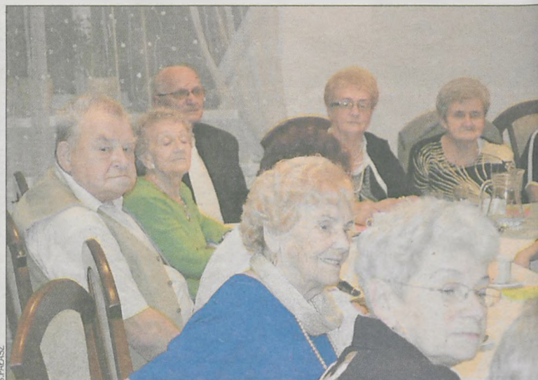
Była okazja do spotkania się i rozmów

Obecnie klub Pogodna Jesień liczy 60 osób. Zdecydowaną większość stanowią panie (52 osoby).