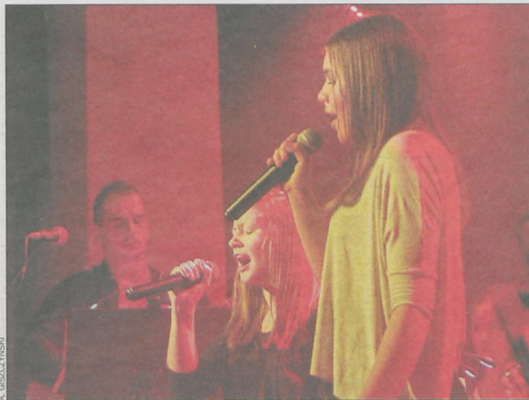
Występ nagrodzono gromkimi oklaskami

pańsku, niemiecku, polsku, portugalsku, rosyjsku, włosku. Tytułową dla całego koncertu Wieżę Babel zaśpiewano z kultowego musicalu Metro. Tytuł koncertu nawiązywał także do biblijnego motywu wieży Babel, gdzie mówiono wieloma językami. Tak samo, jak śpiewano w trakcie występu.