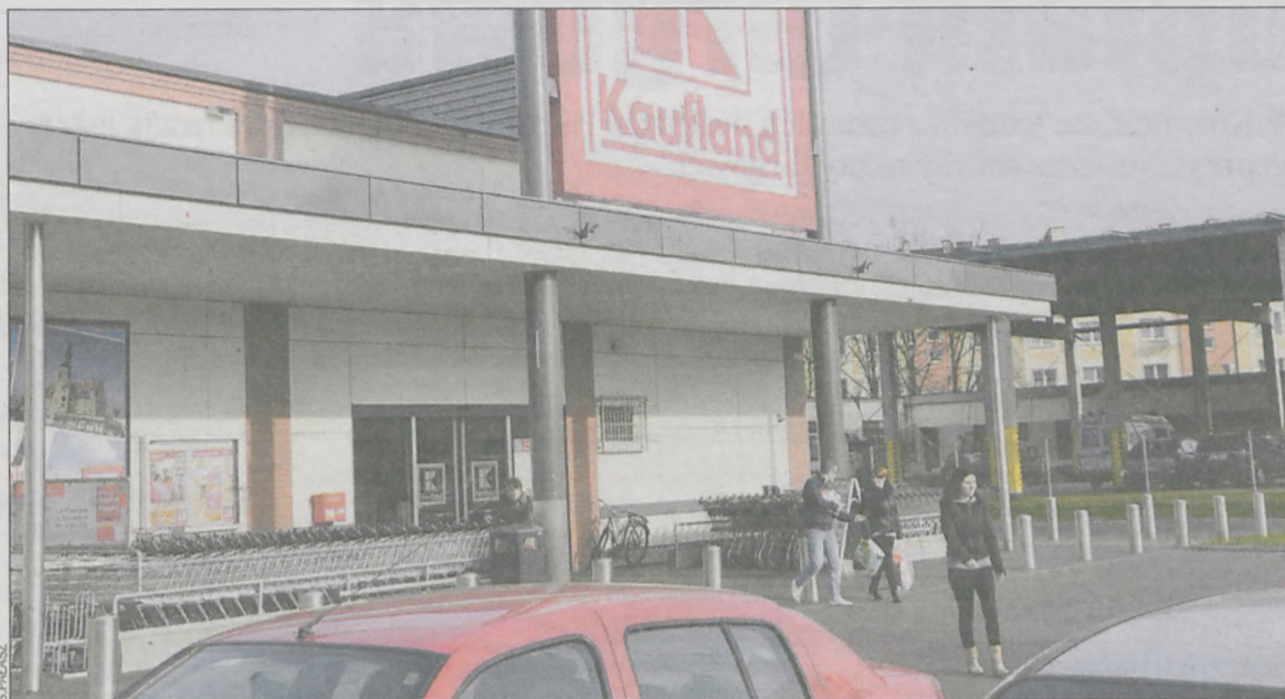
Kaufland był dla wielu osób atrakcyjnym miejscem pracy

Zwolnienia w Kauflandzie. I to zaledwie półtora miesiąca po otwarciu supermarketu tej sieci handlowej w Krotoszynie. Pracę może stracić część spośród ok. 70 pracowników.