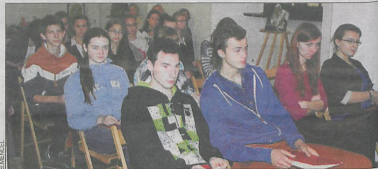
Uczestnicy w sali muzealnej

Gwara wielkopolska to konkurs organizowany przez Zespół Szkół Ponadgimnazjalnych nr 2 w Krotoszynie we współpracy z Muzeum Regionalnym. Od 6 lat cieszy się sporym zaintereso-