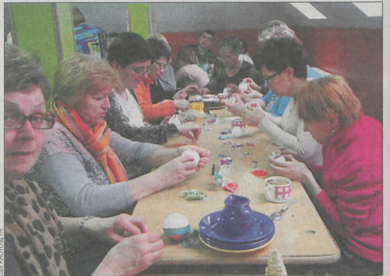
Rodzice również przygotowują drobiazgi na świąteczny kiermasz

W szkole trwa już przygotowywanie świątecznych drobiazków na do- roczny kiermasz na krotoszyńskim rynku. – Sprzedajemy kartki świąteczne zaprojektowane i wykonane przez naszych uczniów, a wydrukowane w za- przyjaźnionych drukarniach. Zawsze jest ogromne zainteresowanie – opowiada dyrektorka. W trakcie otwartych