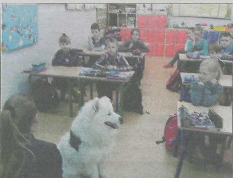
Młody pies Leon zafascynował dzieci