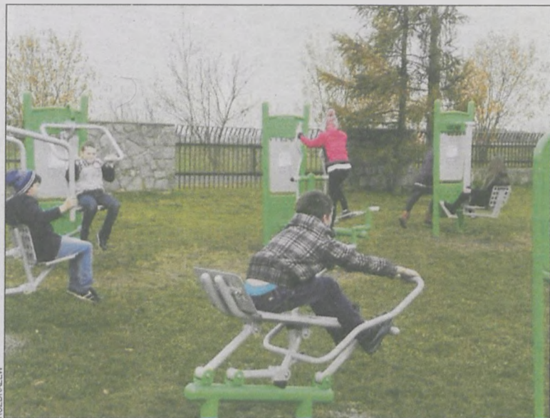
I młodzi, i starsi znajdują tu coś dla siebie