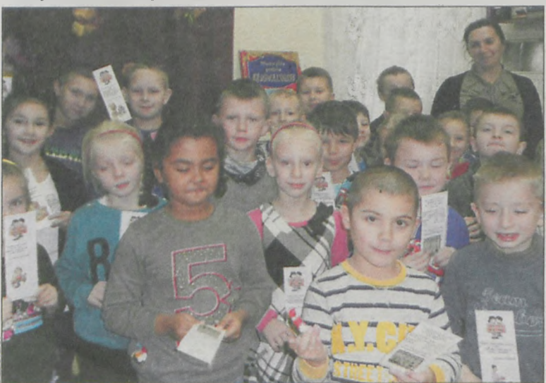
Dzieci zostały pełnoprawnymi czytelnikami