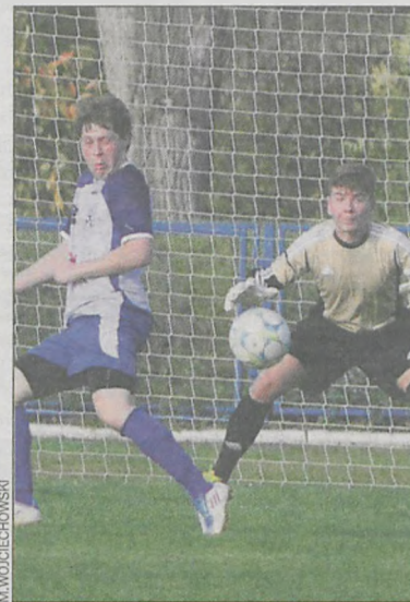
Golkeeper Astry wpuścił 4 gole