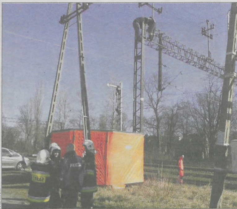
W marcu przy ul. Boreckiej w Koźminie Wlkp. 19-letni mężczyzna wszedł na słup trakcyjny. Wówczas zeskokczył na poduszkę ustawioną przez strażaków

22 listopada ok. godz. 11.00 wezwano pomoc do mężczyzny, który dziwnie się zachowywał. – Stal na balkonie mieszkania na piątym piętrze w samej bieliźnie. W chwili przyjazdu policji, straży pożarnej i pogotowia ratunkowego znajdował się przy barierce – mówi asp. szt. Piotr Szczepaniak z Komendy Policji w Krotoszynie. Policjanci podjęli rozmowę z desperatem. Strażacy rozstawili poduszkę (tzw. skokochron) tuż pod blokiem. Jednocześnie na podnośniku wjechali na balkon policjant i funkcjonariusz straży. Gdy znaleźli się na górze, policjant