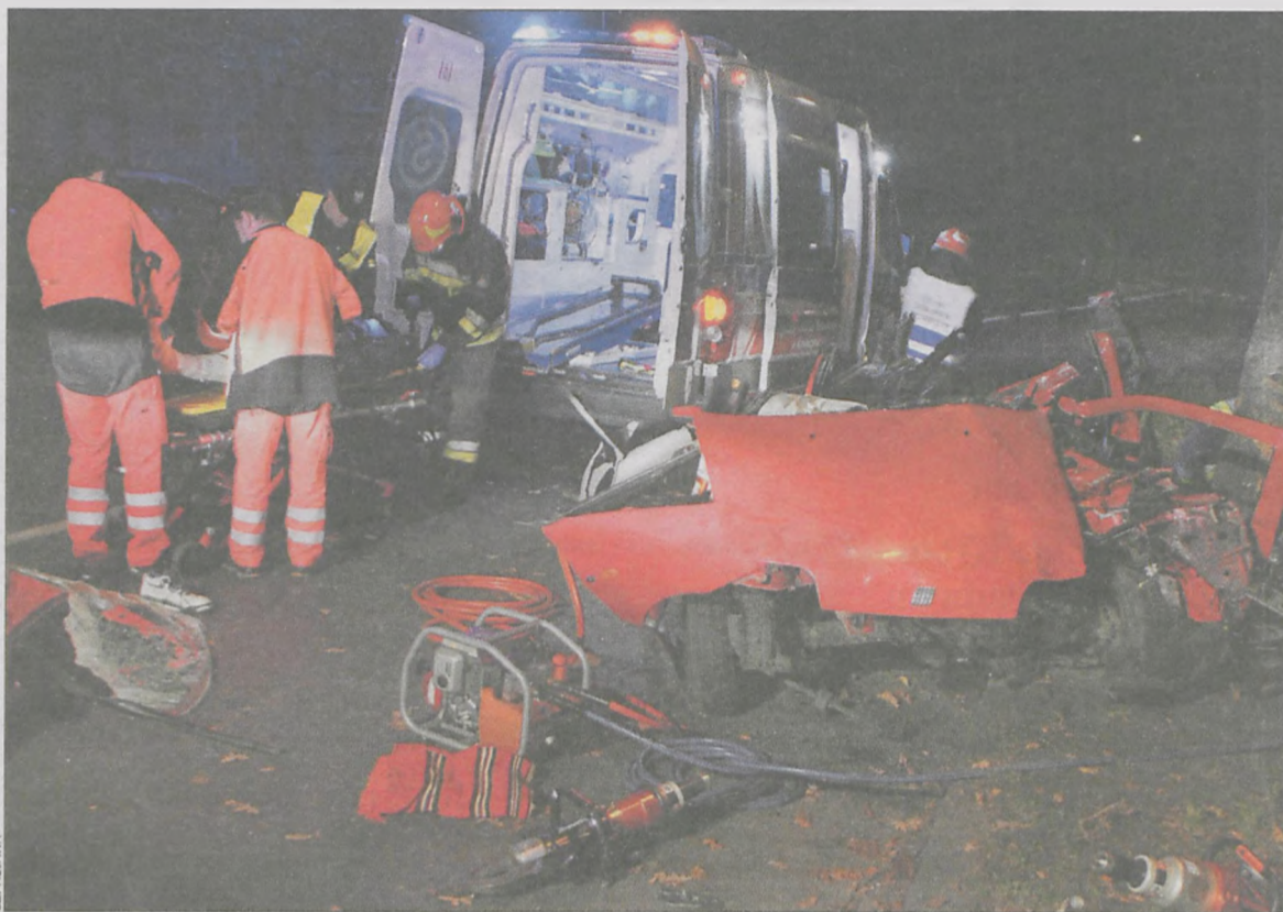
Fiat punto uderzył w przydrożne drzewo

W Krotoszynie, na drodze krajowej nr 36 – pomiędzy skrzyżowaniem z ul. Kobylińską (koło targowiska) a osiedlem bloków – fiat punto jadący z nadmierną prędkością wpadł w poślizg i uderzył w drzewo. 19-letni kierowca miał 0,6 promila alkoholu. Prowadził auto, choć wcześniej stracił prawo jazdy. Pasażer (mieszkaniec Krotoszyna) był także nietrzeźwy – jego wynik to 0,7 promila.