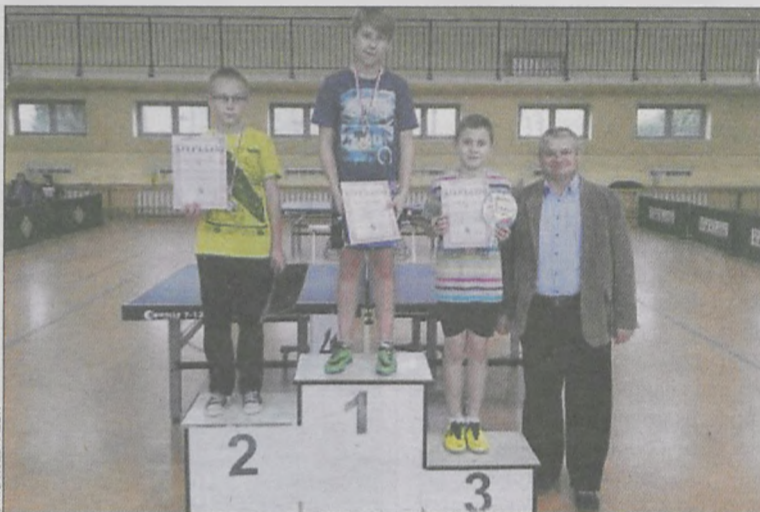
Najmłodzi gracze na podium