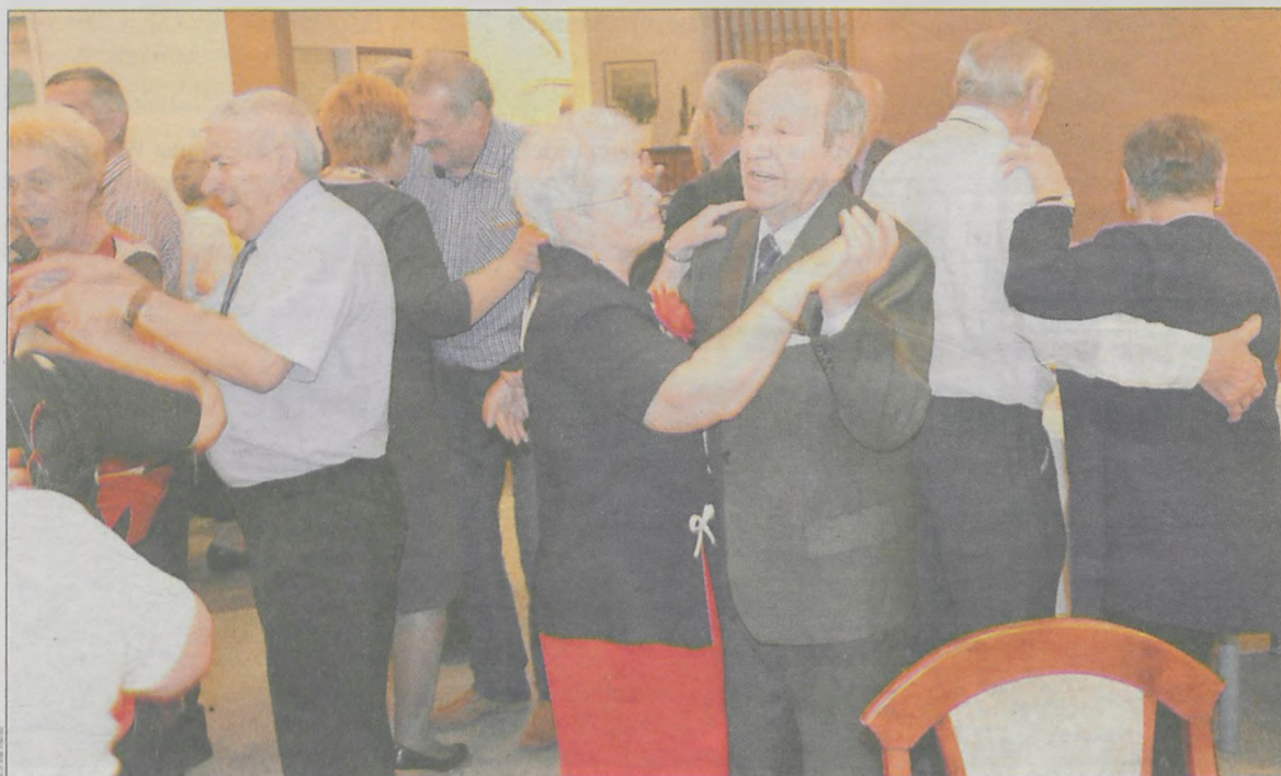
Zabawa była godna jubileuszu

Świca. – Aby do nas przystąpić, trzeba mieć skończone 65 lat oraz być członkiem Krotoszyńskiej Spółdzielni Mieszkaniowej – mówi prezes, która na czele klubu stoi od 15 lat. Za swoją działalność otrzymała Złotą Odznakę Honorową Polskiego Związku Emerytów, Rencistów i Inwalidów.