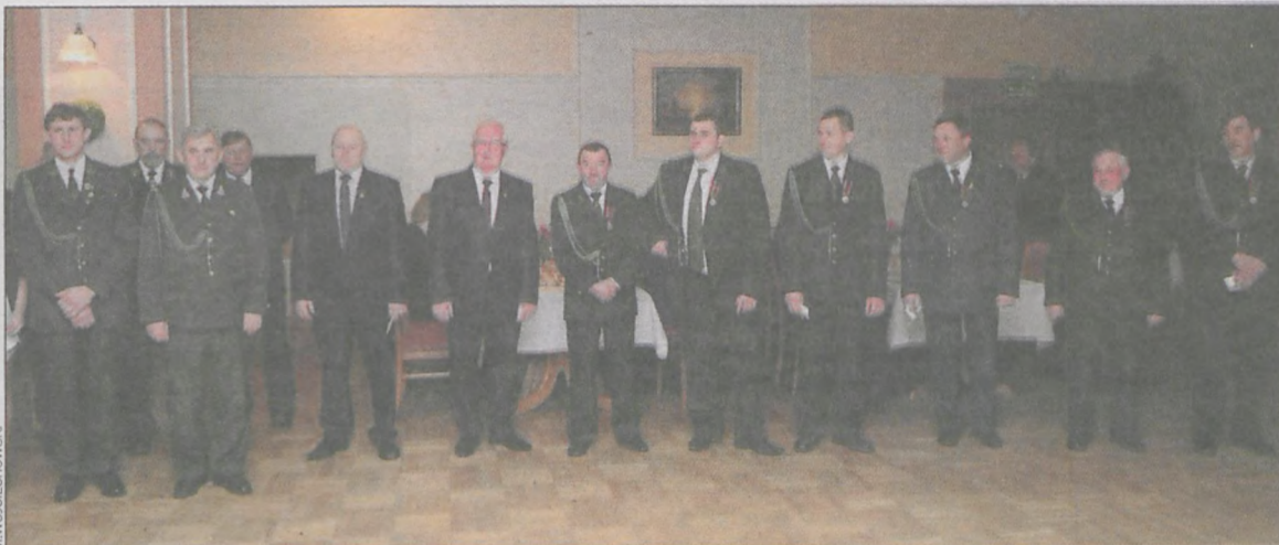
Odznaczone osoby na uroczystości w Krotoszu

Dwa tygodnie wcześniej myśliwi spotkali się na polowaniu, które było wstępem do oficjalnego świętowania 65-lecia Kuropatwy, założonej 20 listopada 1949 r. Kulminacyjnym punktem obchodów była uroczysta msza św. w sanktuarium w Lutogniewie, koncelebrowana