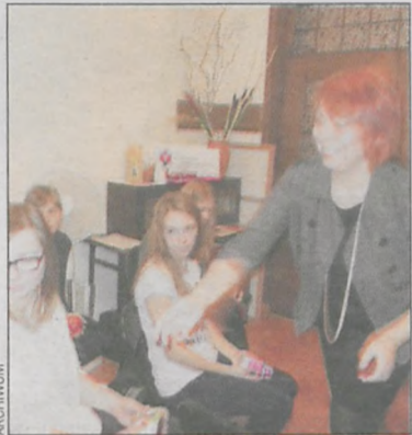
Prowadząca zajęcia z łatwością zaintrygowała młodzież tematem