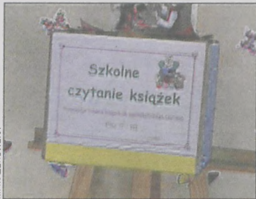
Do skrzynki dzieci wrzucają tytuły książek