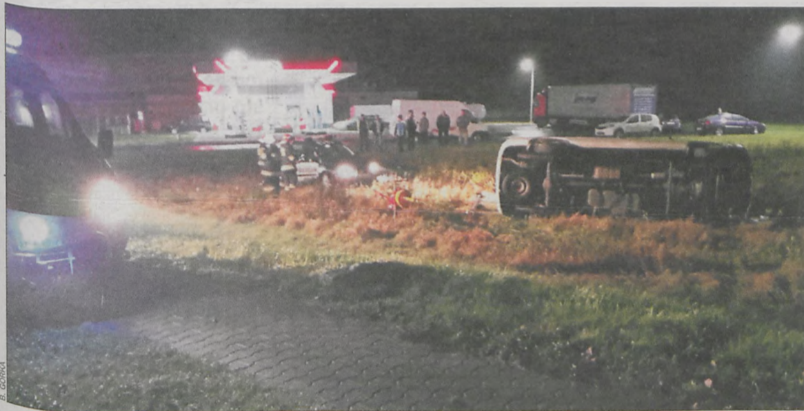
Pojazd leżał na poboczu za stacją paliw na drodze wylotowej ze Zdun do Cieszkowa

18 listopada wieczorem na ulicy Wrocławskiej w Zdunach, prawdopodobnie z powodu zbyt dużej prędkości, bus wypadł z drogi i przewrócił się na bok. Samochodem jechali mężczyzna i kobieta.