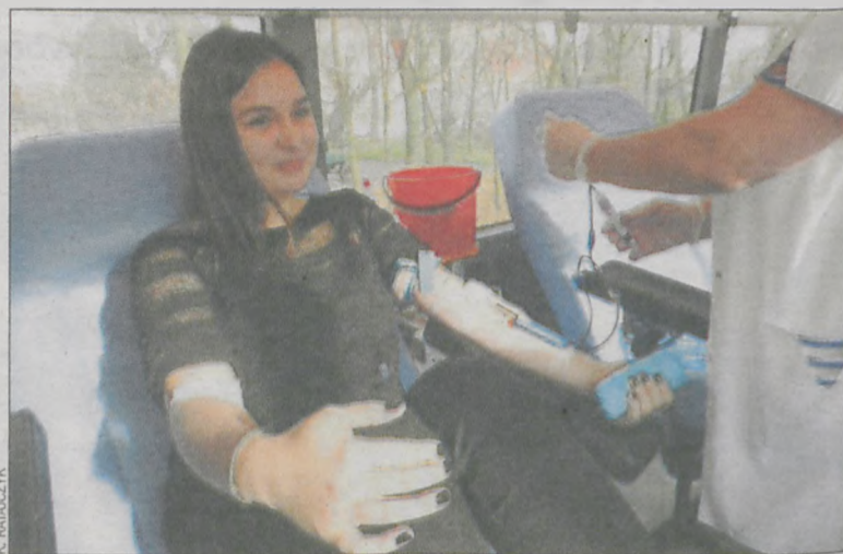
Uczniowie ZSP z wielkim entuzjazmem włączyli się do akcji

W ciągu 4 godzin zarejestrowano 59 kandydatów. 40 z nich oddało krew. Na frekwencję największy wpływ mieli uczniowie szkoły z koźmińskiego zamku. Zarejestrowało się ich aż 45, jednak nie wszyscy mogli oddać bezcenny płyn. Podczas akcji zebrano 17,53 l krwi. (It)