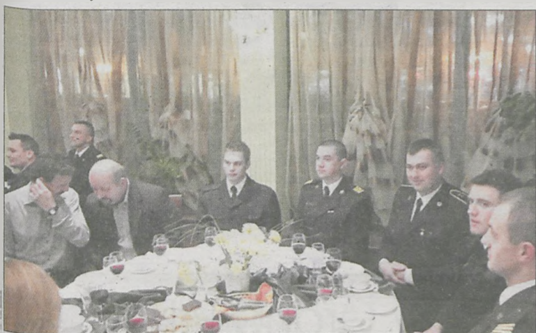
Strażacy z krotoszyńskiej jednostki oddali w tym roku rekordową ilość krwi