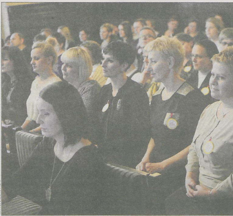
Uczestnicy święta w sali reprezentacyjnej

21 listopada w sali reprezentacyjnej krotoszyńskiego ratusza odbyła się uroczystość z okazji Dnia Pracownika Socjalnego. Podsumowano na nim 15 lat pracy powiatowych instytucji pomocy społecznej.