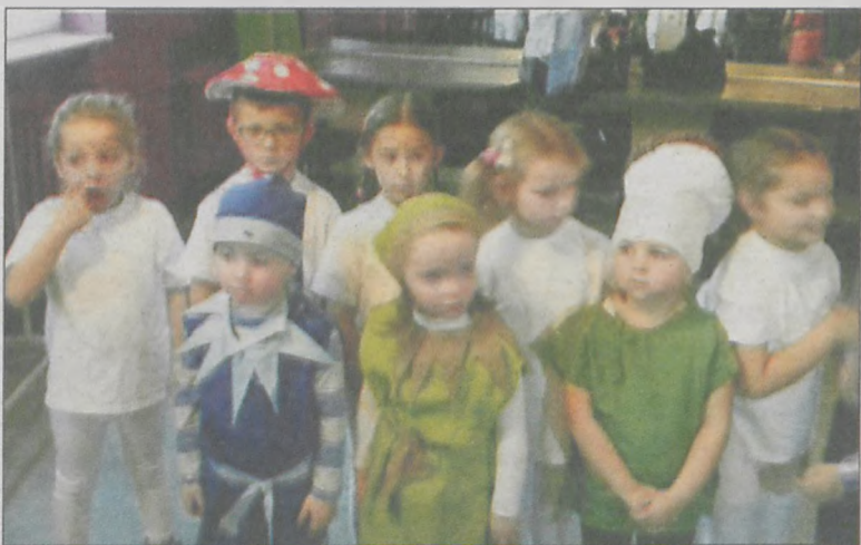
Przedшкоlaki z Borzęcizek tuż przed występem na scenie

Przedшкоlna grupa teatralna Wesołe Ludki z Zespołu Szkolno-Przedшкоlnego im. Marii Konopnickiej w Borzęcizkach po raz kolejny wzięła udział w konkursie teatralnym, którego tematem przewodnim była ekologia.