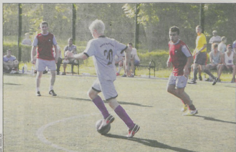
Wszystkie mecze stały na wysokim poziomie

Eliminacje miały miejsce 8 kwietnia w Koźminie Wlkp. i Krotoszynie. Z półfinału koźmińskiego do dalszej fazy awansowały drużyny Zespołu Szkół Zawodowych z Kobylina oraz Zespołu Szkół Ponadgimnazjalnych z Koźmina. W Krotoszynie awans wywalczyli piłkarze z I LO oraz Zespołu Szkół Ponadgimnazjalnych nr 3.