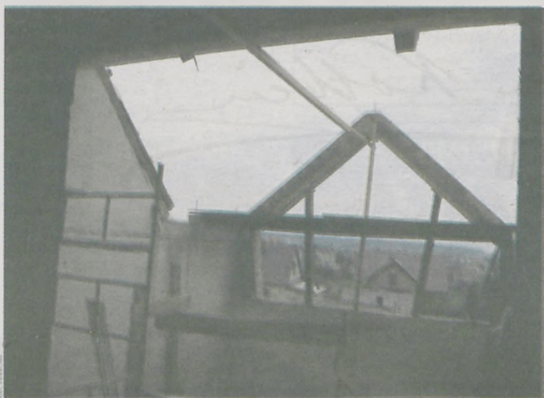
Biblioteka przechodzi prawdziwą metamorfozę