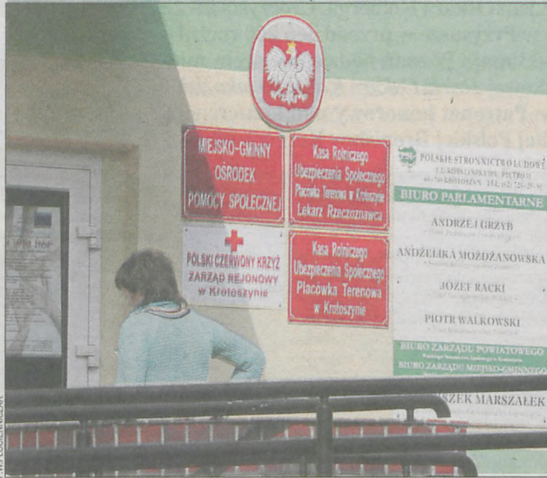
Zdaniem naszej rozmówczyni ośrodkowi zabrakło przed świętami zrozumienia dla osób korzystających z zasiłków

Zdaniem kobiety taka sytuacja nie powinna mieć miejsca, a panie pracujące w krotoszyńskim MGOPS winny zrozumieć, że święta to szczególny okres i pieniądze są wtedy lu-