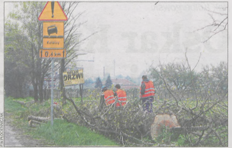
Wiele osób zapewne ucieszy brak przydrożnych drzew