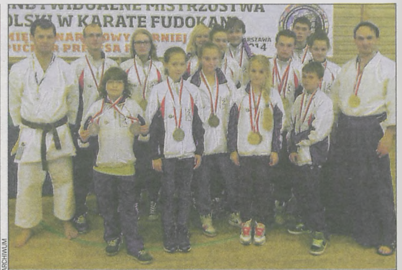
Zawodnicy Shodana prezentują medalowy dorobek z warszawskiej imprezy