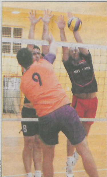
AT-WitCars wygrało 3:0 z Ochmannem