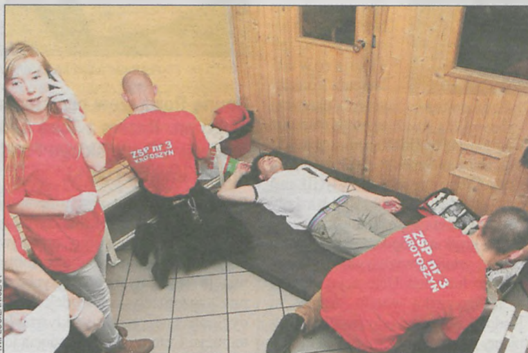
Najbardziej widowiskowe były ćwiczenia udzielania pierwszej pomocy