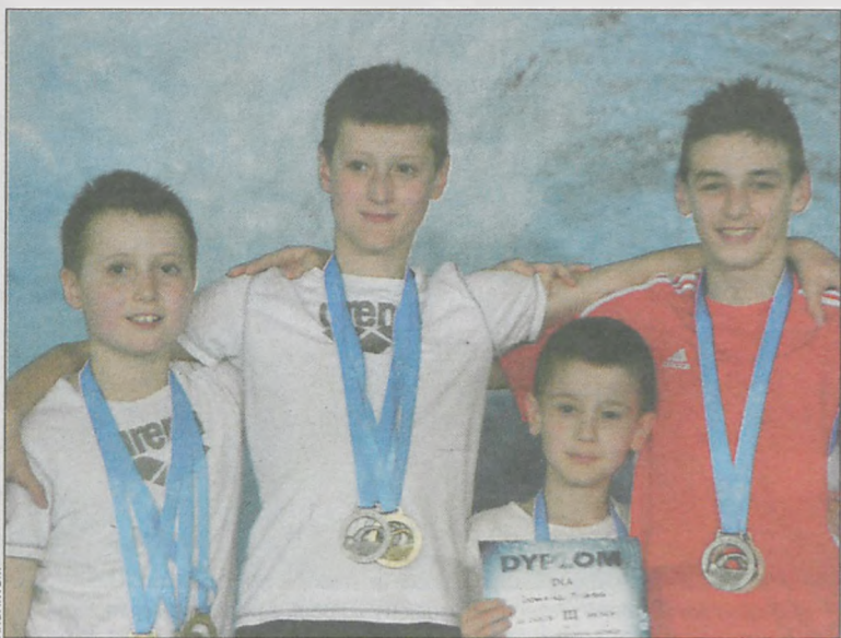
Nasi zawodnicy nie ukrywali zadowolenia