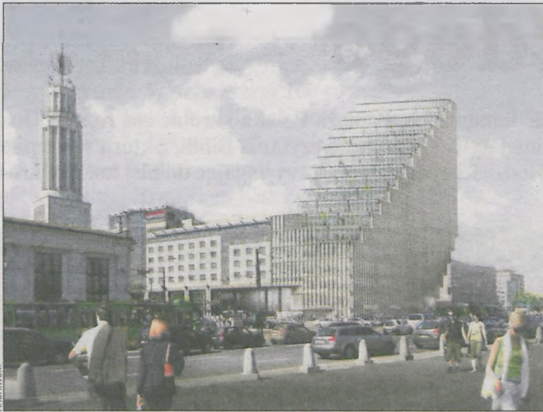
Tak ma wyglądać nowy poznański Bałtyk