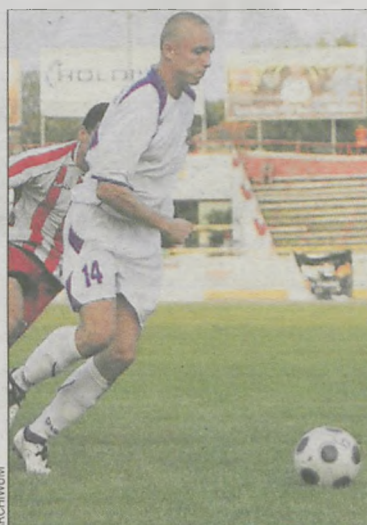
Biały Orzeł nie potrafił znaleźć recepty na pokonanie przeciwnika