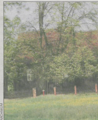
Sala powstanie na placu przy kościele

dzie więc idealna na urządzenie małej uroczystości rodzinnej, takiej jak komunія czy chrzciny. Będzie także służyć mieszkańcom do zebrań i spotkań. – Myślę, że obiekt, jaki powstaje w Serafinowie, będzie w sam raz. W małych