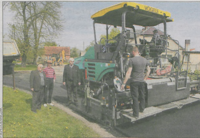
Nowa nawierzchnia kosztowała 79 tys. zł