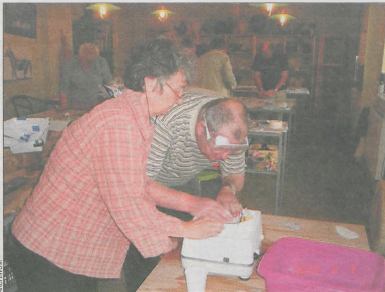
Podczas zajęć każdy chętny nabywa nowych doświadczeń

Gmina Rozdrażew przystąpiła do realizacji projektu systemowego pn. Razem z Tobą będę Sobą, współfinansowanego ze środków Europejskiego Funduszu Społecznego w ramach programu Kapitał Ludzki.