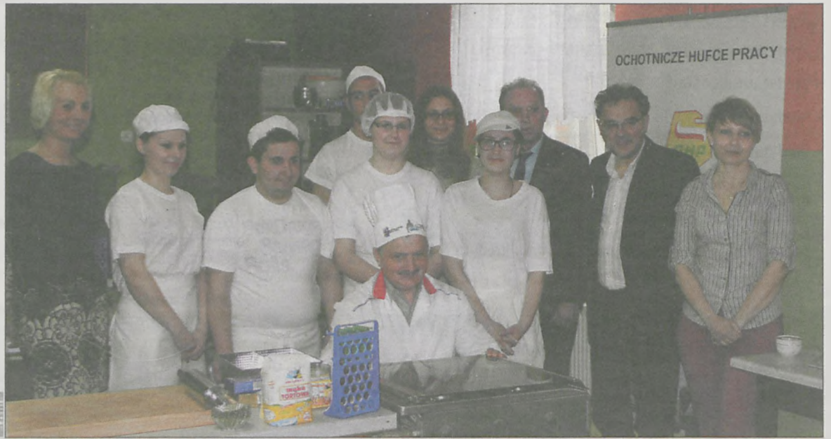
Uczestnikom przez cały czas dopisywały dobre humory