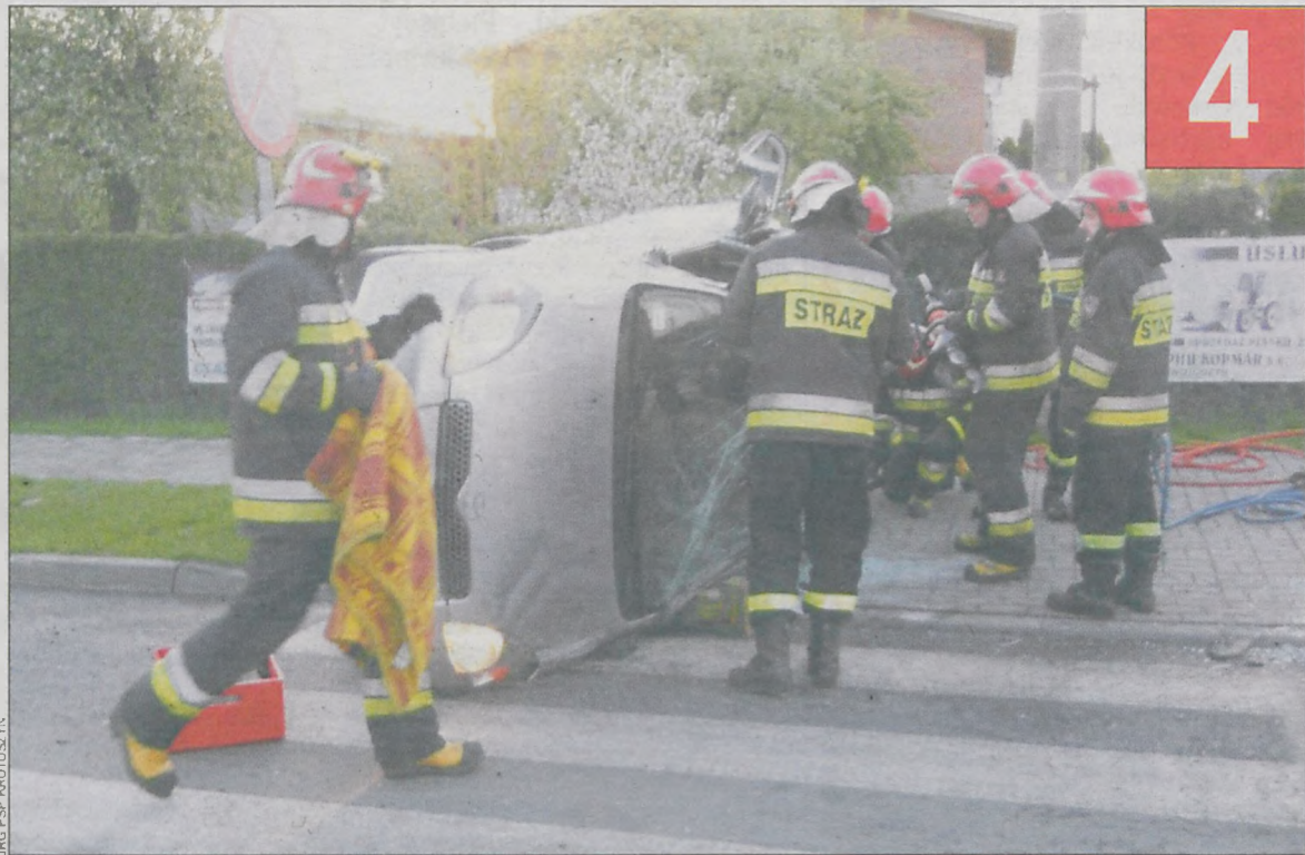
Siła uderzenia była tak duża, że toyota przewróciła się na bok

Cztery osoby trafiły do szpitala po wypadku, do którego doszło 25 kwietnia wczesnym rankiem na ul. Grudzielskiego w Krotoszynie. Kierowca BMW wymusił pierwszeństwo przejazdu na prawidłowo jadącej toyocie yaris.