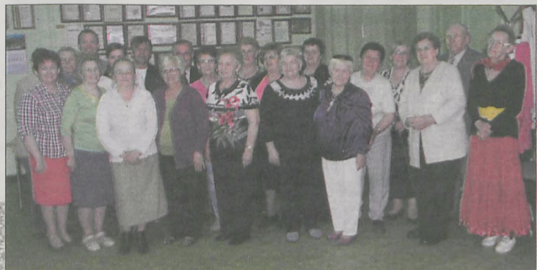
Podczas spotkania zrobiono pamiątkową fotkę