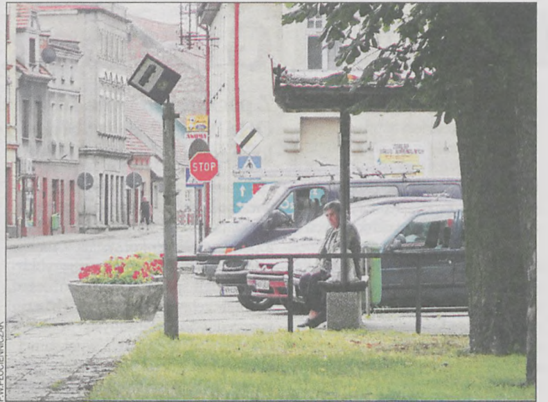
Mieszkańcy mają do dyspozycji tylko trzy poranne kursy do Krotoszyna