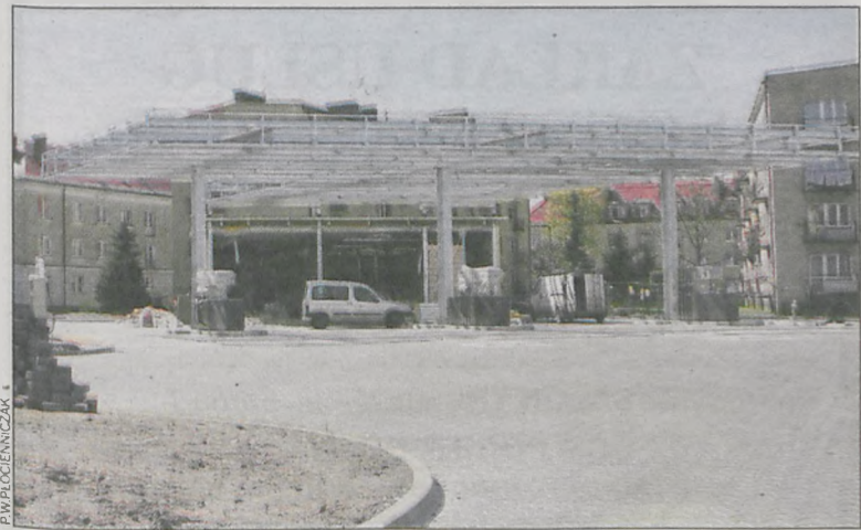
Roboty zaczęły się w drugiej połowie 2013 r.

dzie negatywnie wpływało na mieszkańców pobliskich bloków. – Nawozi się tam bardzo dużo ziemi. Czy pod-