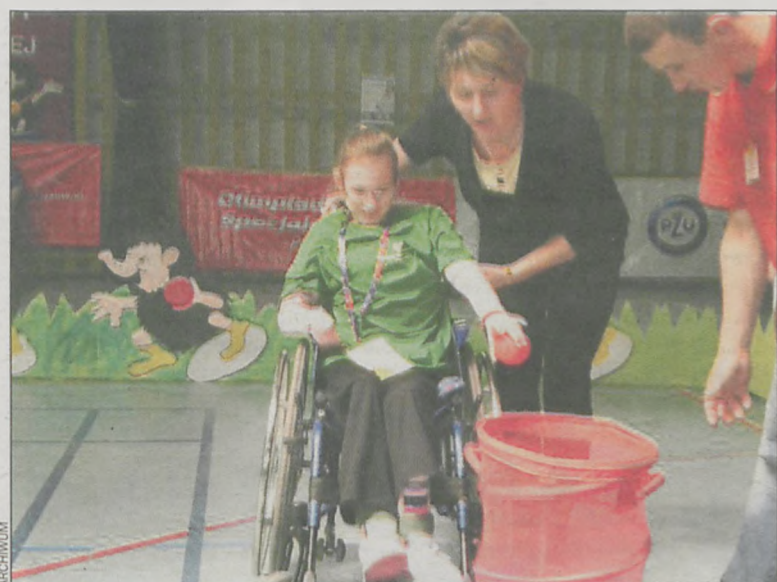
Zawodnicy wykonują różne zadania wspólnie z terapeutą

3 kwietnia zawodnicy z Klubu Olimpiad Specjalnych, działającego w Specjalnym Ośrodku Szkolno-Wychowawczym w Borzęciczkach, uczestniczyli w XI Regionalnym Dniu Treningowym Programu Aktywności Motorycznej Olimpiad Specjalnych w Koninie.