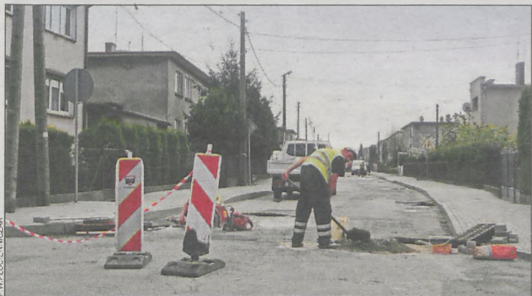
Pracownicy firmy nie próżniają i prace wykonują już od zeszłego czwartku