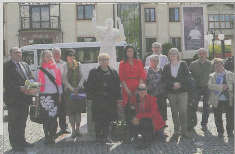
Uczestnicy wyjazdu do Torunia