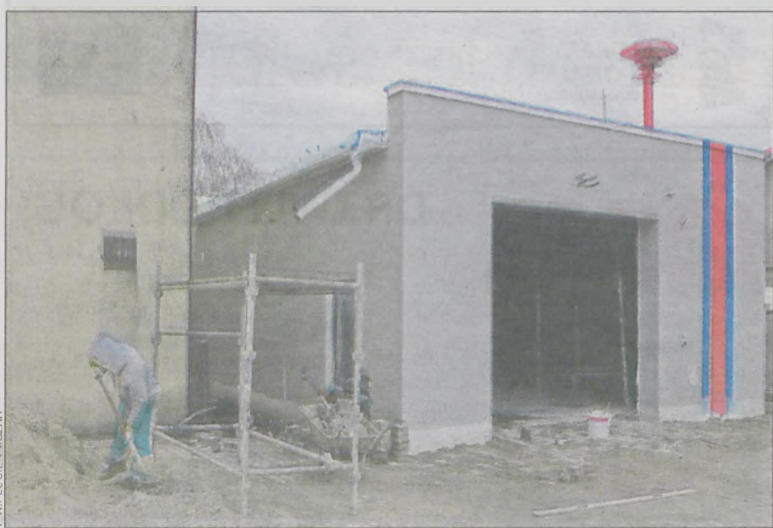
Prace budowlane wykonał zakład z Wilkowyi za niecałe 70 tys. zł

W ubiegłym tygodniu zakończyła się rozbudowa budynku garażowego OSP w Różopolu. Inwestycja została zrealizowana w ciągu zaledwie 5 tygodni.