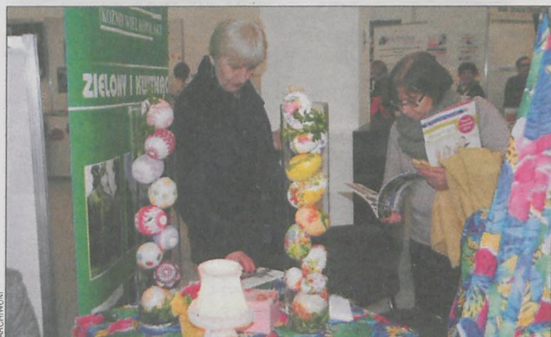
Stoisko przygotowane przez koźmiński Klub Seniora cieszyło się bardzo dużym zainteresowaniem