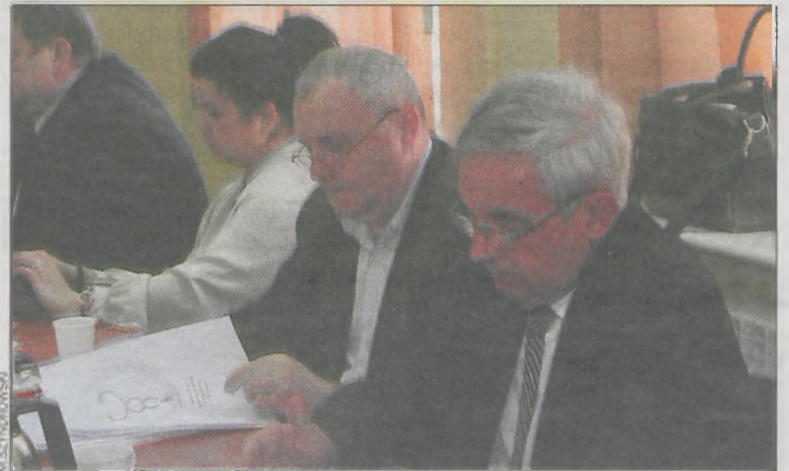
Radni większością głosów zaaprobowali obniżenie opłaty