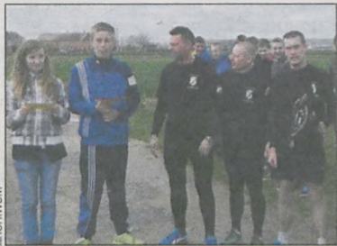
Powitanie biegaczy na ul. Kaliskiej