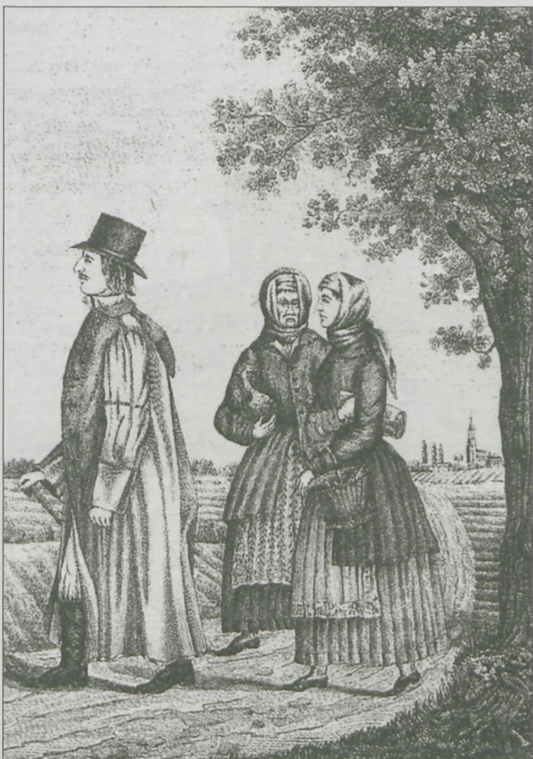
Rycina przedstawiająca mieszkańców Krotoszyzna w XIX w.