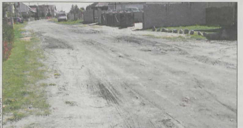
Ograniczenie tonażu ma zapobiec dalszej dewastacji tej drogi