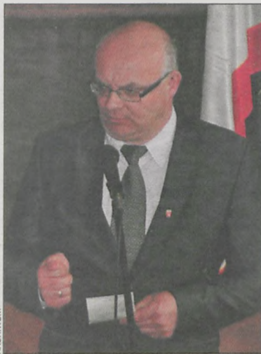
„Plan inwestycji zostaje” – mówił wójt

W budżecie ujęto rezerwę ogólną w wysokości 100 tys. zł oraz rezerwę kryzysową w wysokości 31 tys. zł. Wszystkie zaplanowane inwestycyjne pozostają, z tą różnicą, że będą realizowane w ciągu dwóch lat. Chodzi zwłaszcza o cztery inwestycje sztandarowe, na które gmina otrzymała dofinansowanie unijne, czyli: rewitalizację centrum wsi Trzebicko, zabytkowego parku w Cieszkowie, budowę świetlicy w Ujeździe oraz rozbudowę ściany wspinaczkowej w cieszkowskiej hali sportowej. Kontynuowana będzie także modernizacja świetlic wiejskich. – Podobnie jak w roku ubiegłym, gmina dostanie o 40 tys. zł mniejszą subwencję oświatową, a tym samym musimy zmniejszyć wydatki na jednostki oświatowe. SP w Cieszkowie otrzyma o 21 tys. zł mniej, SP w Pakosławsku – ponad 9 tys. zł mniej, a cieszkowskie gimnazjum – 14 tys. zł mniej. W sumie na