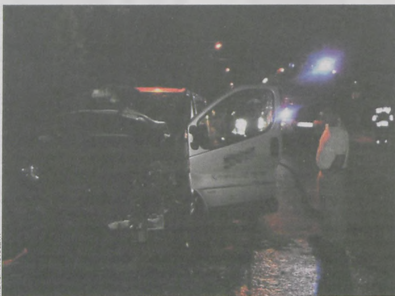
W opłu ogień pojawił się pod maską

W sobotę 19 kwietnia ok. godz. 21.00 miał doszło do pożaru samochodu Opel Vivaro na ul. Półwiejskiej w Krotoszynie. To już piąte tego typu zdarzenie w tym roku.