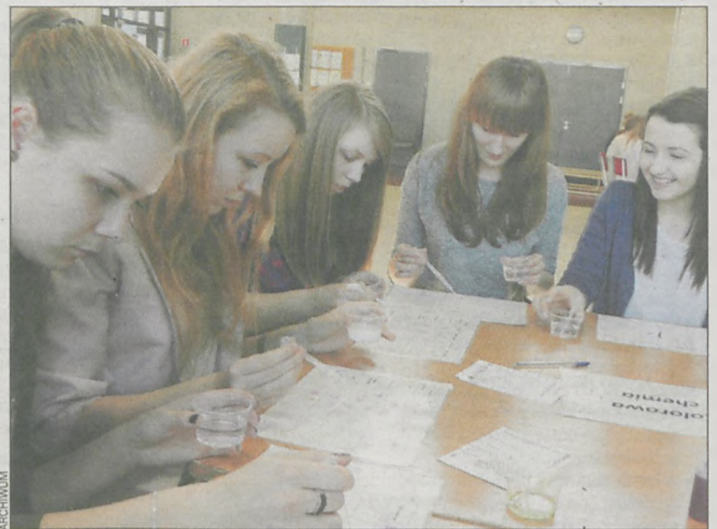
Podczas pikniku było i ciekawie, i wesoło

Warsztaty pn. Matematyczne rozmaitości, Kolorowa chemia, Magne-