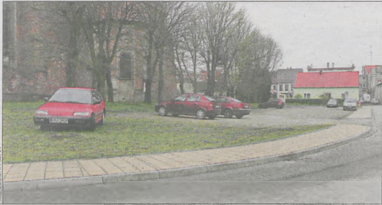
Najpierw powstaną parkingi na ul. Wałowej i Kościelnej

Gmina zamierza jeszcze w tym roku rozwiązać problem parkowania w Kobylinie. Rozwiązaniem mają być dwa nowe parkingi – na ulicy Wałowej i alei Powstańców Wlkp.