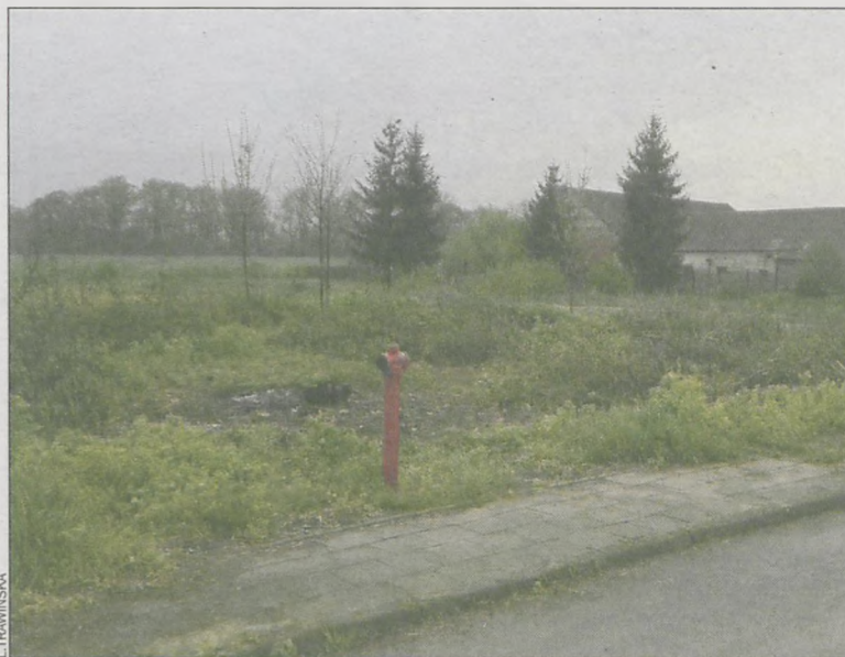
To w tym miejscu powstanie grzybek służący rekreacji

25 kwietnia odbył się koncert z cyklu Co potrafi przedszkolaczek w wykonaniu dzieci z przedszkola Parkowe Skrzaty.