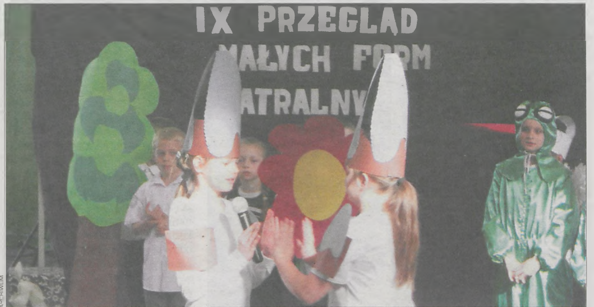
Mali aktorzy wystąpili w bajecznie kolorowych strojach

Impreza współfinansowana była przez gminę Krotoszyn w ramach otwartego konkursu ofert. Została zorganizowana przez Stowarzyszenie Przyjaciół Szkoły na Błoniu oraz Zespół Szkół nr 2 z Oddziałami Integracyjnymi. (szyn)