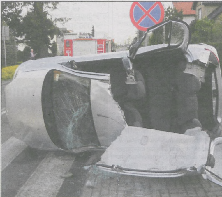
Toyota była przewrócona na bok. To szczęście, że nic poważniejszego się nie stało

25 kwietnia wczesnym rankiem na ul. Grudzielskiego w Krotoszynie doszło do zderzenia dwóch aut osobowych. Cztery osoby przewieziono do szpitala.