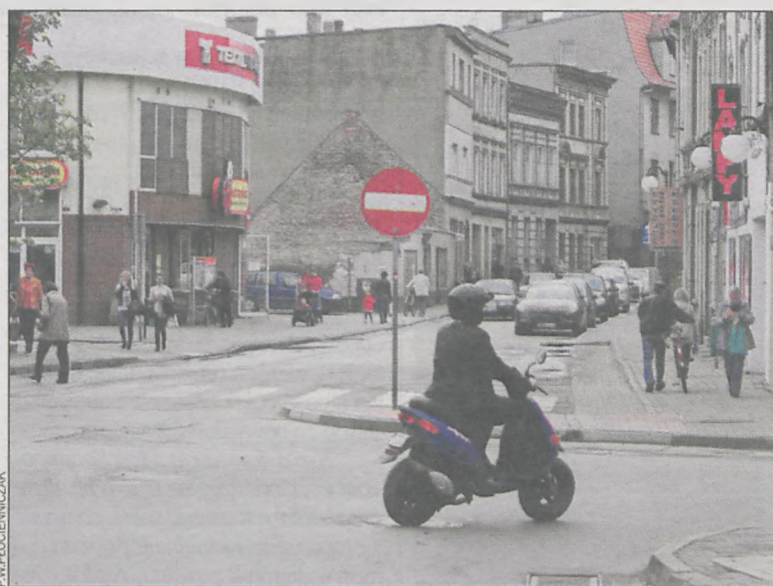
Zmiana związana jest z budową hali sportowej w ZS nr 3