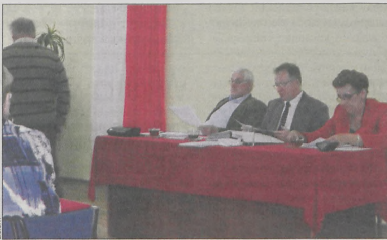
Na sesji jednogłośnie przegłosowano podwyżkę

Decyzje zapadły na sesji Rady Miejskiej 25 października. Radni ustalili, że podatek od gruntów związanych z prowadzeniem działalności gospodarczej ma wynieść 80 gr za 1 metr kwadratowy. Podatek od gruntów pod jeziora i zbiorniki wodne ma wynosić 4,56 zł za hektar, a od pozostałych gruntów – 28 gr za 1 metr kwadratowy. Nowy podatek od budynków mieszkalnych to 71 gr za 1 m kw., od budynków związanych z prowadzeniem działalności gospodarczej – 19,50 zł za 1 m kw., od związanych z prowadzeniem działalności gospodarczej w zakresie obrotu materiałami siewnymi – 10,75 zł za 1 m kw, z udzielaniem świadczeń zdrowotnych – 4,68 zł za 1 m kw., od pozosta-