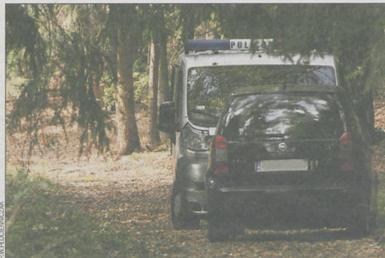
Mężczyzna wybrał się na przejażdżkę rowerem, z której nie wrócił

W minioną środę rano przypadkowy człowiek znalazł w lesie na Salni pod Krotoszynem zwłoki Ireneusza Durczyńskiego, byłego wieloletniego naczelnika Urzędu Skarbowego w Krotoszynie.