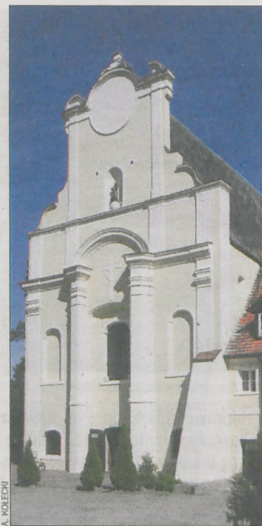
Wejście zachodnie do kościoła Franciszkanów w Kobylinie

Byli związani z naszą ziemią, ale żyli i pracowali z dala od niej. Wspominamy ich tak samo chętnie, jak tych, o których pisaliśmy przed tygodniem w tekście Zapisani w pamięci .