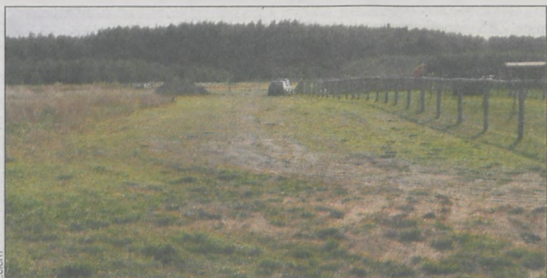
Na ul. Bursztynowej jest 14 niezabudowanych działek

Nazwę nadano 25 października na sesji. W wyniku głosowania, czteremastoma głosami za i przy jednym przeciwnym (Zdzisław Malec), droga nr 1075/1 została ul. Bursztynową.