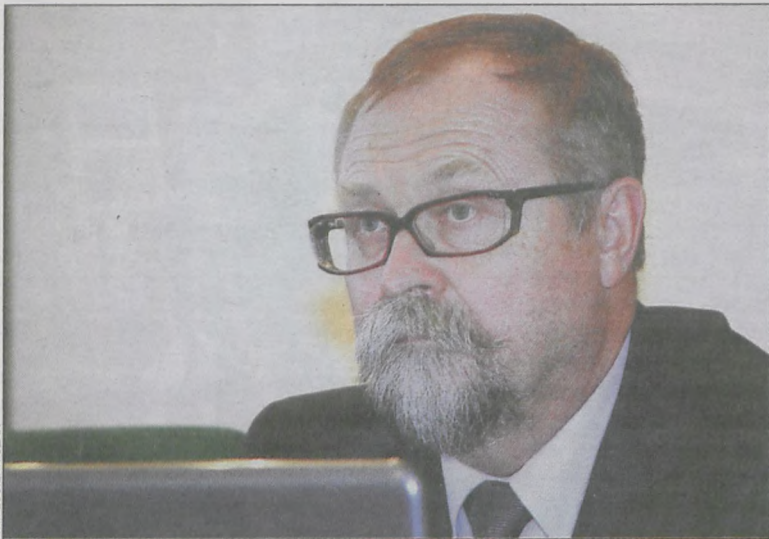
Zorganizował kilkadziesiąt obozów wędrownych dla młodzieży