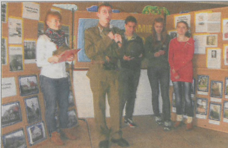
Uczniowie przedstawiali zasłużonych mieszkańców Zdun