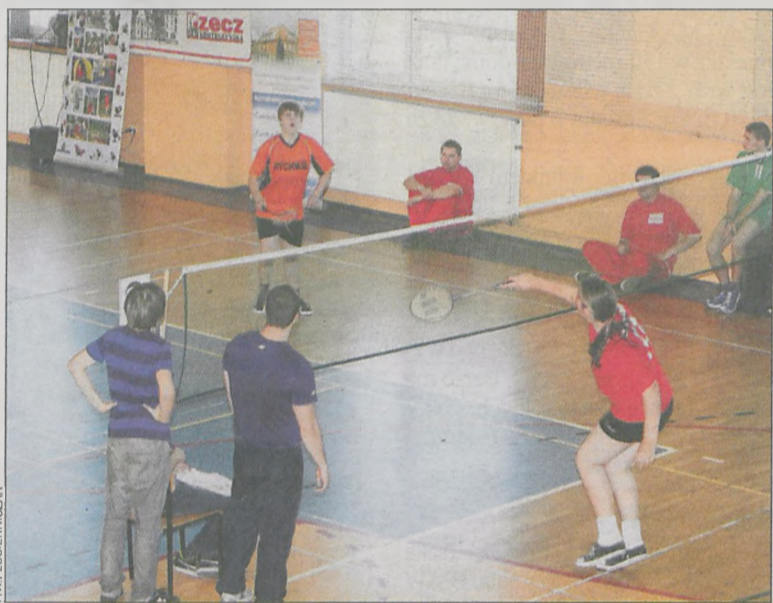
Rywalizowano na czterech boiskach