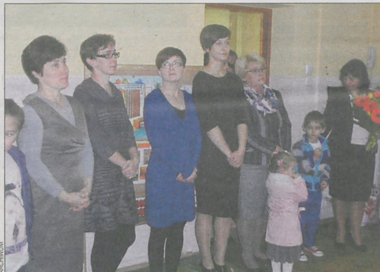
Na uroczystości byli obecni rodzice, dzieci i przyjaciele placówki