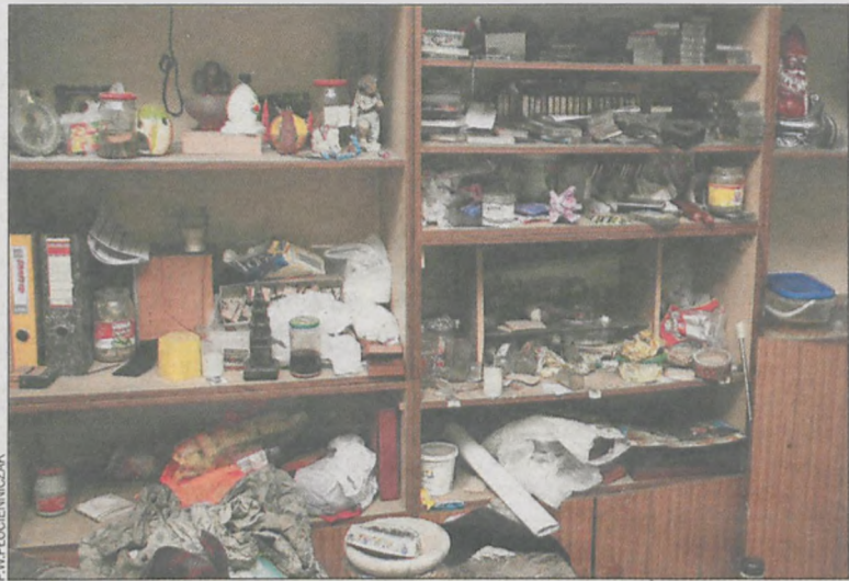
W mieszkaniu panuje straszny bałagan

Eksploatowany mężczyzna na moich oczach wynosi wiaderko z odchodami. Mieszkanie cuchnie stęchlizną i moczem. Pokój jest zawalony kawałkami mebli, drewnianymi płytami i kartona-