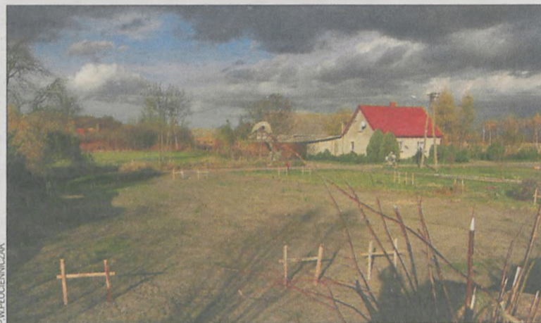
W Starkówcu wyznaczono teren pod nową świetlicę