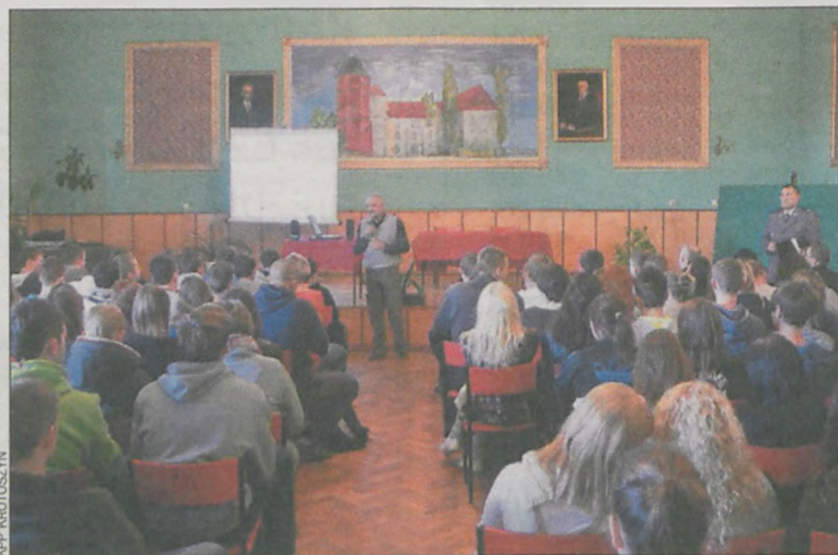
W konferencjach wzięło udział kilkuset młodych osób

W spotkaniach w Koźminie Wlkp. oraz Krotoszynie wzięło udział około 600 uczniów. Tematyka konferencji wpisuje się w realizowany na terenie powiatu krotoszyńskiego od 2003 r. program Bezpieczny powiat krotoszyński.