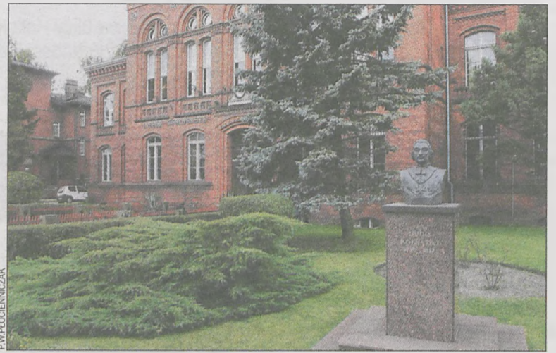
Na I LO głosowało 43,4 proc. osób

W związku z tym KOL-med zaprasza pacjentów obciążonych chorobami układu krążenia i serca oraz przewlekłymi chorobami układu oddechowego, szczególnie osoby palące papierosy. Zapisywać można się osobiście w przychodni, można też telefonować pod numer 62 721 01 98. Co ważne, nie potrzeba skierowania od lekarza rodzinnego. (popi)