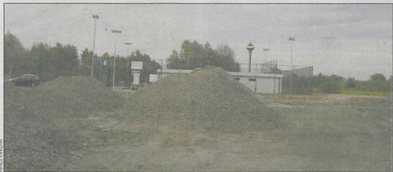
Obiekt powstanie przy kompleksie Orlik

Grzybek ma zostać wybudowany do 15 lutego 2014 roku. (popi)