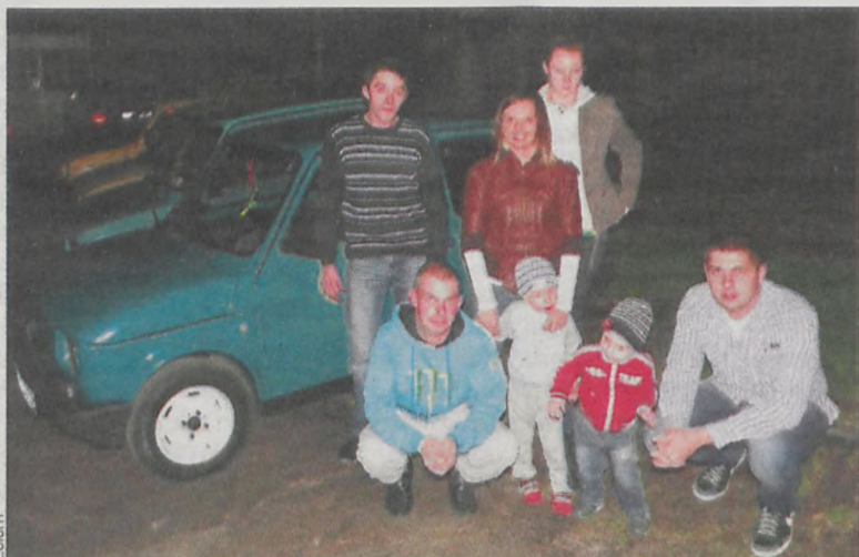
Fanclub „malucha” powiększa się