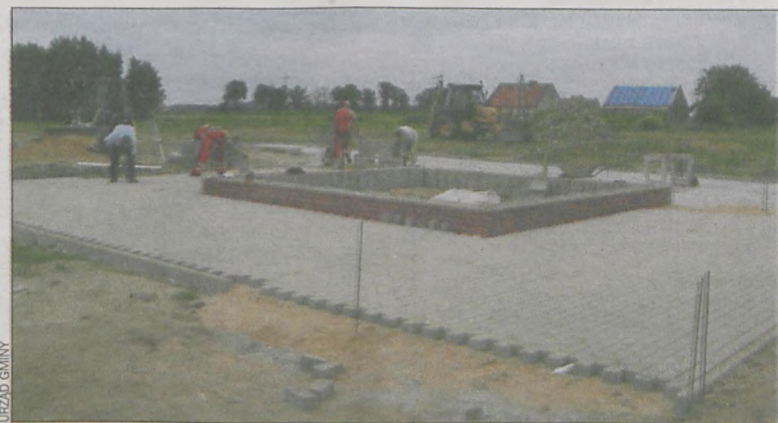
Prace związane z utwardzaniem terenu dobiegają końca

To jednak nie koniec zamiarów gminy wobec Skoraszewic. W planie rozwoju na lata 2011 – 2020 jest wiele innych rzeczy. W pierwszej kolejności chcieliby założyć park z alejkami, fontanną i parkiem linowym. Mieszkańcy czekają też na plac zabaw dla dzieci z lodowiskiem na zimę i deskorolkowym torem przeszkód. Jeśli chodzi o świetlicę, przydałoby się jej lepsze uakustycznienie oraz powołanie sekcji bilardowej. Wielu mieszkańców Skoraszewic życzy sobie również lepszego oznakowania dróg, wytyczenia i oznakowania ścieżek rowerowych oraz rewalidacji strzelnicy. (tytus)