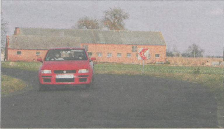
Niektóre znaki, jak ten za Henrykowem, są już mocno zniszczone

Mieszkańcy gminy Rozdrażew narzekają na zbyt słabe oznakowanie łuków dróg.