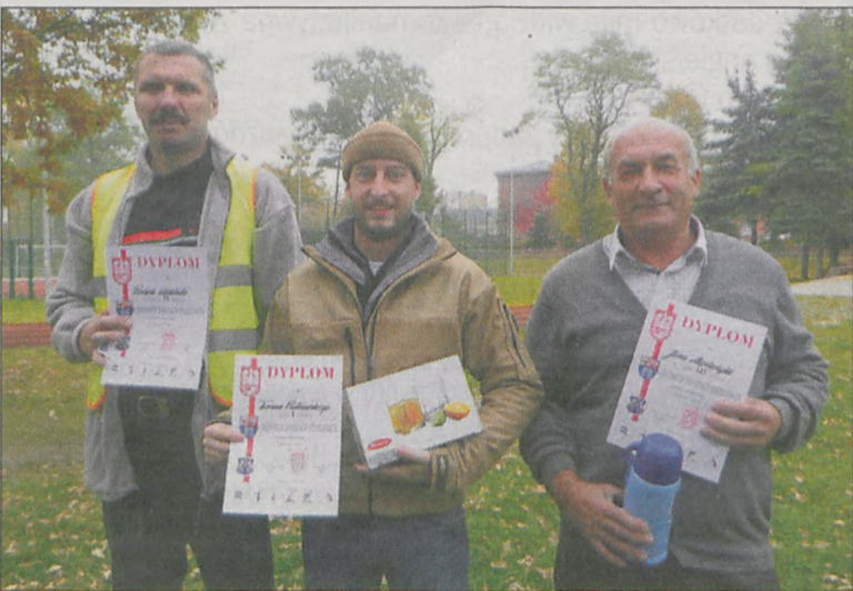
Najlepsi seniorzy z nagrodami