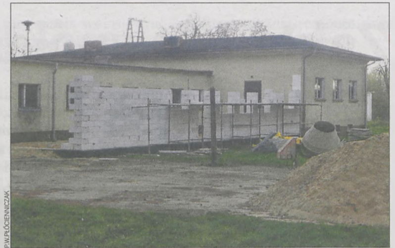
W Zalesiu dobudowano dodatkową ścianę

– Dość dużo wody się tutaj zbiera i potrzebne było odwodnienie gruntu. Pracownicy już opanowali ten problem i chcą zacząć prace budowlane w tym miesiącu. Pogoda sprzyja, więc fundamenty powinny szybko stanąć – mówi jeden z mieszkańców Starkówca.