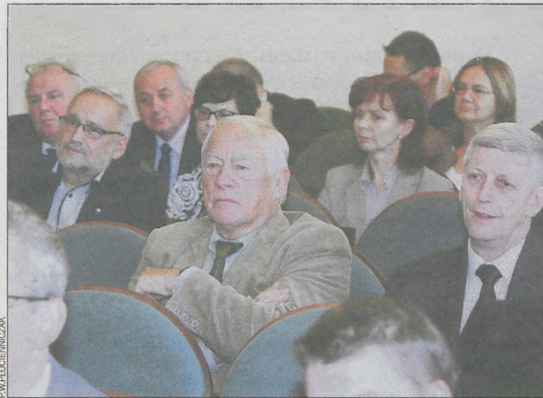
Sprawozdania na temat oświaty wysłuchało sporo osób

25 października na sesji rady powiatu naczelnik wydziału oświaty podsumowała nabór na rok szkolny 2013/14. Jak się okazało, przyjęto o 54 uczniów mniej niż w roku poprzednim.