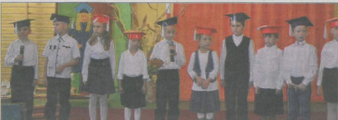
To był bardzo ważny dzień dla uczniów i nauczycieli