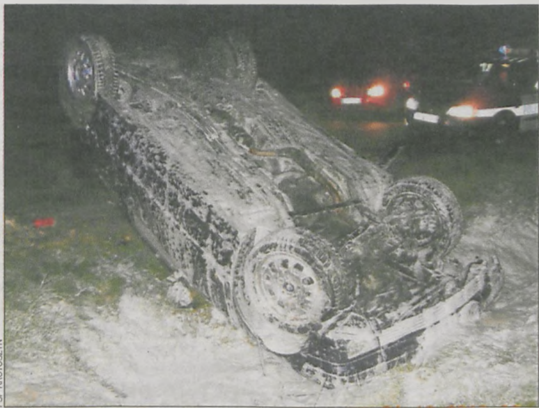
Pijany krotoszyńszanin najpierw uderzył w przystanek, a następnie dachując znalazł się w rowie

W nocy 31 października na drodze w Nowym Folwarku kierujący autem marki BMW zjechał na pobocze i uderzył w przystanek. Zarówno on, jak i pasażer trafili do krotoszyńskiego szpitala. Ich zdrowiu już nic nie zagraża. Okazuje się jednak, że kierujący był nietrzeźwy.