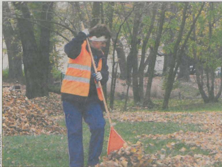
Pracownicy spółdzielni będą m.in. dbali o zieleni miejską