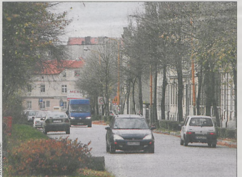
Aleja Powstańców Wlkp. ma przejść na własność miasta w nowym roku