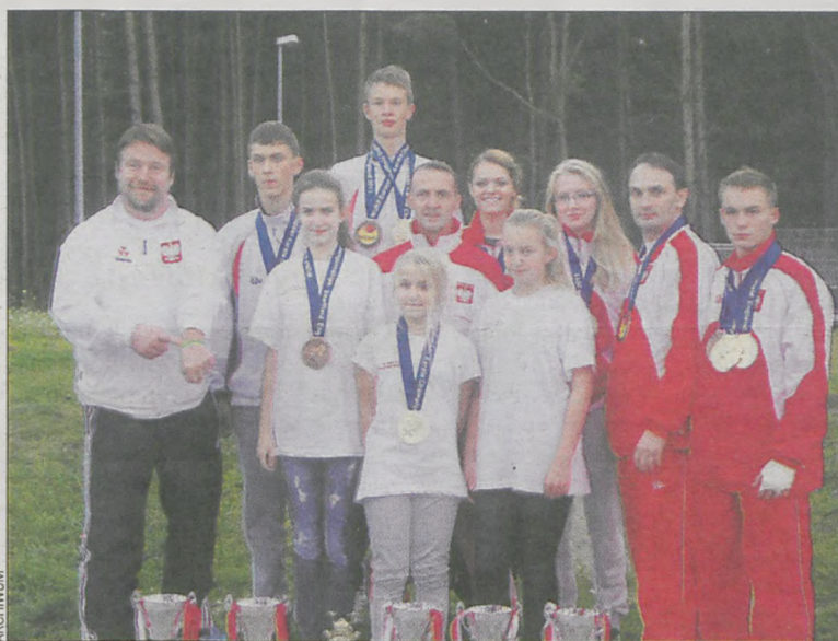
Dla UKS „Shodan” rok 2013 był pasmem sukcesów

zdołali w sumie 11 medali, w tym aż 6 w kolorze złota. W kumite (walki) zasady były bardzo rygorystyczne. Przegrana oznaczała wypadnięcie z dalszej gry.