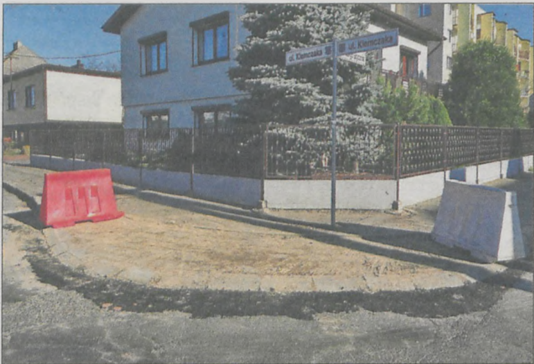
Interwencja władz pomogła. Powiat podjął się naprawy krawężnika