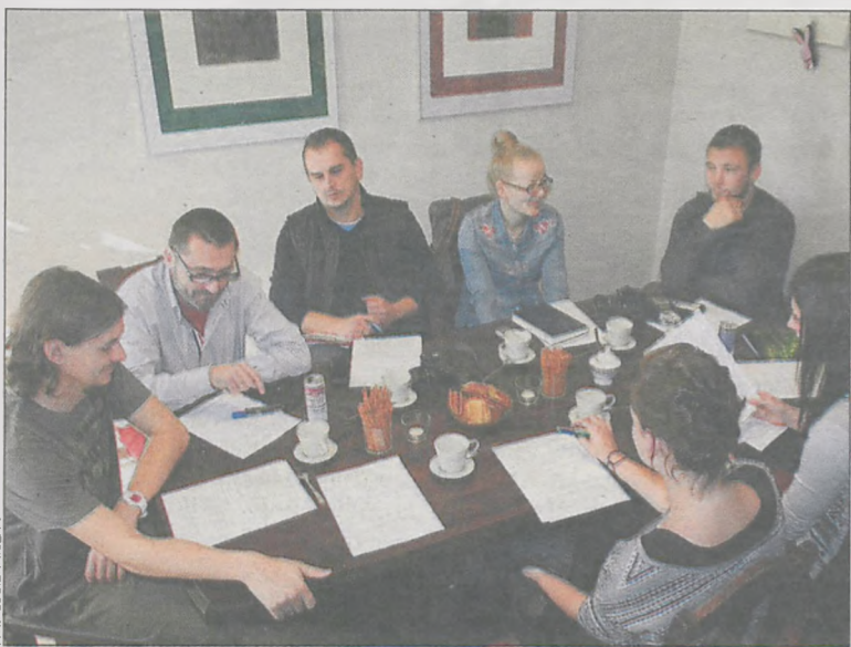
Wyniki plebiscytu ogłoszono podczas briefingu prasowego