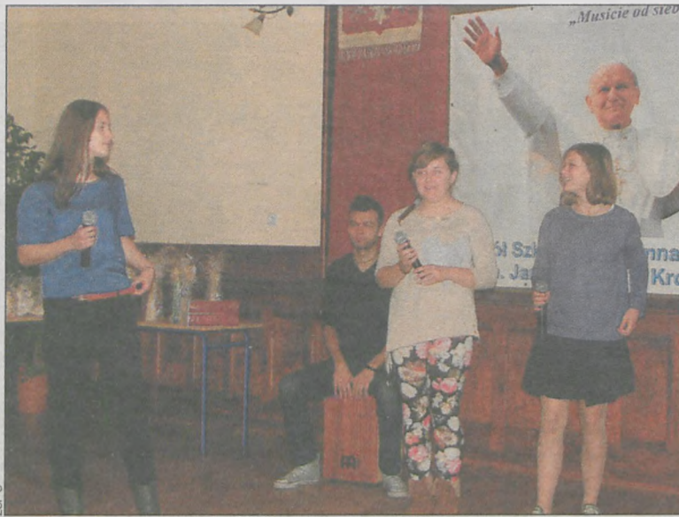
Występy wokalne w auli I LO w Krotoszynie