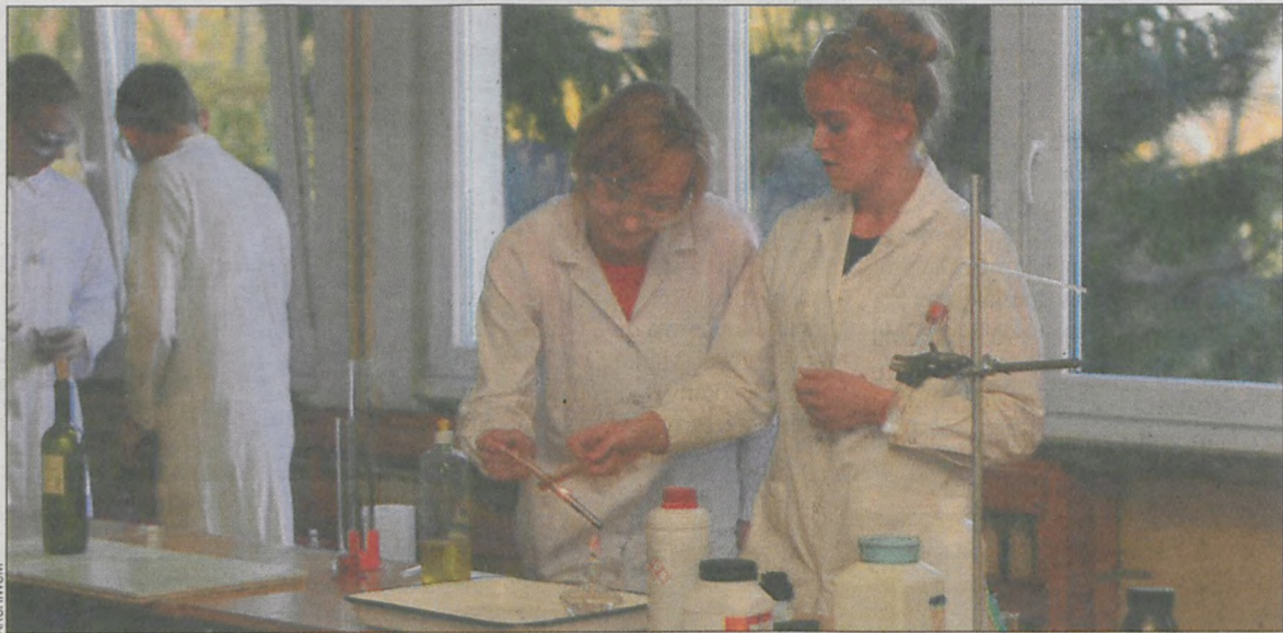
Pokaz przygotowali technicy analitycy