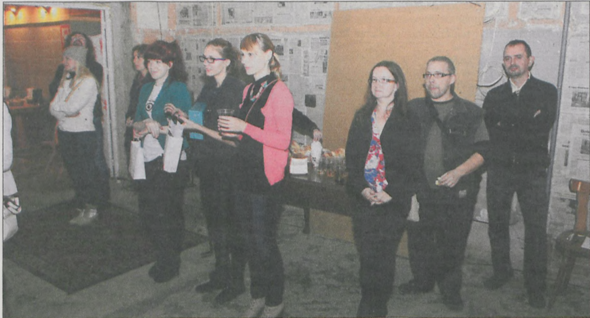
Galeria daje szansę sprawdzenia się każdemu, kto para się fotografią

pokazało kilkudziesięciu fotografów i fotoamatorów. Poziom artystyczny ekspozycji można ostrożnie zdefiniować, jako bardzo zróżnicowany. Pojawily się wyrafinowane kompozycje Marcina Pawlika, eksperymentalne foto-ekspozycje Tomasza Serafiniaka czy w końcu żywiołowe fotografie Zuzanny Nadziei, która zresztą dostała główną nagrodę za najlepsze prace na wystawie.