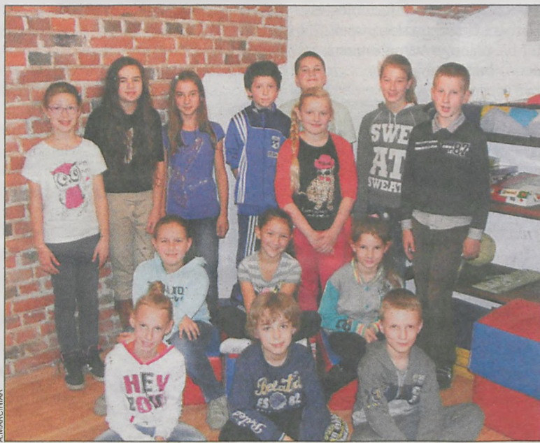
Krotoszyńskie dzieci biorące udział w projekcie podzielono na dwie grupy wiekowe