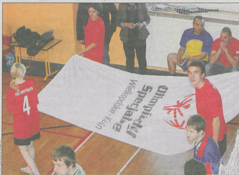
Zawodnicy wnieśli flagę Olimpiad Specjalnych

– Było pewne, że impreza przyciągnie rzeszę sportowców z różnych