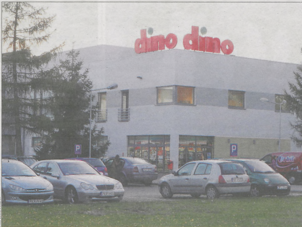
Na terenie kraju „Dino” ma prawie 300 marketów

Do dużych firm działających na terenie gminy Krotoszyn zaliczany jest również zakład Teomina , którego działalność polega na uszlachetnianiu odzieży (wykańczanie materiału poprzez nadawanie mu nowych lub lepszych cech, podnoszących ich właściwości użytkowe) dla klientów z Unii, głównie z Belgii, Danii, Francji i Niemiec. Działalność Teominy w sezonach produkcyjnych pozwala na zatrudnienie wówczas ok. 150 osób.