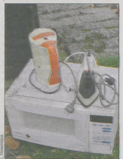
Mieszkańcy pozbywali się niepotrzebnych sprzętów

Pamiętajmy, że zaleganie w naszych domach elektrośmieci jest nie tylko niewygodne, ale też niebezpieczne dla naszego zdrowia, ponieważ zużyty sprzęt zawiera trujące substancje. Elektrośmieci powinny