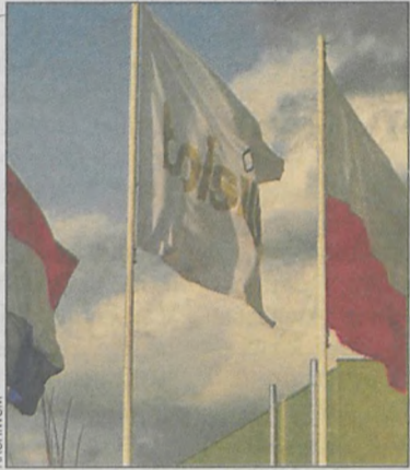
Mieszkańcy Zalesia cieszą się z rozbudowy. Liczą, że wzrosnie zatrudnienie