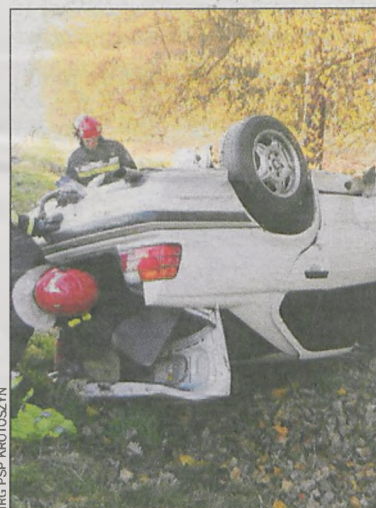
Pojazd zjechał do rowu i dachował

Mężczyznę przewieziono do szpitala. – Pobrano mu krew do badań na zawartość alkoholu. Policjanci wyjaśniają okoliczności i przebieg zdarzenia – mówi Włodzimierz Szał, rzecznik prasowy policji w Krotoszynie. Mężczyzna z obrażenia trafił na oddział chirurgiczny, ale już 28 października wypisał się na własną odpowiedzialność.