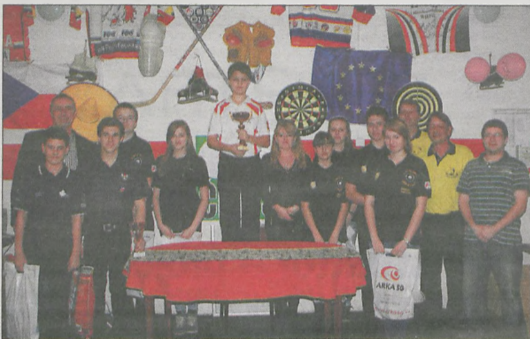
Polska ekipa spisała się w Czechach bardzo dobrze