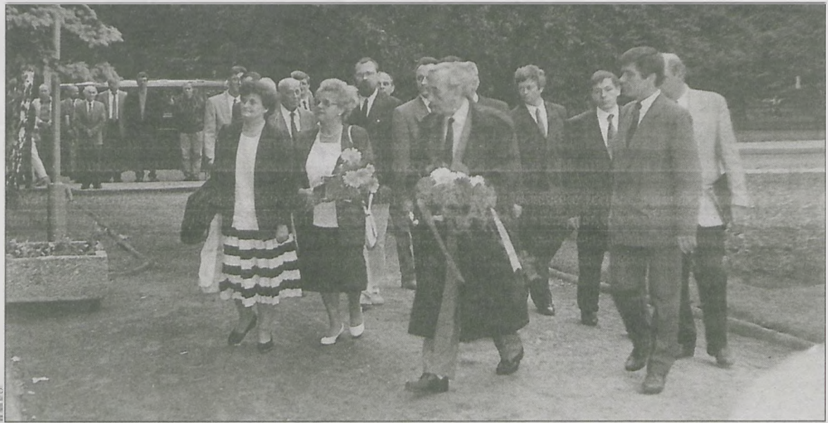
Tadeusz Mazowiecki z grupą działaczy Komitetu Obywatelskiego i Unii Wolności przed pomnikiem powstańców przy ul. Zdunowskiej.