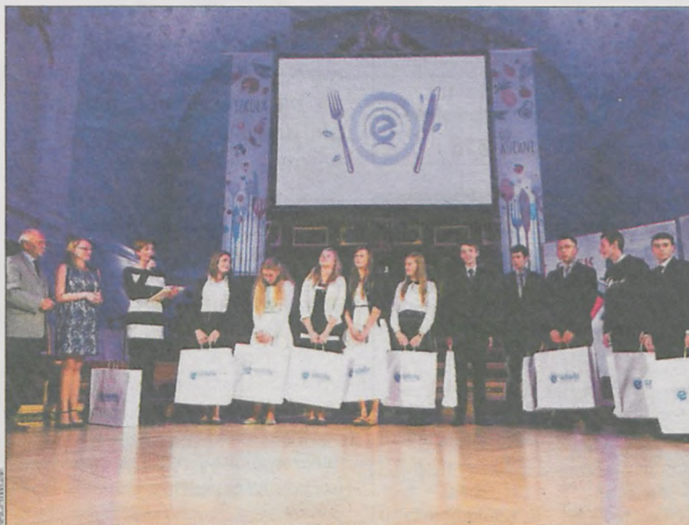
Rozdrażewscy gimnazjaliści podczas uroczystej gali w Poznaniu