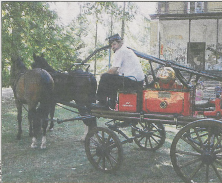
Odrestaurowana sikawka konna