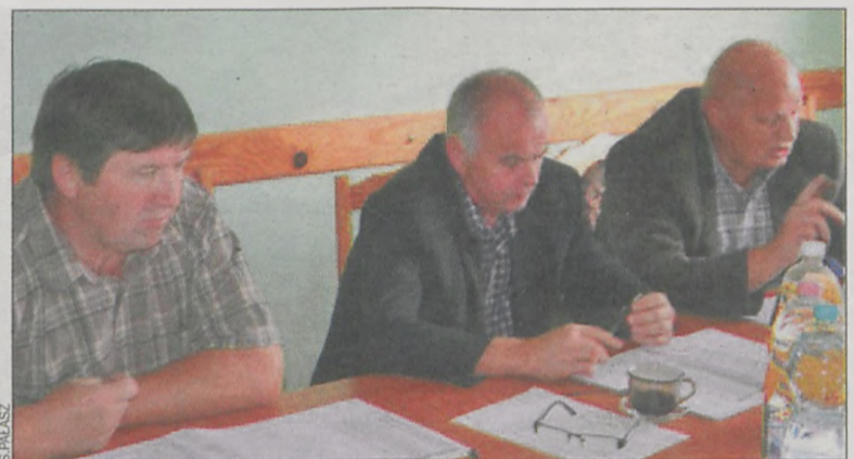
Radni sprawą mieszkań muszą zająć się jeszcze raz