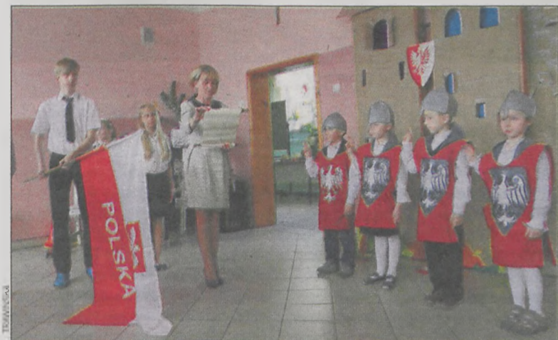
Dzieci ślubowały być dobrymi uczniami