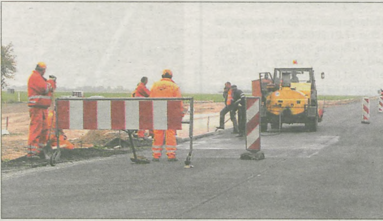
(era) Drogowcy remontują „dwunastkę” na odcinku Jaraczewo-Borek Wielkopolski

W ciągu niespełna roku to już kolejna inwestycja na drodze krajowej nr 12 na odcinku Jarocin-Leszno. Pod koniec ubiegłego roku oddano do ruchu nowo wybudowaną obwodnicę Borku Wielkopolskiego.