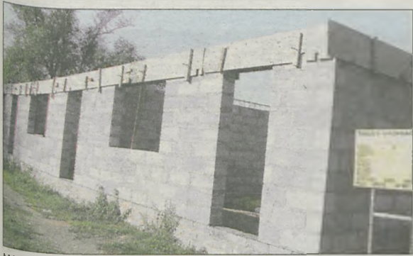
W budowanym w Mieszkowie obiekcie powstaną mieszkania dla wychowanków Domu Dziecka w Górze

Cztery mieszkania powstają w Mieszkowie. Wychowankowie z Domu Dziecka z Góry będą uczyć się w nich samodzielności życia.