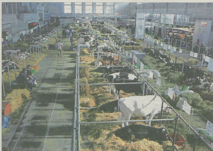
Nowością na targach była hala zaaranżowana na nowoczesną oborę

Rolnicy, którzy przyjechali w tym roku do Poznania, mogli nie tylko zapoznać się z nowościami rynkowymi, a także skorzystać z fachowej konsultacji doradców, reprezentujących