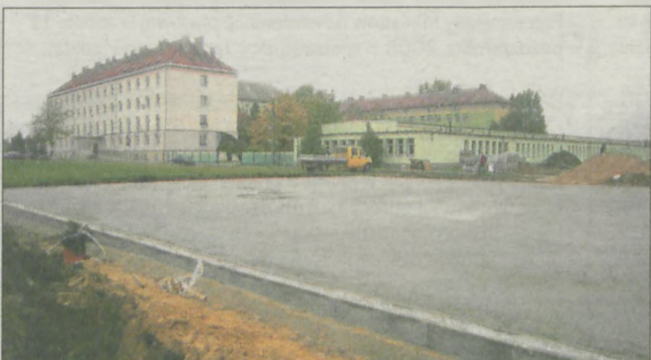
Rozpoczęła się budowa boiska wielofunkcyjnego przy Zespole Szkół Ponadgimnazjalnych nr 2 w Jarocinie