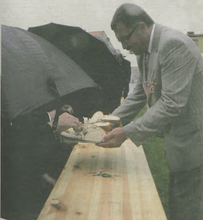
"A Stachu starosta, chociaż jest miastowy, równy chłop jest z niego, nie zadziera głowy. Samochodu nie ma, nie ma też motora, kasę inwestuje w wyspy Bora Bora".