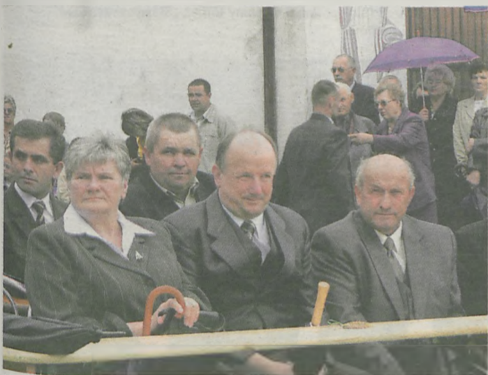
"Burmistrza Jajczyka w prasie opisali, że Moreny jeszcze do dziś nie oddali. Wiemy, że pan prasą to się nie przejmując, bo na pewno kiedyś ją wyremontuje". (na zdjęciu w środku w pierwszym rzędzie)

Więcej przyspiewek w wykonaniu "Jaraczewiaków" oraz zdjęć na naszym portalu: