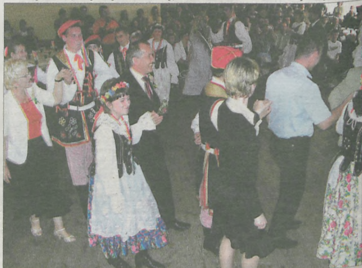
Publiczności bardzo się spodobał wspólny taniec „Sławoszewiaków” z zaproszonymi gośćmi