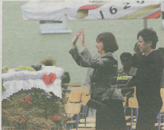
Niektórzy próbowali zaklinać deszcz, inni starali się suszyć krzesła