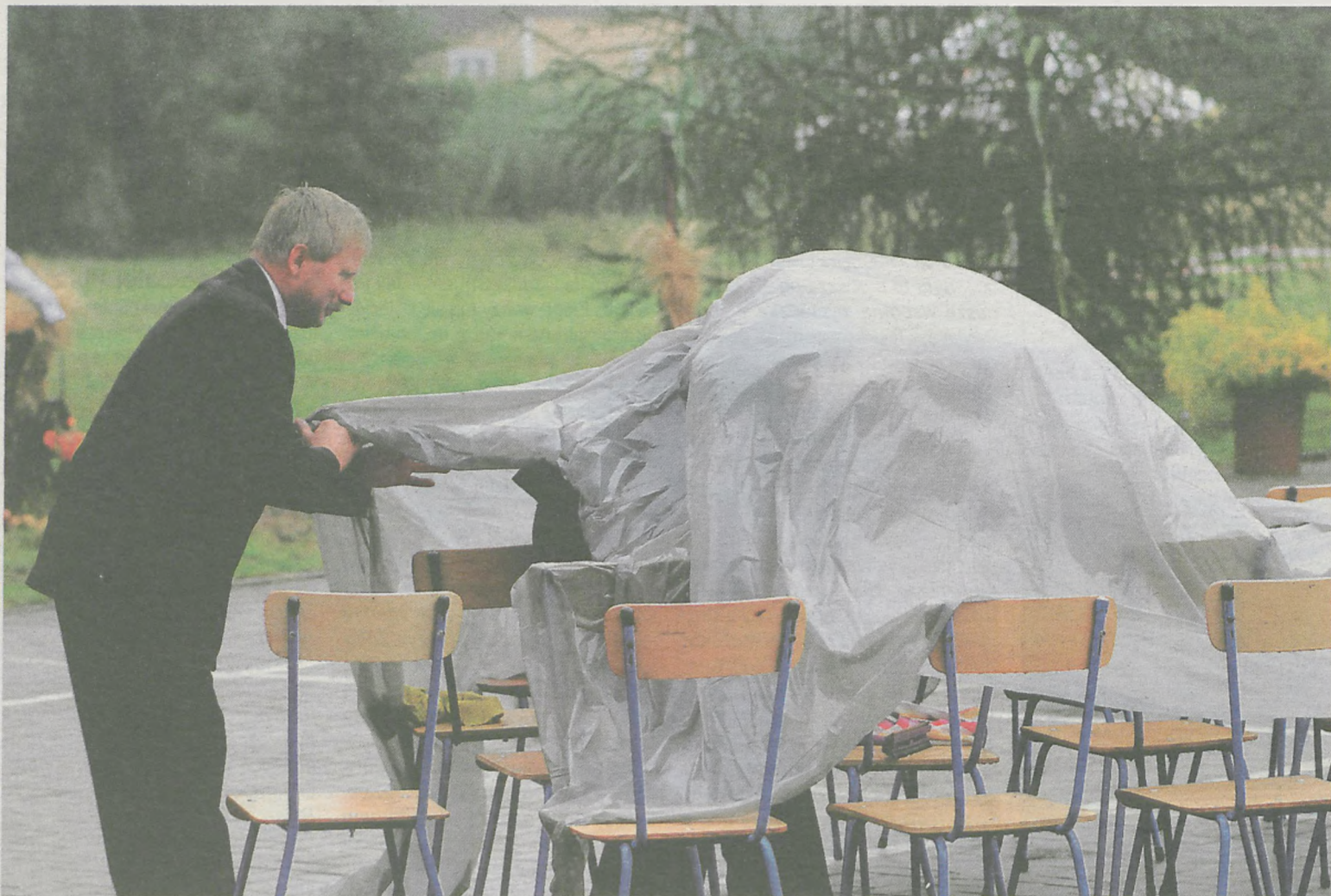
Przed deszczem chowano wszystko - sprzęt pod folią...