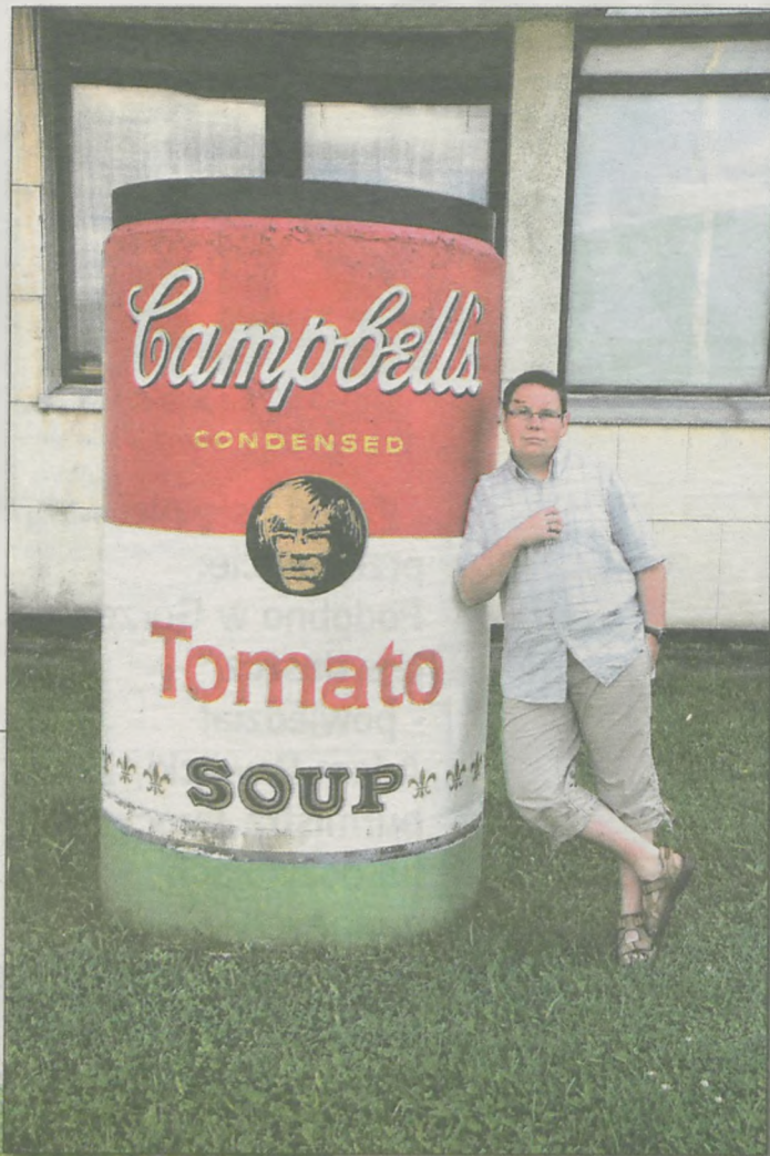
Przed muzeum Andy Warhola w słowackich Medzilaborcach

Zwiedzanie regionu zaczęli od Krynicy, gdzie skusito ich muzeum najslynniejszego polskiego Łemka - Nikofora. Potem zahaczyli jeszcze o słowacką miejscowość Medzilaborce, gdzie mieści się muzeum najbardziej znanego na świecie przedstawiciela nurtu artystycznego określanego pop-artem Andy Warhola, mającego korzenie łemkowskie. W muzeum o wdzięcznej nazwie "Koszmarek" zgromadzono wiele rzeczy osobistych Warhola. - To jest przykład, jak nie należy urządzać muzeum, mając tak cenne rzeczy - opowiada Kaźmierczak. Muzeum zrobione bez pomysłu, dobrego smaku. Kłują ob-