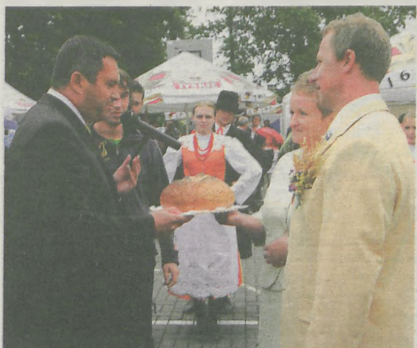
Starostami dożynek przekazali chleb burmistrzowi Jarocina