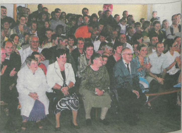
Uroczystość dożynkowa ze względu na deszcz została przeniesiona do świetlicy. Mieszkańcy nie zawiedli