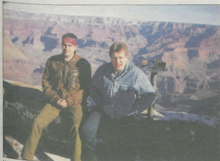
Wielki Kanion, Kolorado

wspomina. Kiedy dorosł, przyszedł czas na zagraniczne wojaże. - Filipiny, Chiny, Kanton, Pekin, Syberia, Stany Zjednoczone, Kanion Kolorado, Las Vegas, Los Angeles - wlicza jednym tchem miejsca, które odwiedził. Był na wakacjach w Egipcie i Tunezji, choć Afryka go nie zachwyciła. Jedynym kontynentem, na którym stopy nie postawił burmistrz Jarocina jest Antarktyda. Nie było go także na Arktyce.