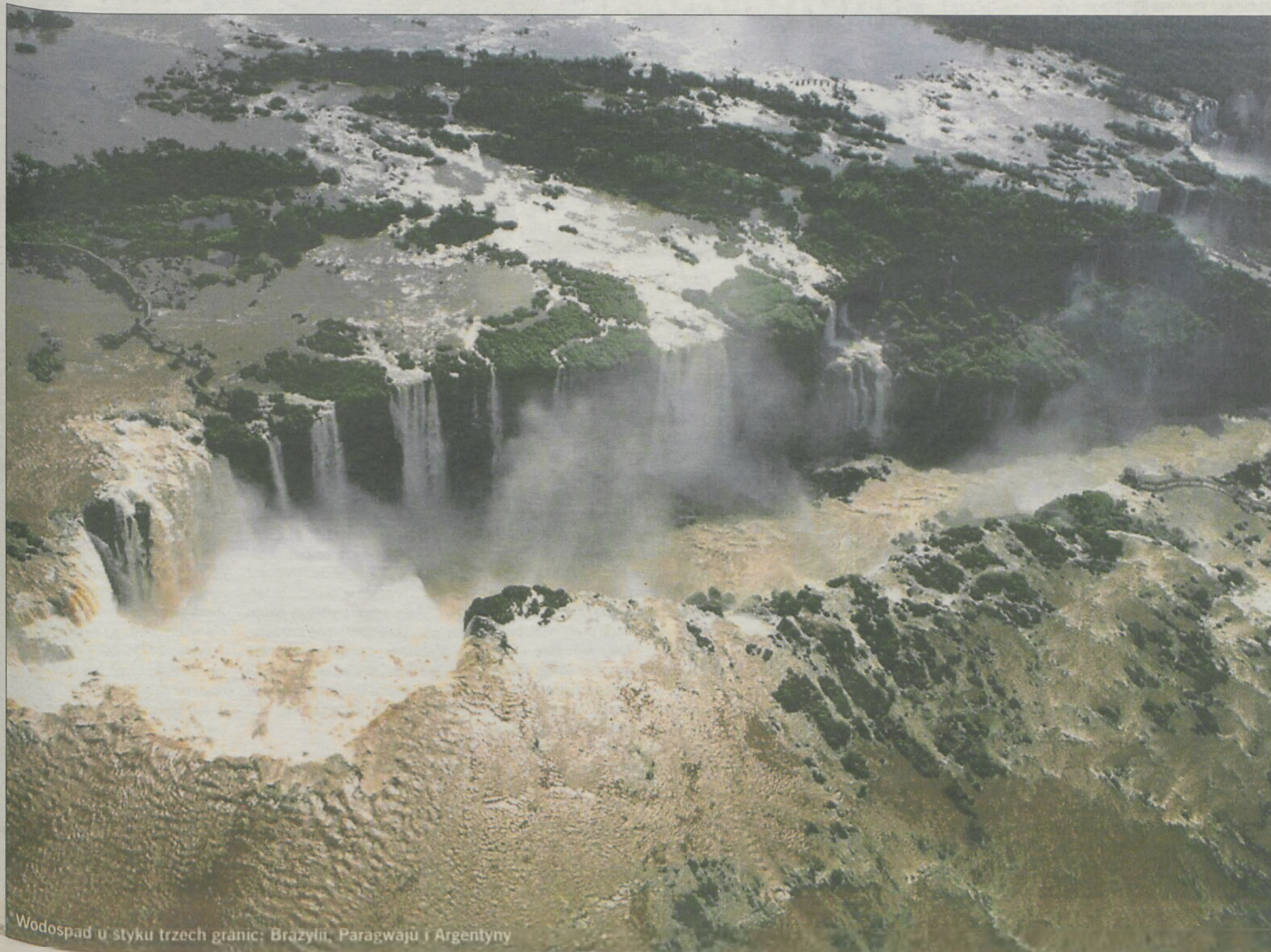
Wodospad u styku trzech granic: Brazylii, Paragwaju i Argentyny