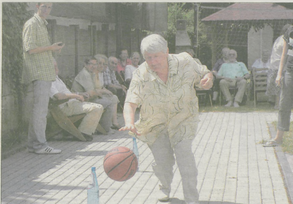
W poniedziałek rozgrywane były zawody o tytuł mistrza wczasów. Rywalizowano m.in. w slalomie z piłką. Najlepsi pokonywali trasę w kilka sekund