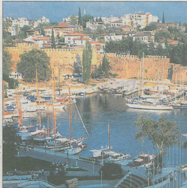
Antalya, turecka prowincja, w której znajduje się Korkuteli, partnerskie miasto Jarocina

Po trzyletniej przerwie ruszamy z jedenastą edycją konkursu „Wakacyjne szlaki”. Przez ponad dekadę do redakcji „Gazety” przysły tysiące pocztówek i setki zdjęć z najodleglejszych zakątków świata: Stanów Zjednoczonych, Meksyku czy Australii. Jarociniacy dzielili się z czytelnikami wrażeniami z wojaży po Hiszpanii, Grecji, Egipcie, Malcie, Cyprze i krajach skandynawskich. Opisywali, jak ciekawie spędzić urlop w urokliwych miejscach zaledwie kilkadziesiąt kilometrów od Jarocina: w Cichowie, Skorzęcinie, Zaniemyślu i Powidzu.