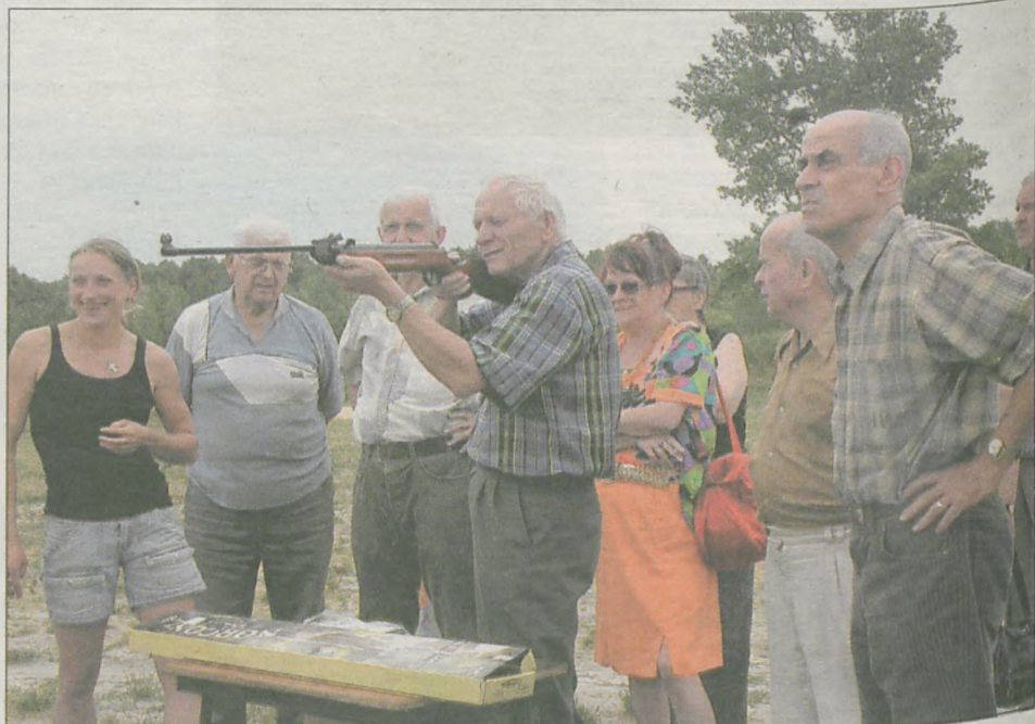
Podczas pikniku w Radlinie emerycy rywalizowali w strzelaniu z wiatrówek