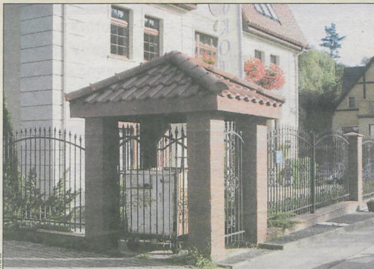
Śmietnik powinien być osłonięty daszkiem

Śmietnik, jako element małej architektury, powinien wyglądem nawiązywać do otoczenia. Ponadto warto zadbać, aby był nie tylko funkcjonalny, ale i estetyczny, szczególnie, gdy usytuowany jest od frontu.