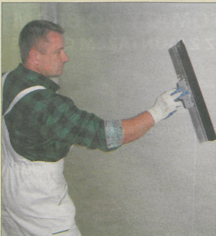
Gładzenie powierzchni ściany zaprawą z gładzi gipsowej