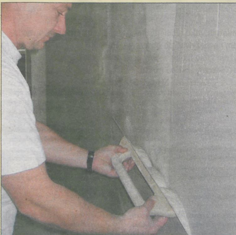
Wyrównywanie powierzchni ściany zaprawą z gipsu szpachlowego

Gipsy szpachlowe są twardsze od gładzi gipsowych, mniej od nich elastyczne, za to mocno trzymają się podłoża. Dlatego szeroko stosuje się je jako spoiwa do prac wykończeniowych, renowacyjnych, a także do montażu prefabrykatów gipsowych.