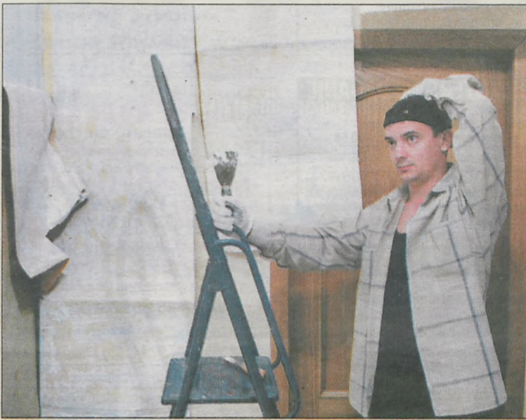
Pozornie to zadanie trudne, ale sprawny majsterkowicz na pewno sobie z nim poradzi

Nie polecamy przyklejania nowej tapety na starą, ponieważ nie możemy do końca być pewni, jak zachowa się stara tapeta pod wpływem kleju i obciążenia jej nową powłoką. Pomysł, aby starą ta-