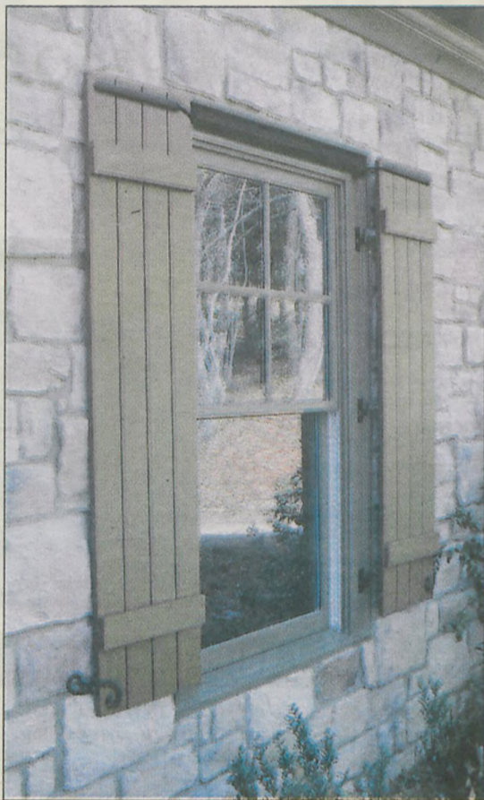
Okiennica z systemem Night and Day

Rolety czy okiennice, drewniane a może z PCV, montowane z zewnątrz czy wewnątrz – oferta rynkowa jest bardzo duża, a możliwości wiele.