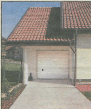
Listwy dylatacyjne zapobiegają pękaniu

Po związaniu pierwszej wylewki, na to mocne i stabilne podłoże wylewa się 10 cm warstwę betonu lub posadzki cementowej. W celu jej dodatkowego wzmocnienia warto zatopić w nią gotową siatkę zbro-