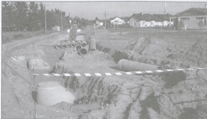
Najdroższa budowa w historii Mosiny