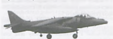
Ciekawym samolotem jest Harrier. (przyleciało 6 sztuk) Reprezentował on Siły Powietrzne Wielkiej Brytanii.