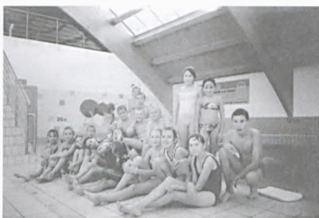
Wyjazd na pływalnię do Szamotuł - fot. arch.SP4

Nauczycielki zorganizowały również wyjazd na pływalnię do Szamotuł. Radość dzieci była przeogromna. Jedne doskonaliły umiejętność pływania, inne baraszkowały w płytkim basenie, wszyscy nieustannie korzystali ze wspaniałej zjeżdżalni. Po wysiłku fizycznym każdemu