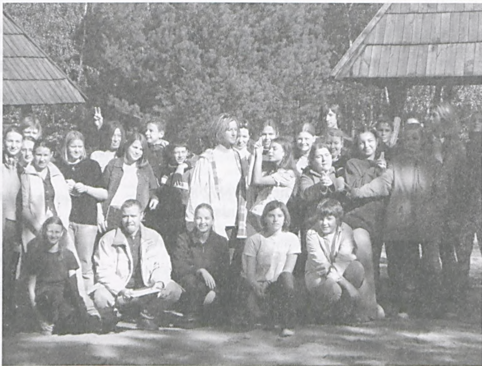
Rajd do Wielkopolskiego Parku Narodowego - fot. z arch. Gimnazjum nr 2