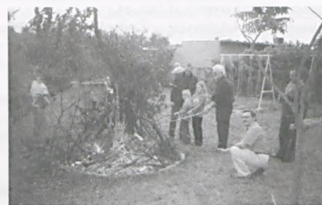
Działkowcy podczas pieczenia kielbasek przy ognisku na placu zabaw