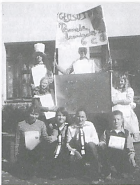
Kampania wyborcza

Kiedy nadchodzi ten najważniejszy dzień kampania zostaje zakończona, bowiem w dniu wyborów obowiązuje oczywiście cisza wyborcza. Od godziny 8.00, do specjalnie przygotowanego lokalu wyborczego, przychodzą wszyscy