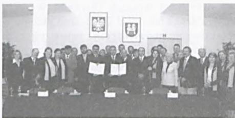
Delegacja brazylijska w Powiecie Poznańskim