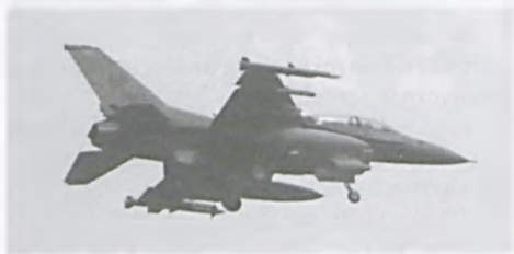
Najliczniej (w sumie 33 tego typu samoloty) zaprezentowały się F – 16.

2) 4.09. zdjęcie osoby z suwnicy na terenie Zakładów Chemicznych w Luboniu gdzie nastąpił zgon. Oprócz naszej jednostki udział wzięły także JRG-4, Szkoła Aspirantów Pożarnictwa z drabiną SD-30, Policja,