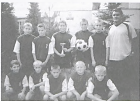
Turniej piłkarski w SP 4