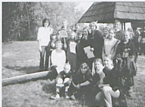
Na trasie rajdu