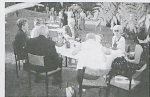
Obchody 20-lecia Przedszkola Nr 5