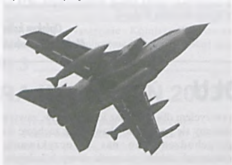
Tornado służy w Siłach Powietrznych Niemiec. Przyleciało 9 myśliwców.